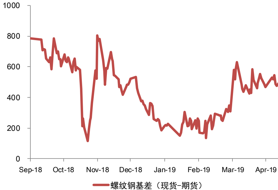
图表：螺纹基差监测