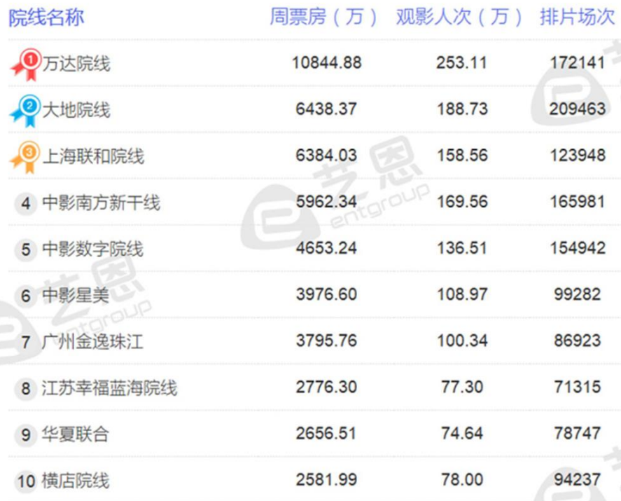
图 1：2019年第18周（2019.5.6-2019.5.12）全国院线票房 TOP10

据艺恩电影智库显示，院线排名方面，2019年第18周（5.6-5.12）万达院线以1.08亿票房排名第一，票房占比15.12%；大地院线6438.37万票房排名第二，票房占比8.97%；上海联合院线以6384.03万票房排名第三，票房占比8.90%。