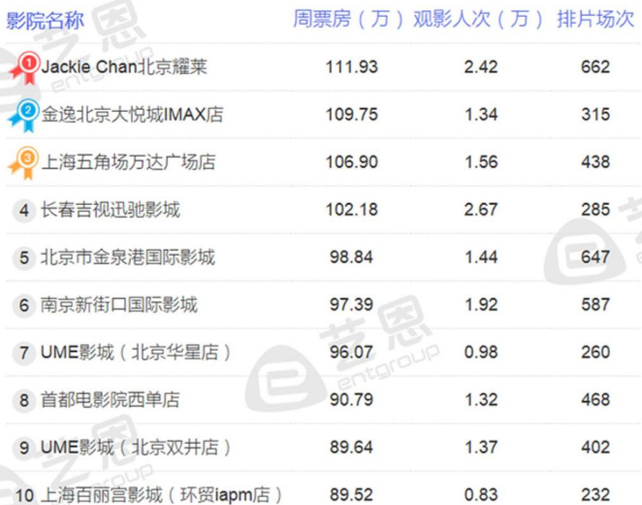
图 2：2019年第18周（2019.5.6-2019.5.12）全国影院票房 TOP10