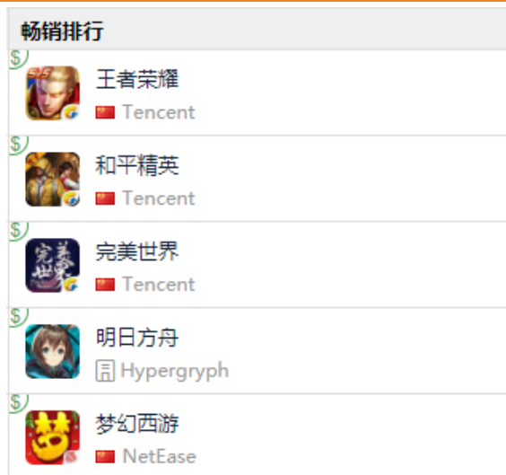
图 13: App Store 中国区畅销榜 TOP5