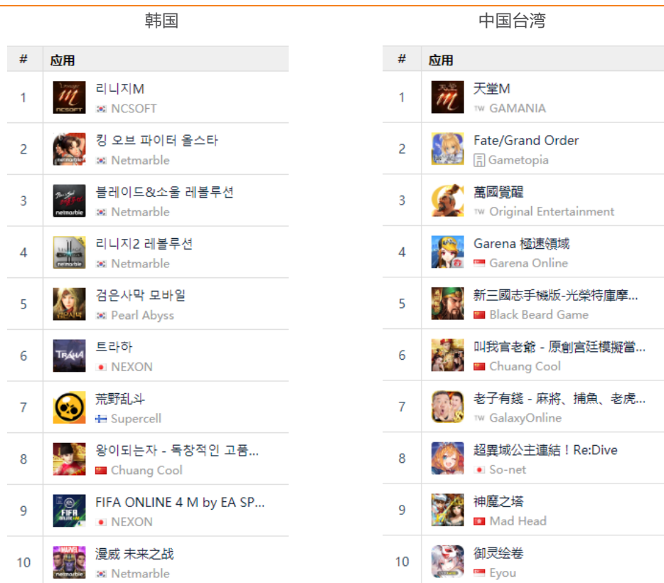
图 15：韩国及中国台湾市场 Google Play 游戏畅销榜排名

腾讯《极速领域》、黑胡子发行《新三国志》、创酷互动《叫我官老爷》在中国台湾市场中排名第四、第五、第六。