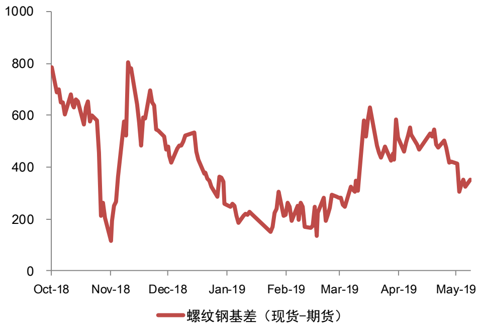
图表：螺纹钢基差监测