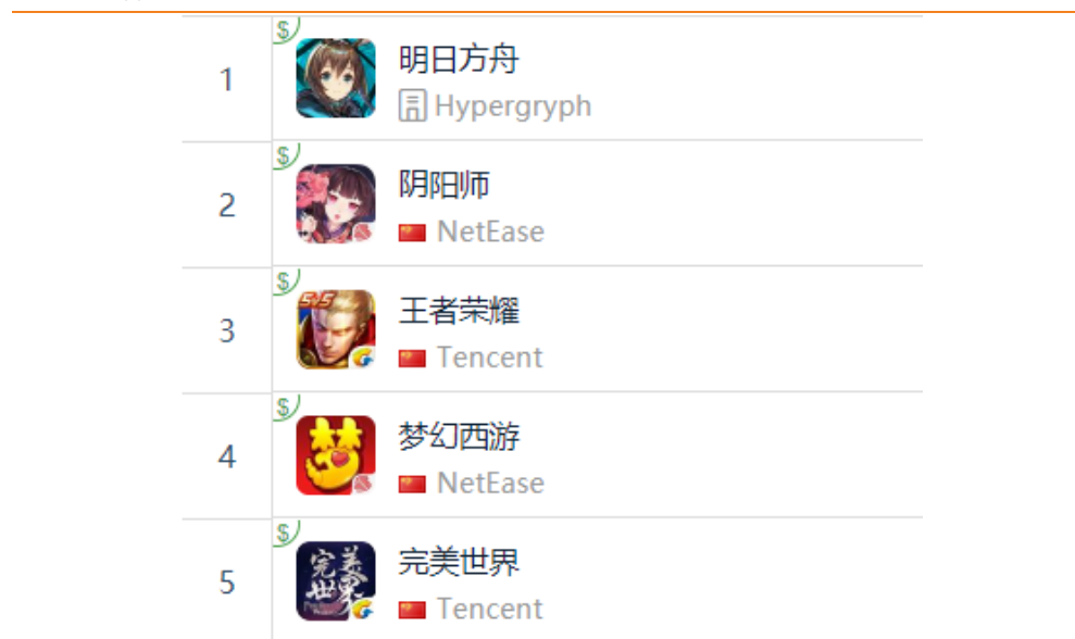
图 13：App Store 中国区畅销榜 TOP5

App Store 2019 年 5 月 31 日数据中国区畅销榜排行前三：鹰角网络《明日方舟》、网易《阴阳师》、腾讯《王者荣耀》，此外，网易《梦幻西游》排名第四，完美世界出品腾讯发行《完美世界》排名第五。