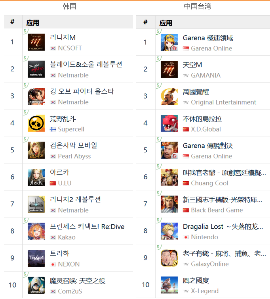
图 15：海外主要市场 Google 游戏畅销榜排名