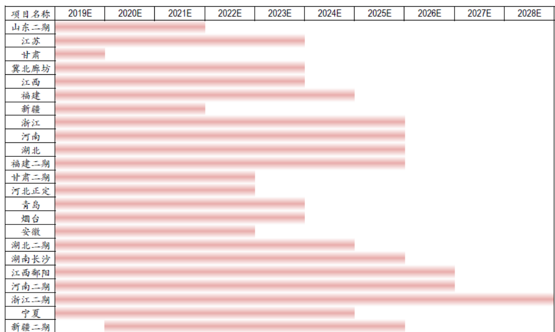
图表 2. 公司部分在手项目效益分享期示意图