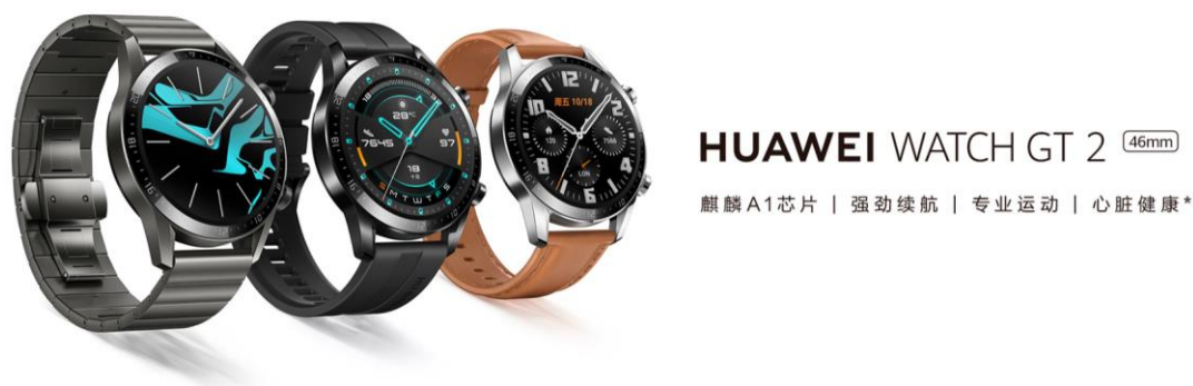
图表4 华为 WATCH GT 2 手表