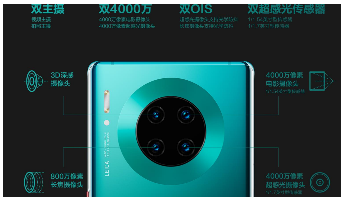
图表3 华为 Mate30 Pro 四摄