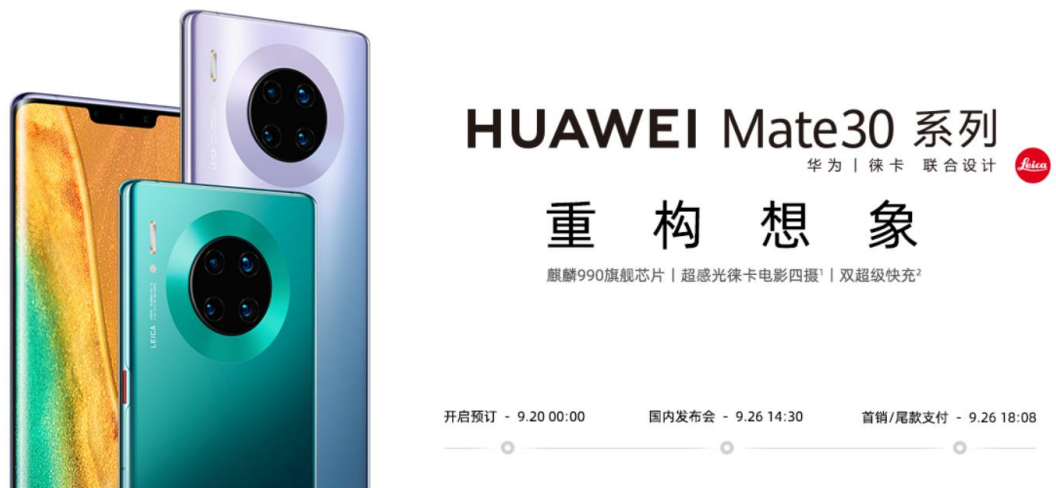
图表1 华为 Mate30 系列手机发布