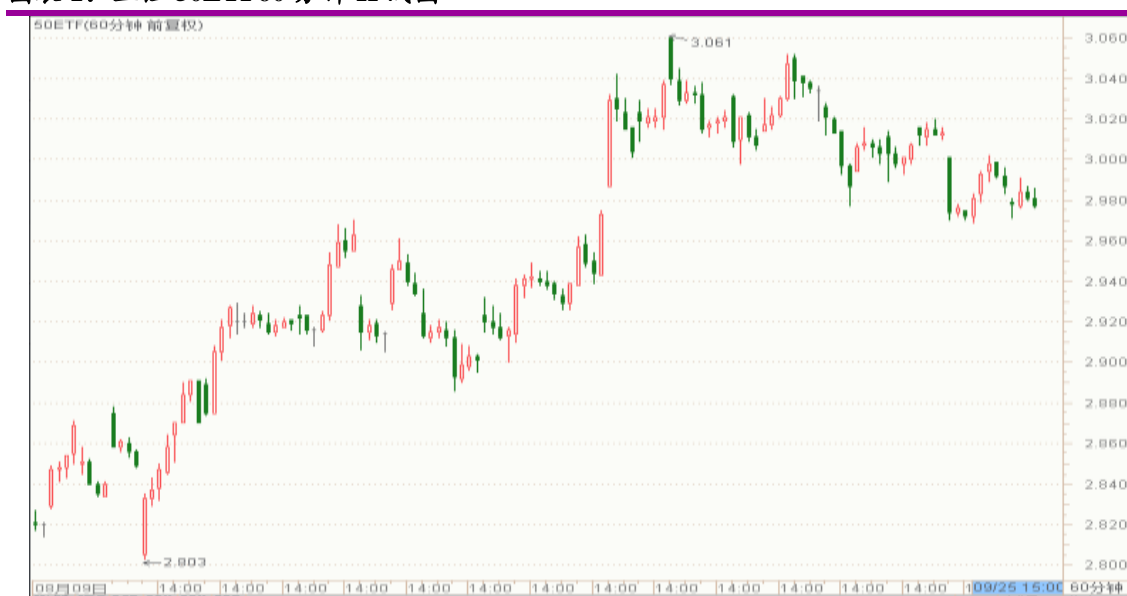
图表 1：上证 50ETF60 分钟 K 线图