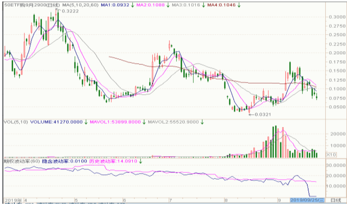
图 8： 9 月实值认购期权“50ETF 购 9 月 2900”日 K 线图及隐含波动率变化图