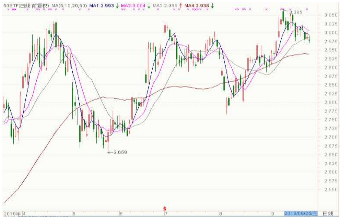
图表 2：上证 50ETF 日 K 线图（前复权）

从下面的日 K 线图来看，50ETF 短期日均线转弱，继续留意消息面变化和 3.000 关口。