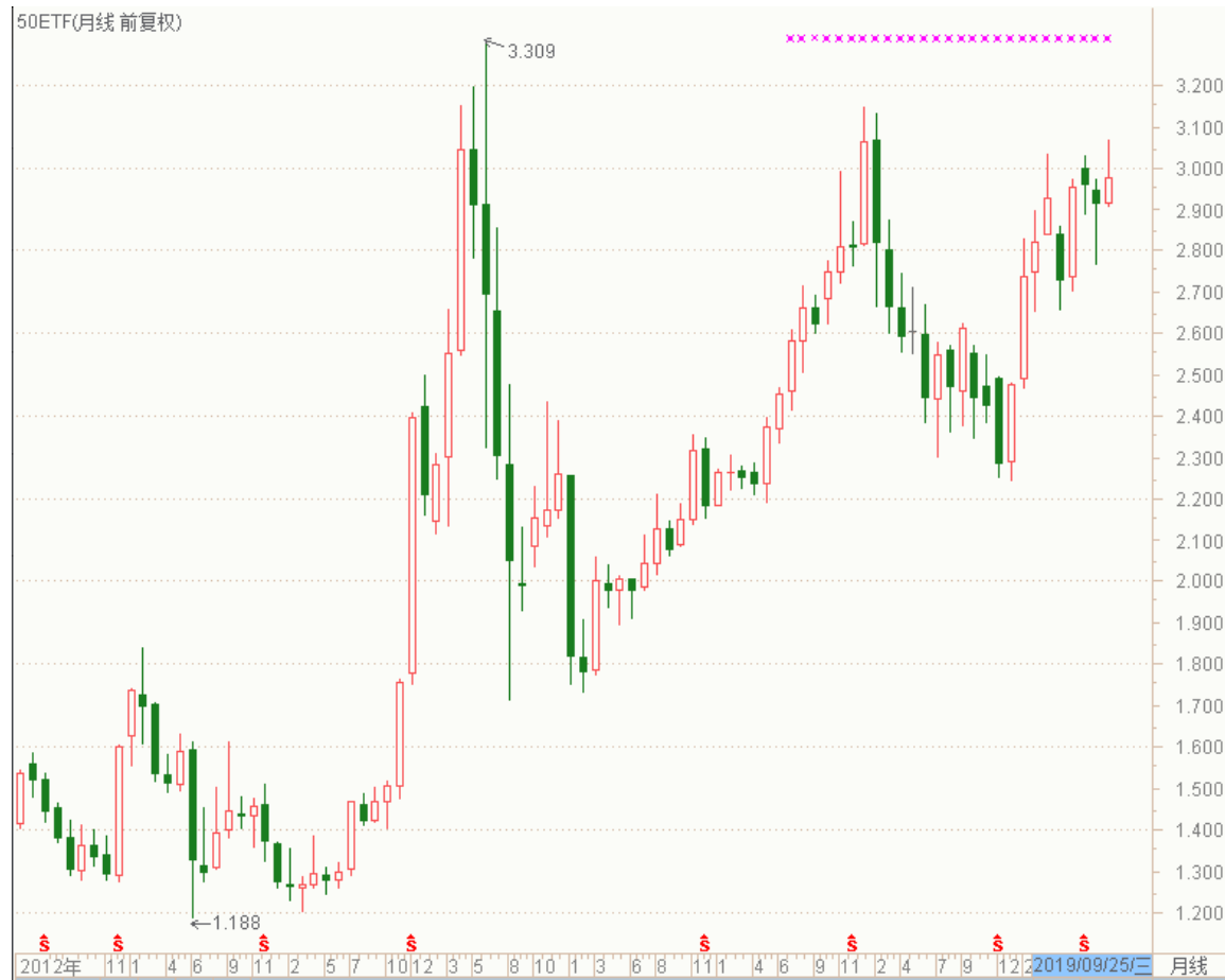
图表 4：上证 50ETF 月 K 线图

从以下的月 K 线图看，50ETF 8 月份收出长下影的月阴线，9 月份又收出上影月阳线。