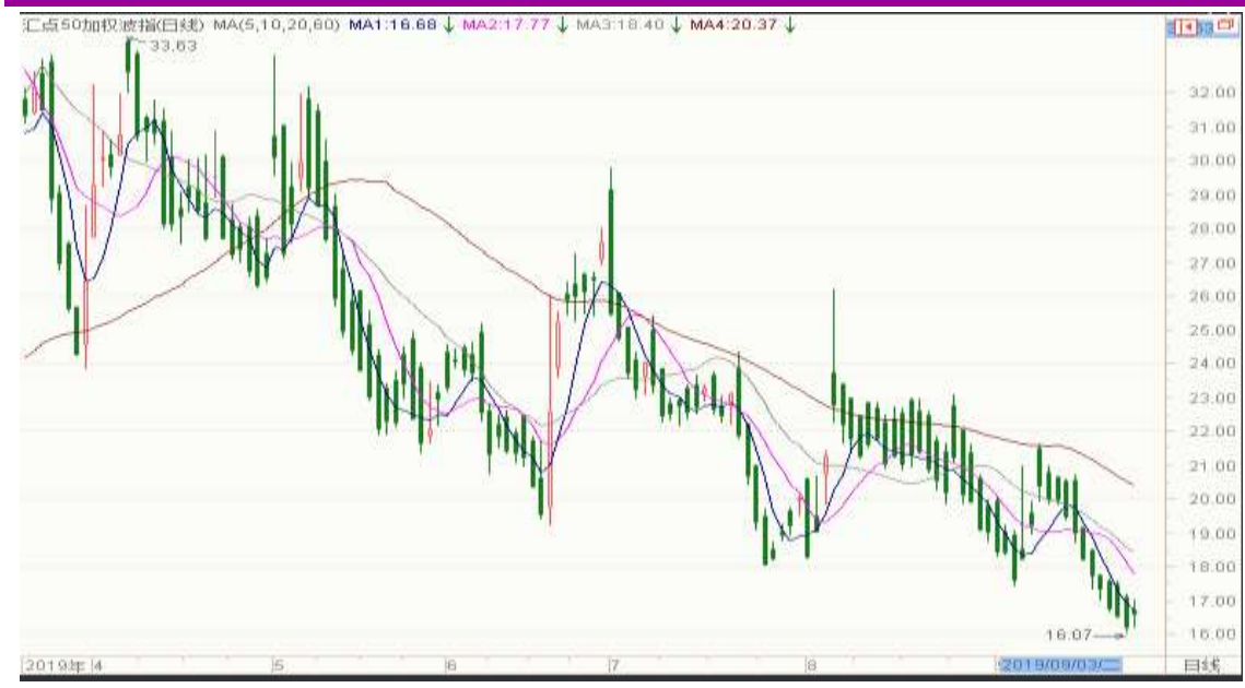
图表 7：来自汇点软件汇点 50 加权波指变化图（日线）