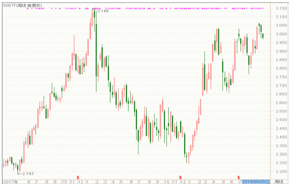
图表 3：上证 50ETF 周 K 线图