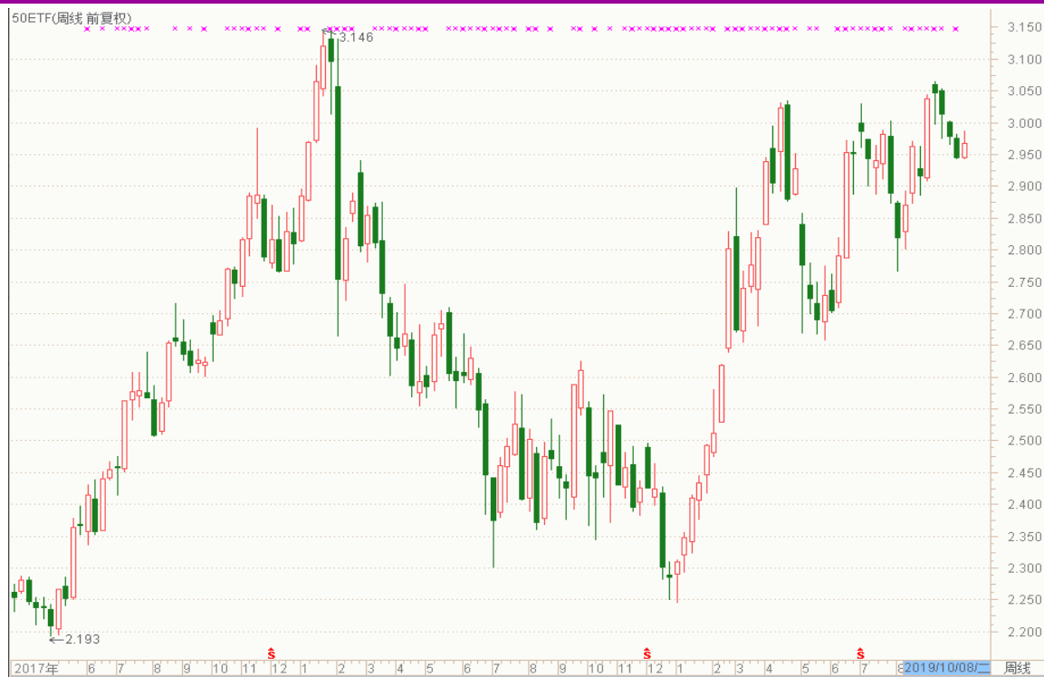
图表 3：上证 50ETF 周 K 线图