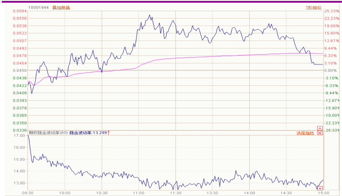
图表 6：10 月平值认购期权“50ETF 购 10 月 2950”日内走势图及隐含波动率变化图