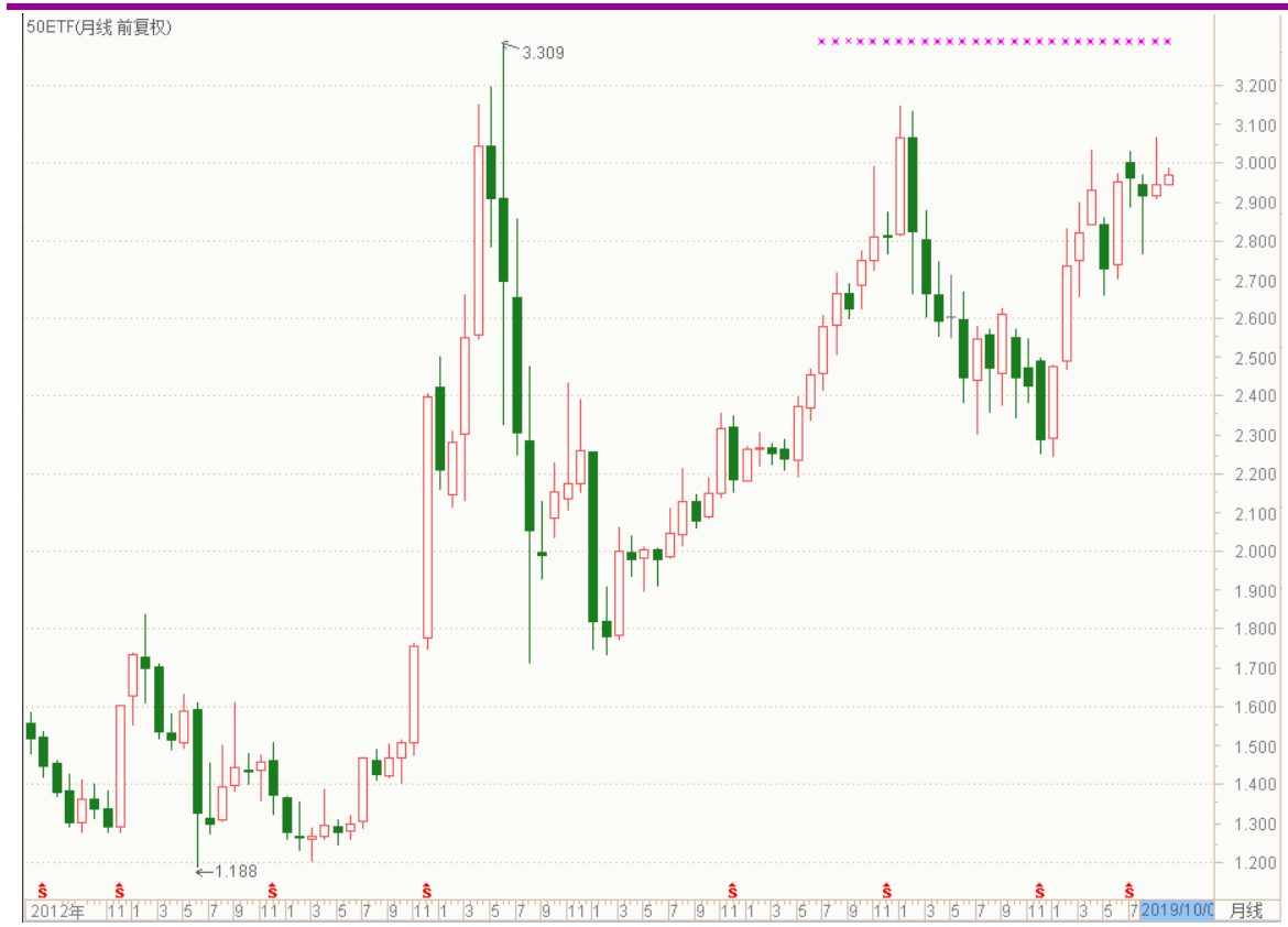
图表 4：上证 50ETF 月 K 线图

从以下的月 K 线图看，50ETF 9 月份收出带上影的小阳线，10 月初略有回稳。