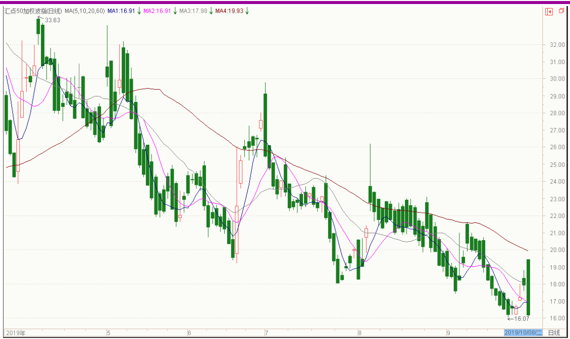
图表 8：来自汇点软件汇点 50 加权波指变化图（日线）