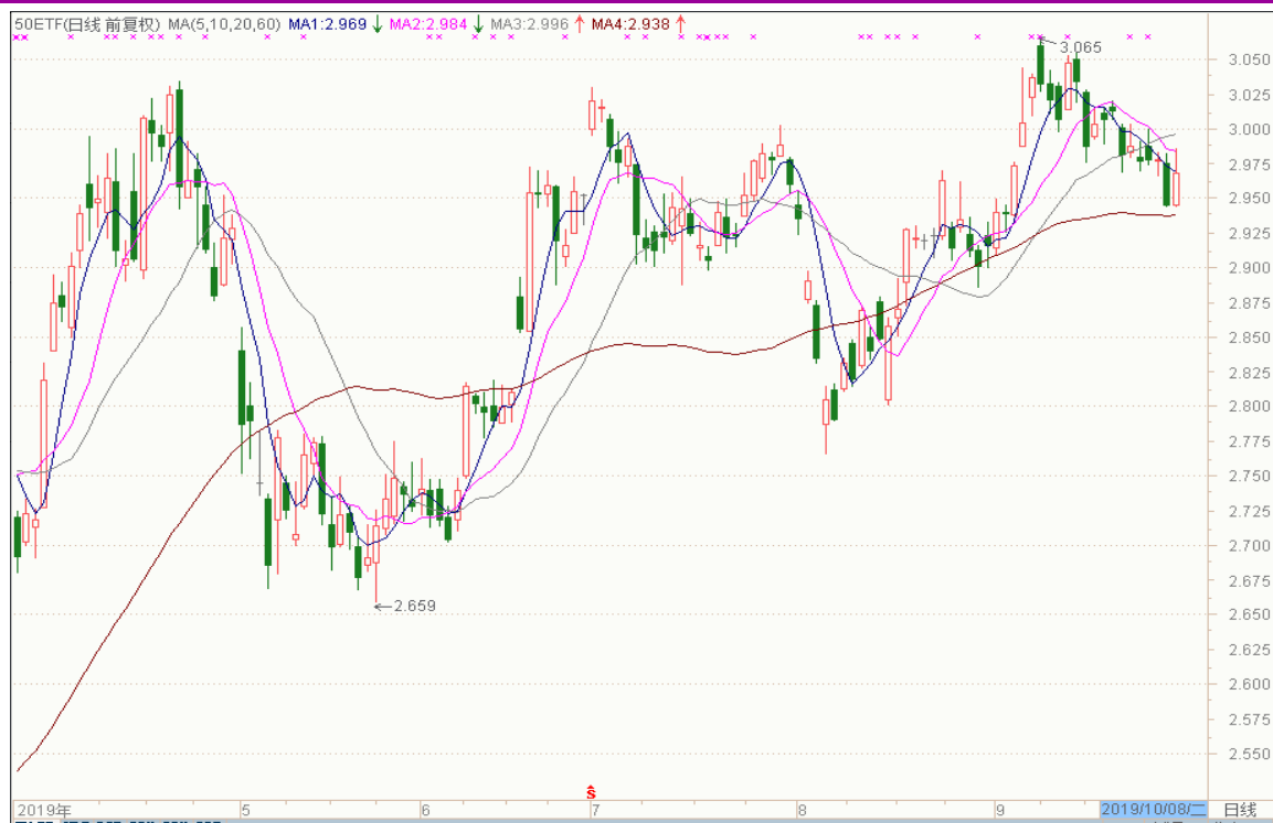
图表 2：上证 50ETF 日 K 线图（前复权）