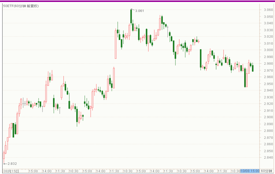
图表 1：上证 50ETF60 分钟 K 线图