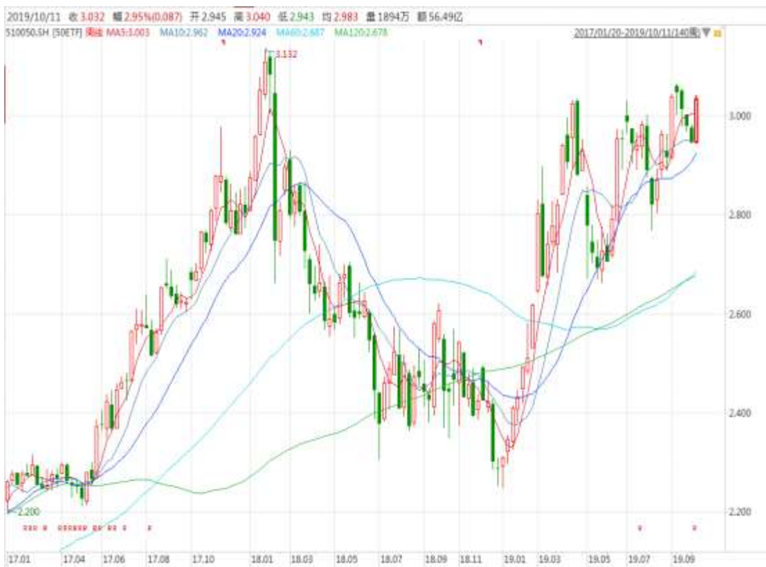
图表 3：上证 50ETF 周 K 线图