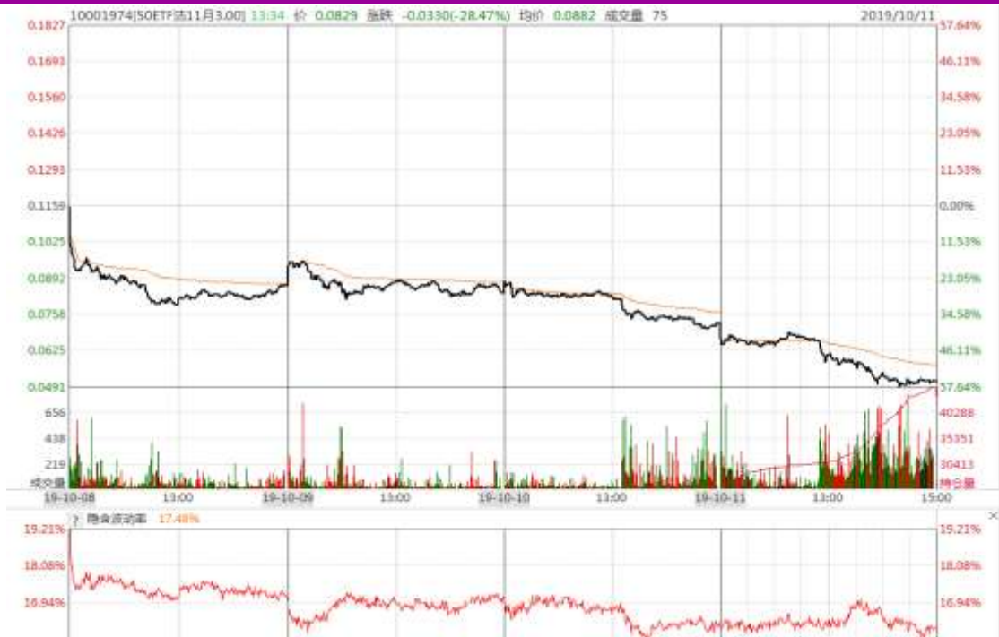
图表 12: 本周 11 月平值认沽期权“50ETF 沽 11 月 3000” 日内走势图及隐含波动率变化图