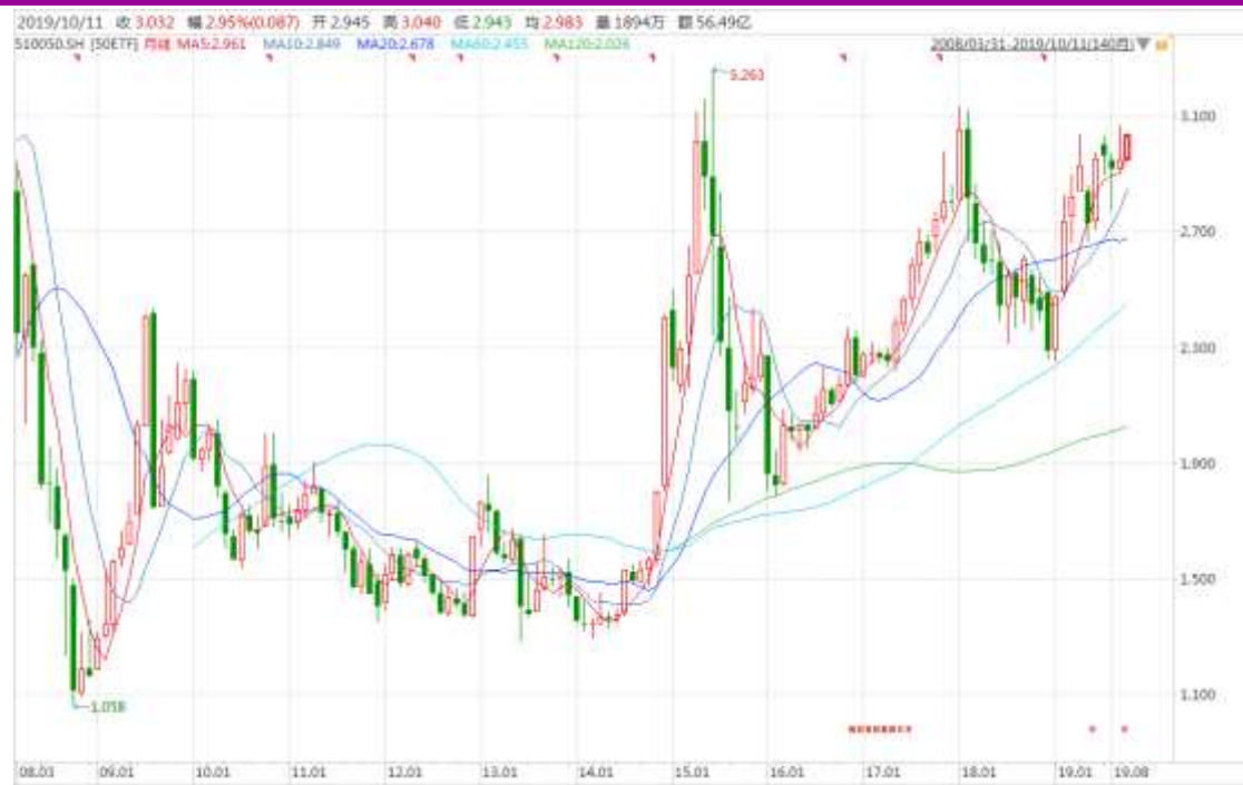
图表 4：上证 50ETF 月 K 线图