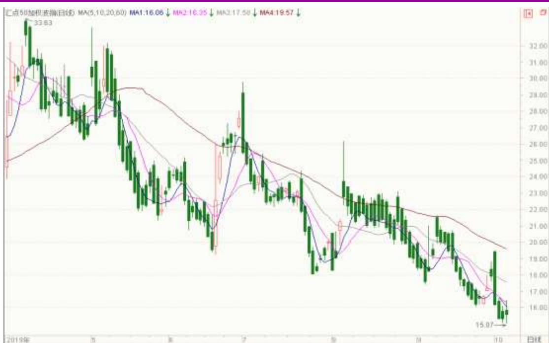
图表 13: 来自汇点 50 加权波指变化图

本周 11 月平值认沽期权标准合约“50ETF 沽 11 月 3000”明显下挫, 隐含波动率走低。11 月平值认购期权标准合约“50ETF 购 11 月 3000”隐含波动率为 14.27%; 11 月平值认沽期权标准合约“50ETF 沽 11 月 3000”隐含波动率为 16.14%。以下也提供来自汇点软件的汇点 50 加权波指变化图, 可分析参考。