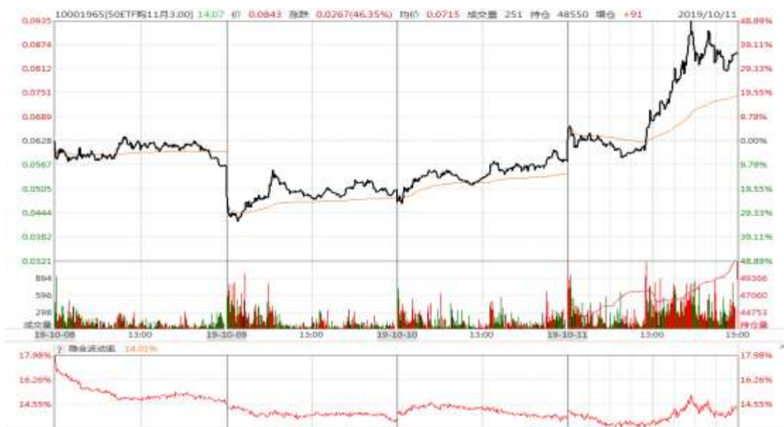
图表 11：本周 11 月平值认购期权“50ETF 购 11 月 3000”日内走势图及隐含波动率变化图