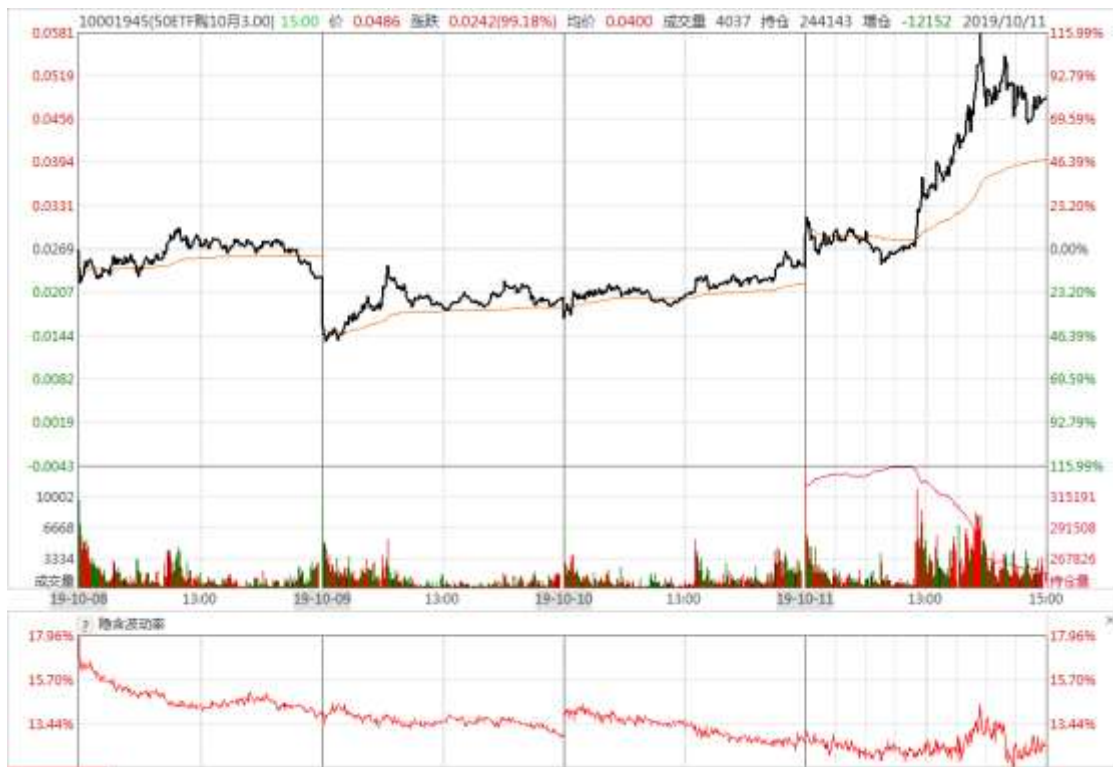
图 8：本周 10 月平值认购期权“50ETF 购 10 月 3000”日内走势图及隐含波动率变化图