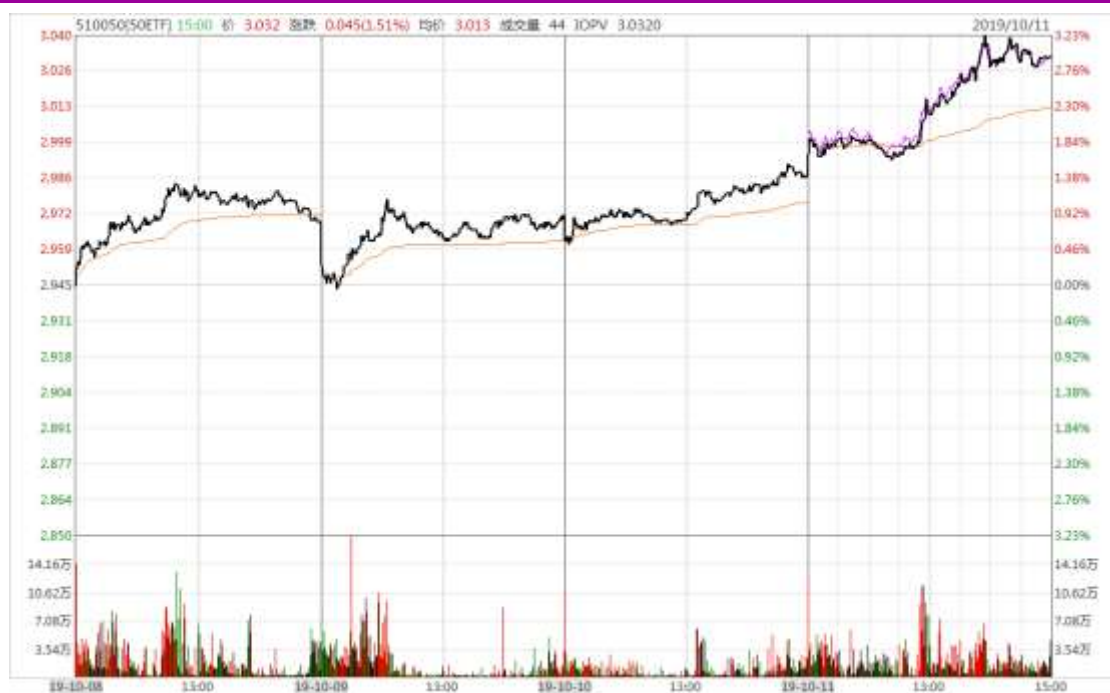
图表 1：上证 50ETF 本周的分时走势图

本周因国庆假期原因，仅为四个交易日，市场反弹动力强劲，连收四阳，周四、周五加速上行。全周收于 3.032，较上周收盘价上涨 0.087，周涨幅 2.95%，