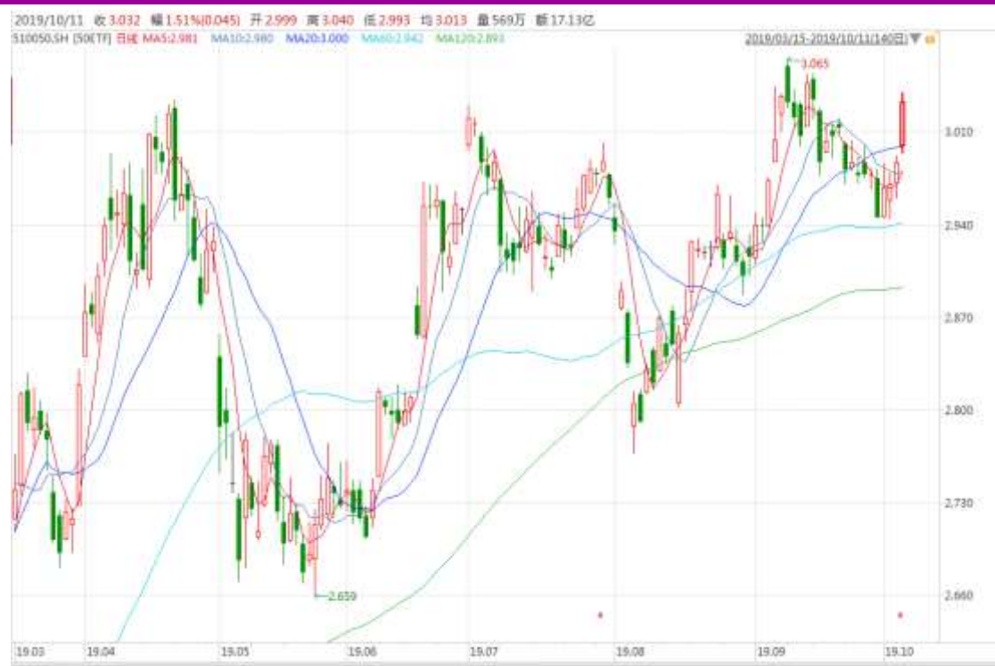
图表 2：上证 50ETF 日 K 线图（前复权）