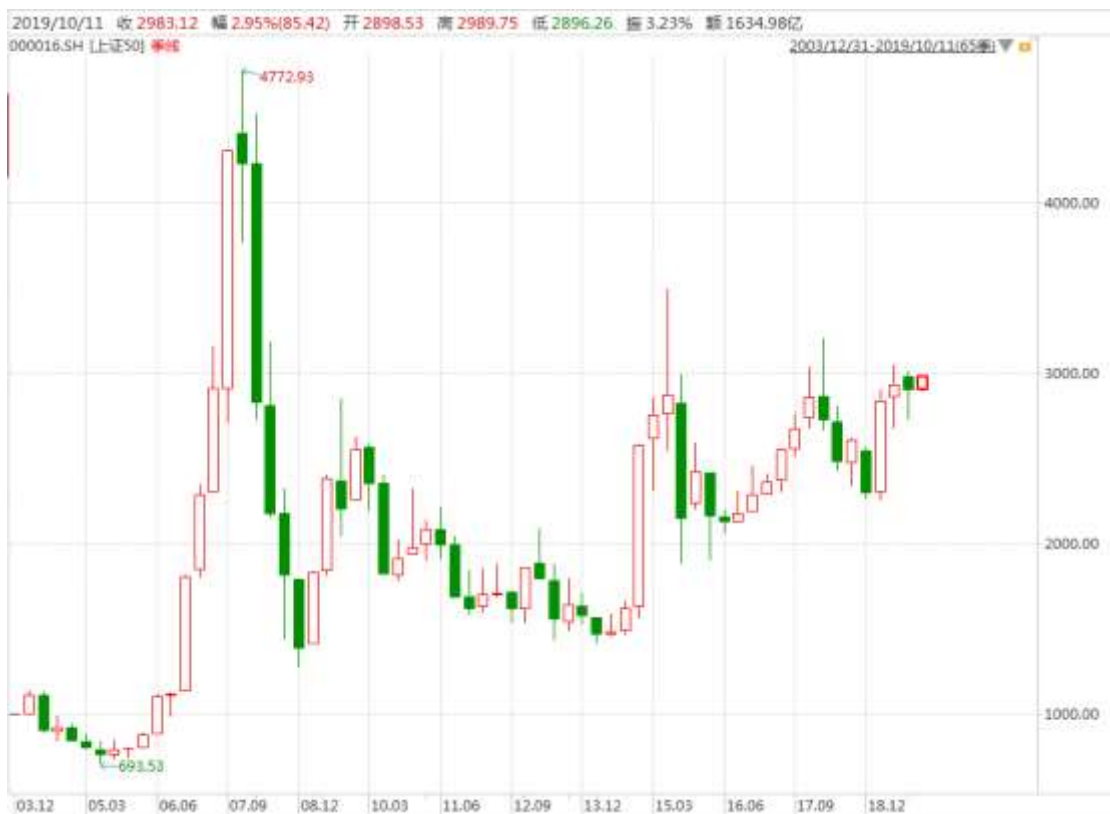
图表 5：上证 50 指数的季 K 线图