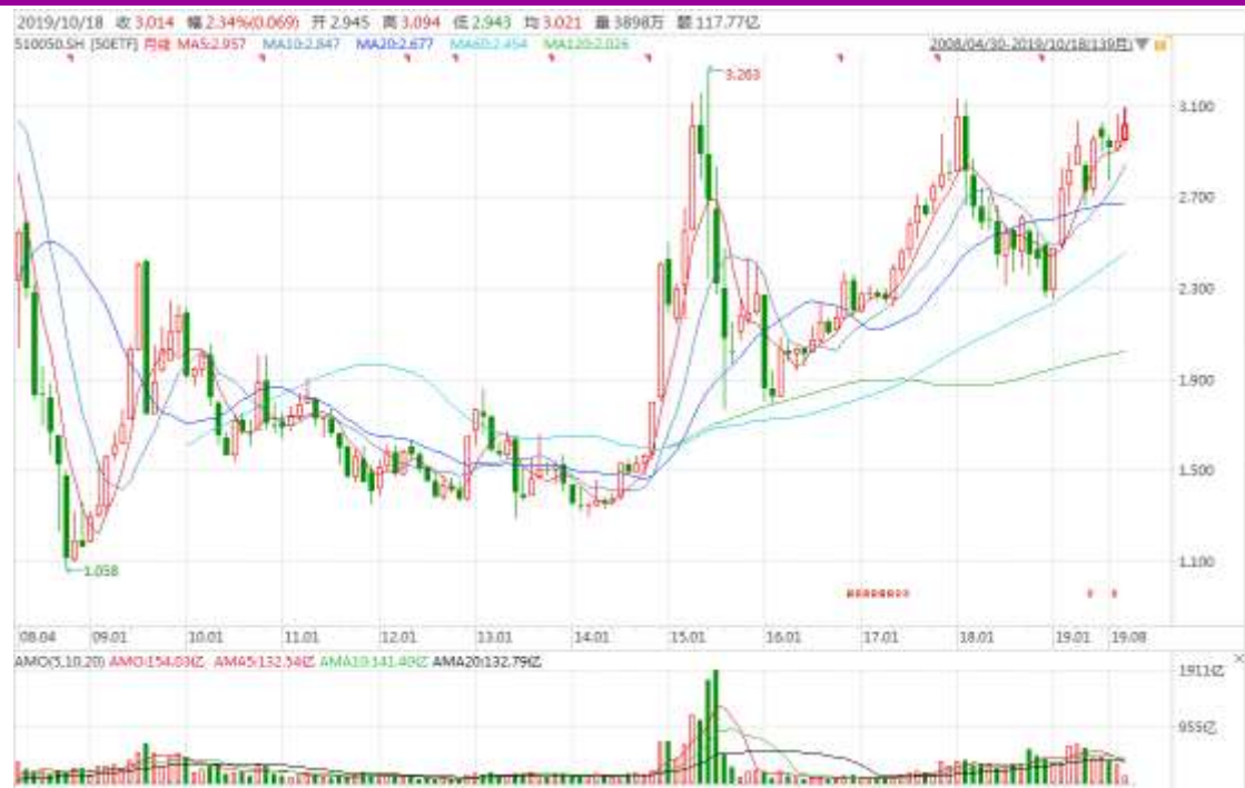
图表 4：上证 50ETF 月 K 线图