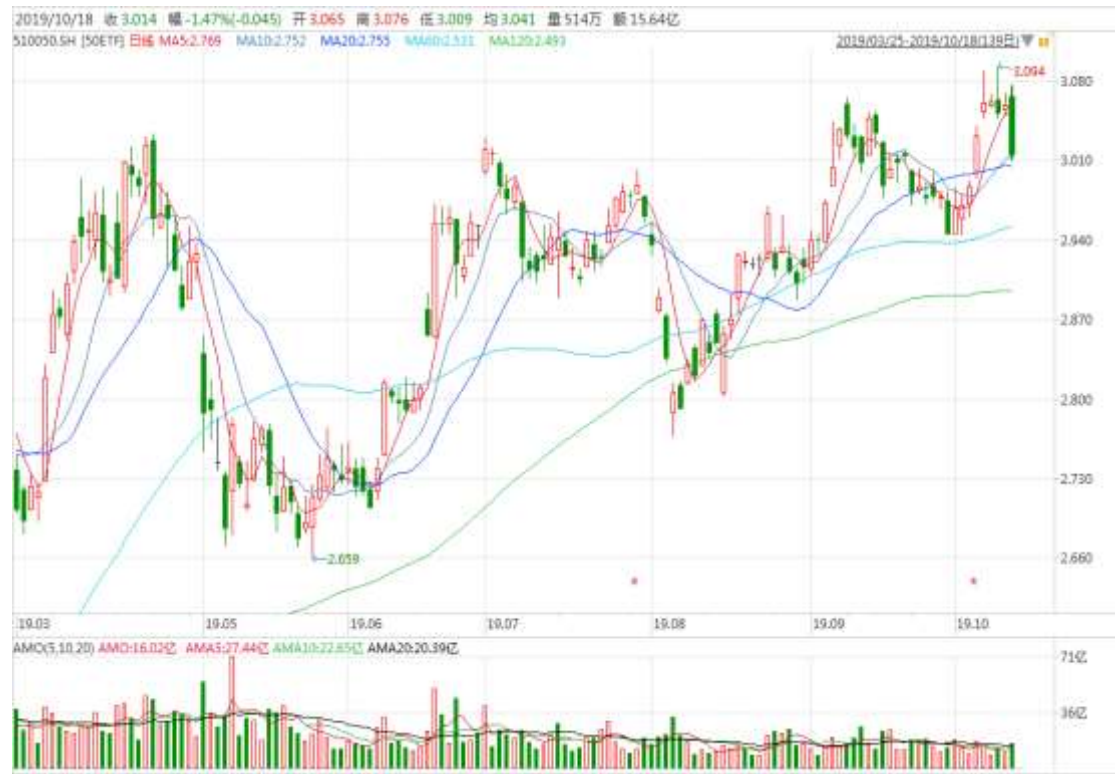
图表 2：上证 50ETF 日 K 线图（前复权）

以下的日线图显示 50ETF 冲高受阻，本周五大幅下挫，留意下方 3.000 整数关口。