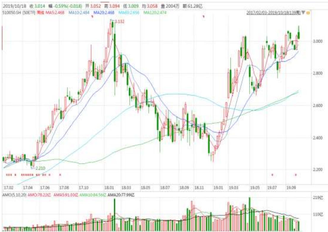
图表 3：上证 50ETF 周 K 线图