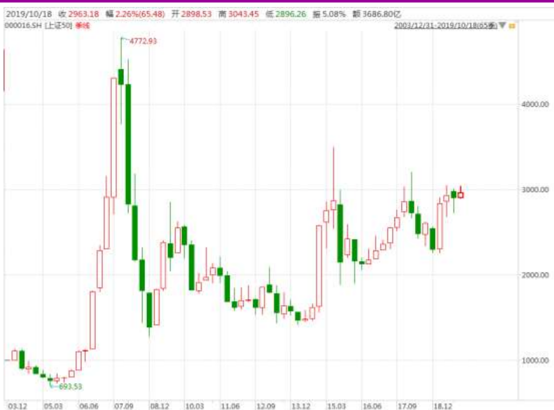
图表 5：上证 50 指数的季 K 线图

从下面的上证 50 指数的季线图来看，本季度震荡收高，可留意 3000 整数关口。