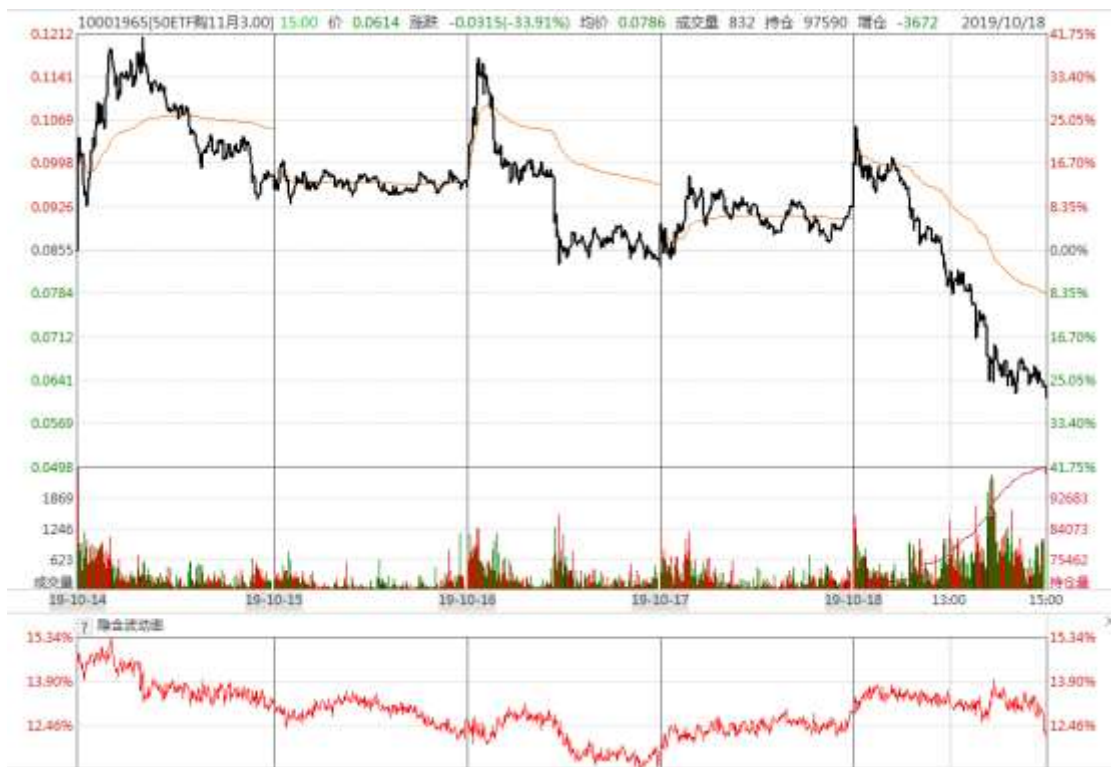
图表 11： 本周 11 月平值认购期权“50ETF 购 11 月 3000”日内走势图及隐含波动率变化图