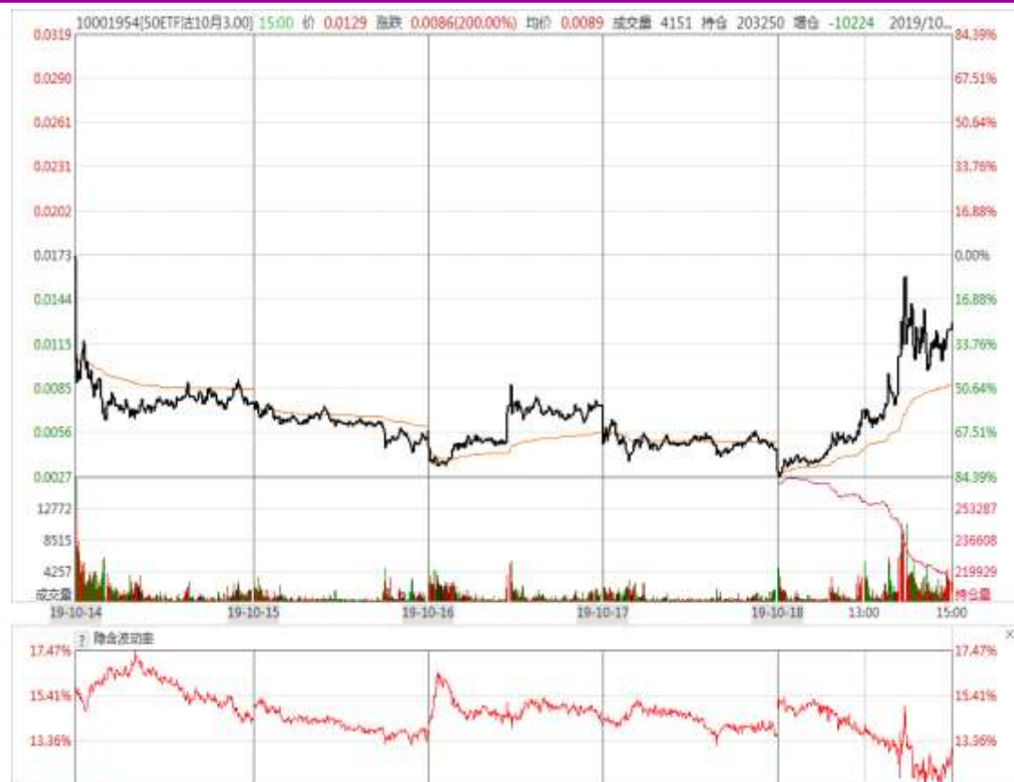
图 9：10 月平值认沽期权“50ETF 沽 10 月 3000”日 K 线图及隐含波动率变化图

本周 10 月平值认购期权标准合约“50ETF 购 10 月 3000”先扬后抑，隐含波动率震荡。