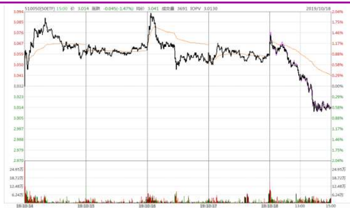
图表 1：上证 50ETF 本周的分时走势图

本周，周一、周三两度冲高，周三创出年内新高 3.094 后转而下行，周五跌幅加大。全周收于 3.014，较上周收盘价下跌 0.018，周跌幅 0.59%，