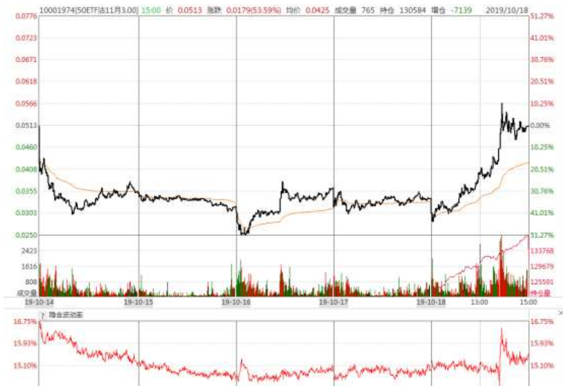
图表 12： 本周 11 月平值认沽期权“50ETF 沽 11 月 3000”日内走势图及隐含波动率变化图

本周 11 月平值认购期权标准合约“50ETF 购 11 月 3000”先涨后跌，隐含波动率震荡。