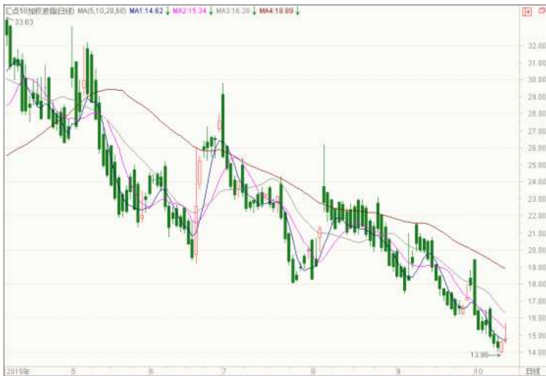
图表 13：来自汇点 50 加权波指变化图

11 月平值认购期权标准合约“50ETF 购 11 月 3000”隐含波动率为 12.29%；11 月平值认沽期权标准合约“50ETF 沽 11 月 3000”隐含波动率为 15.44%。 以下也提供来自汇点软件的汇点 50 加权波指变化图，可分析参考。