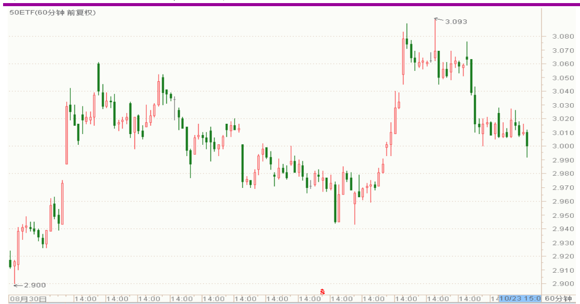
图表 1：上证 50ETF60 分钟 K 线图

从下面的 60 分钟图来看，50ETF 继续震荡回落，已经跌至 3.000 整数关口。