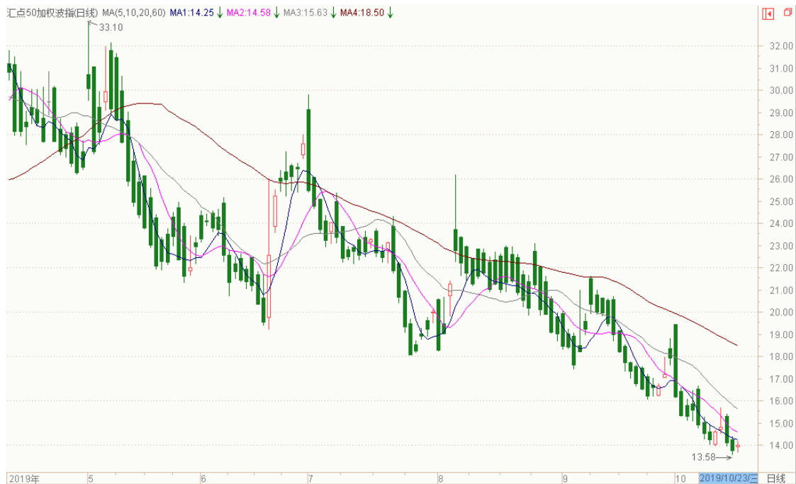
图表 11：来自汇点软件汇点 50 加权波指变化图（日线）