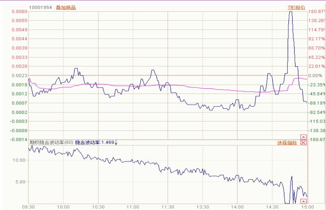
图表 10： 50ETF 与 11 月平值认沽期权“50ETF 沽 11 月 3000”日内走势图及隐含波动率走势图

11 月平值认购期权标准合约“50ETF 购 11 月 3000”震荡下跌，隐含波动率震荡。