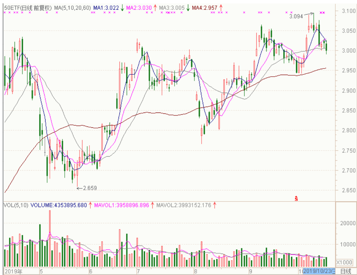
图表 2：上证 50ETF 日 K 线图（前复权）

从下面的日 K 线图来看，50ETF 近期持续回落，今日收盘价低于 20 日均线。