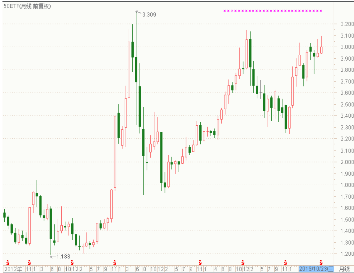
图表 4：上证 50ETF 月 K 线图

从以下的月 K 线图看，50ETF 10 月份收于带上影的阳线，留意消息面变化的可能影响。