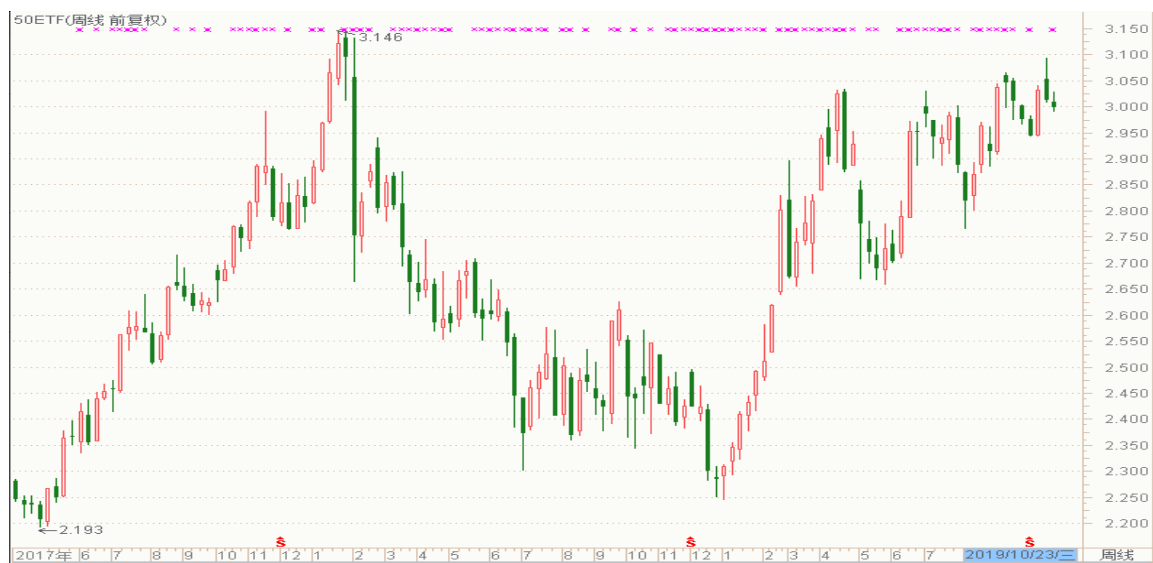
图表 3：上证 50ETF 周 K 线图

从以下的周 K 线图看，50ETF 本周震荡下行，继续关注 3.000 整数关口附近的变化。