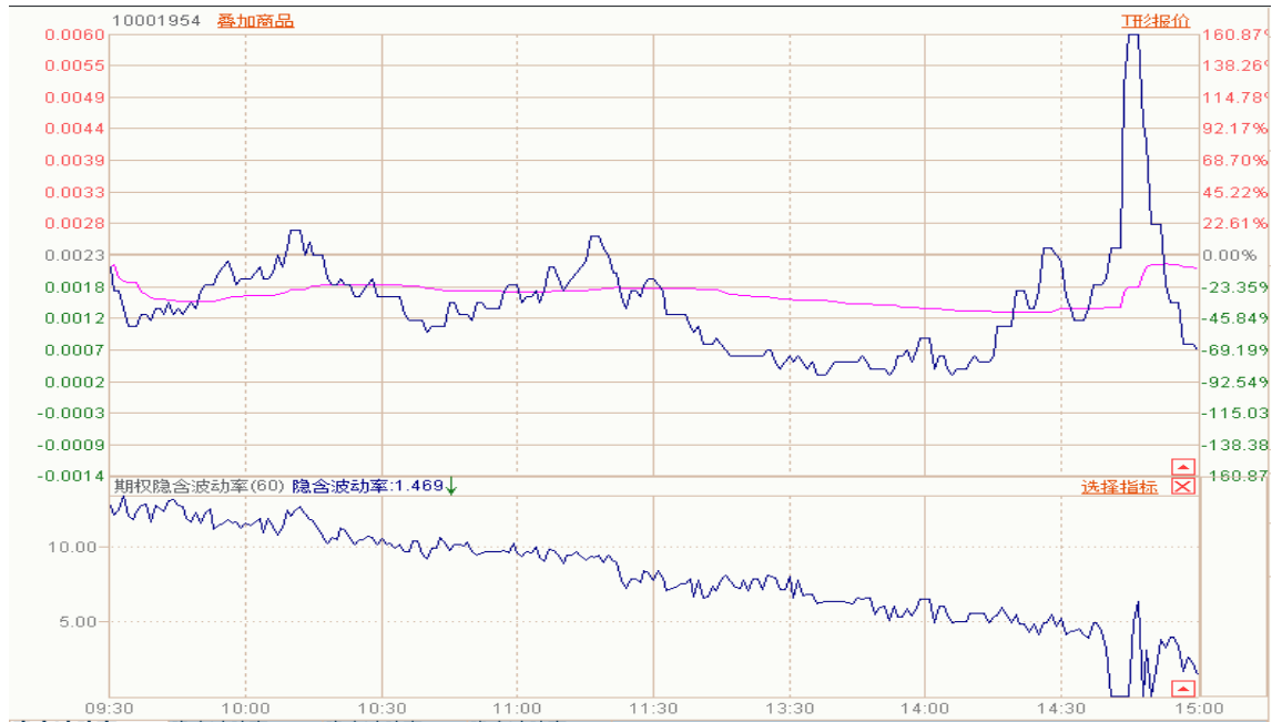
图表 7：50ETF 与 10 月平值认沽期权“50ETF 沽 10 月 3000”日内走势图及隐含波动率走势图