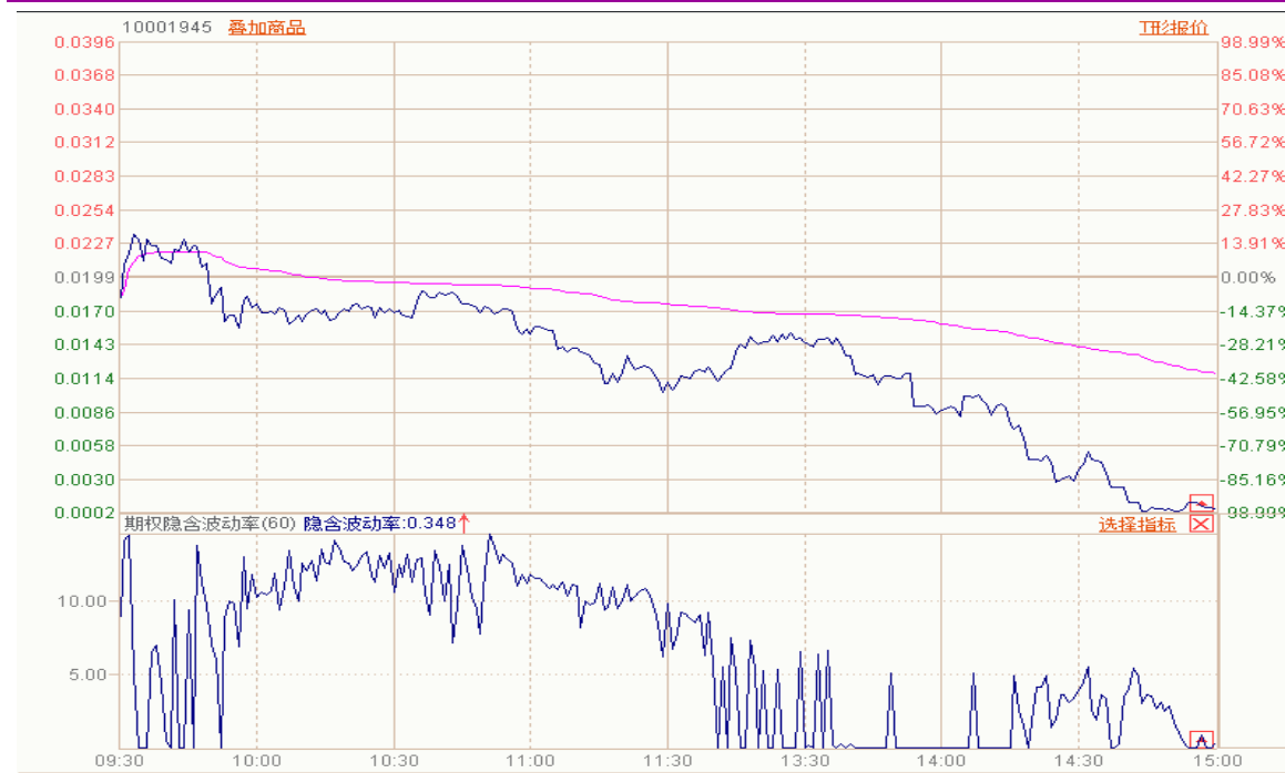
图表 6：10 月平值认购期权“50ETF 购 10 月 3000”日内走势图及隐含波动率变化图