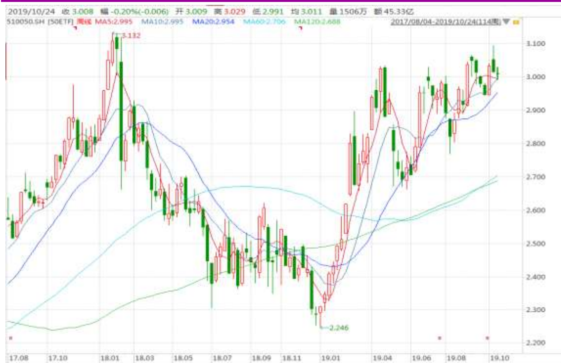
图表 3：上证 50ETF 周 K 线图

从以下的周 K 线图看，50ETF 本周震荡下行，继续关注 3.000 整数关口附近的变化。