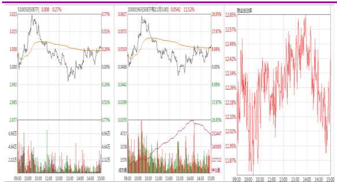
图表 6：11 月平值认购期权“50ETF 购 11 月 3000”日内走势图及隐含波动率变化图