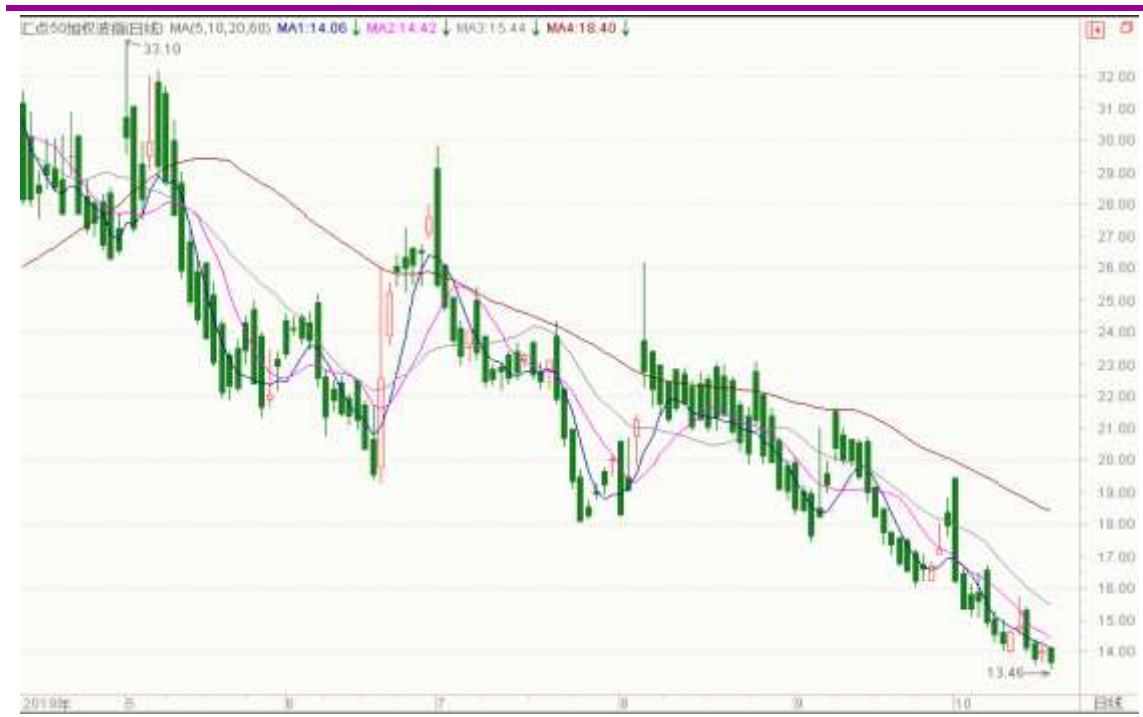
图表 8：来自 wind 金融终端汇点 50 加权波指变化图（日线）

以下也提供来自 wind 金融终端的汇点 50 加权波指变化图（日线），可分析参考。