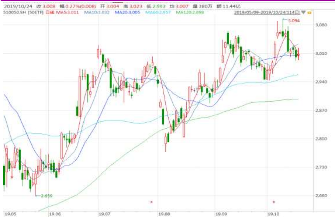
图表 2：上证 50ETF 日 K 线图（前复权）

从下面的日 K 线图来看，50ETF 仍在 20 日均线附近波动，留意消息面的新变化。