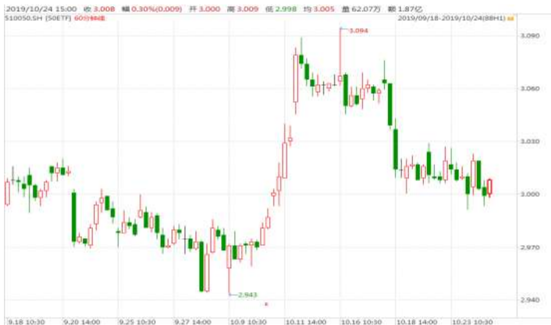
图表 1：上证 50ETF60 分钟 K 线图