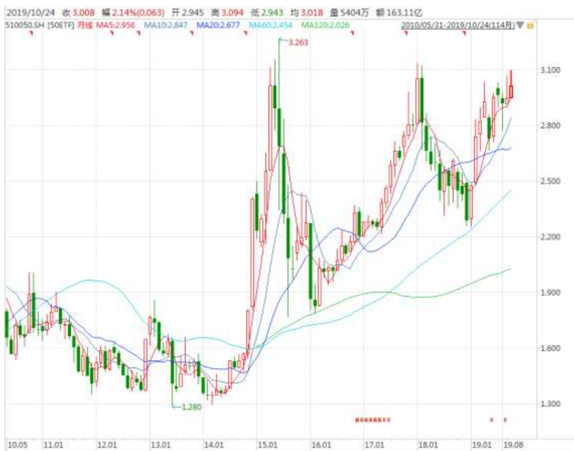
图表 4：上证 50ETF 月 K 线图

从以下的月 K 线图看，50ETF 10 月份收于带上影的阳线，留意消息面变化的可能影响。