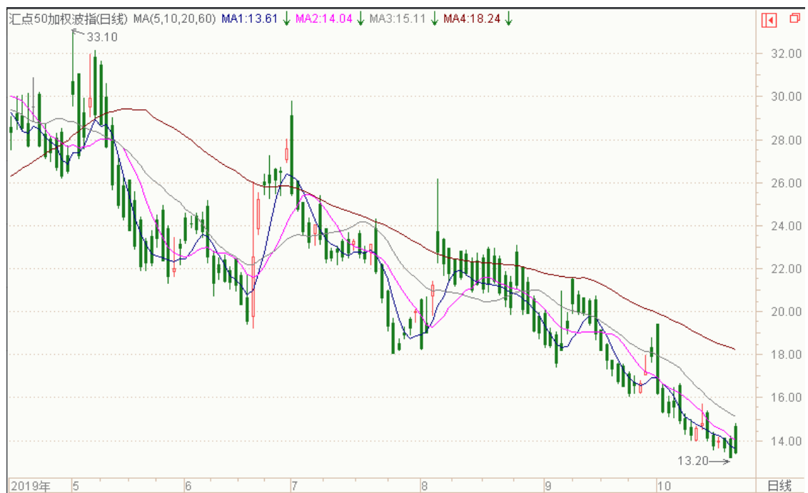
图表 8：来自 wind 金融终端汇点 50 加权波指变化图（日线）

以下也提供来自 wind 金融终端的汇点 50 加权波指变化图（日线），可分析参考。