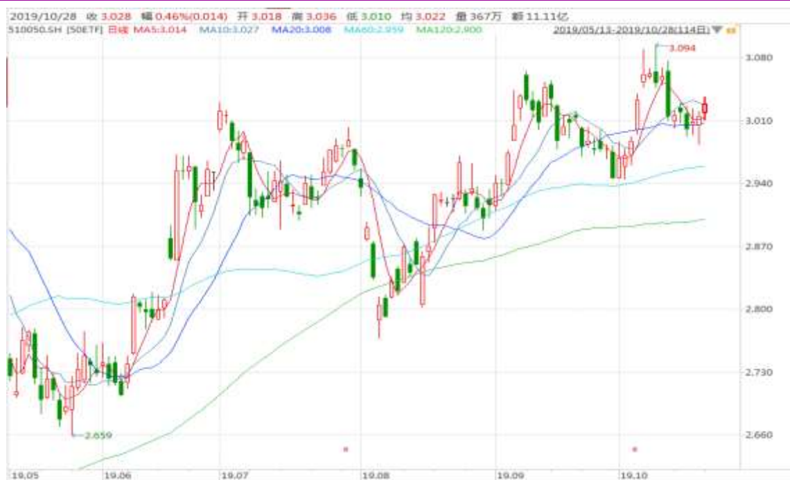
图表 2：上证 50ETF 日 K 线图（前复权）

从下面的日 K 线图来看，50ETF 在 20 日均线附近止跌反弹，留意消息面的新变化。