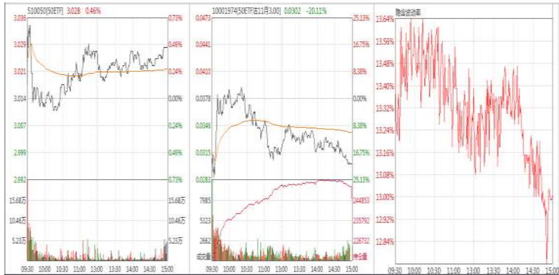
图表 7：50ETF 与 11 月平值认沽期权“50ETF 沽 11 月 3000”日内走势图及隐含波动率走势图