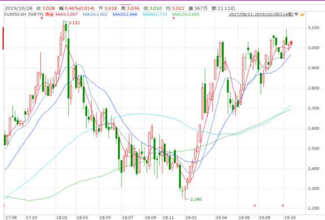
图表 3：上证 50ETF 周 K 线图

从以下的周 K 线图看，50ETF 本周初震荡上行，继续关注 3.000 整数关口支撑有效性。