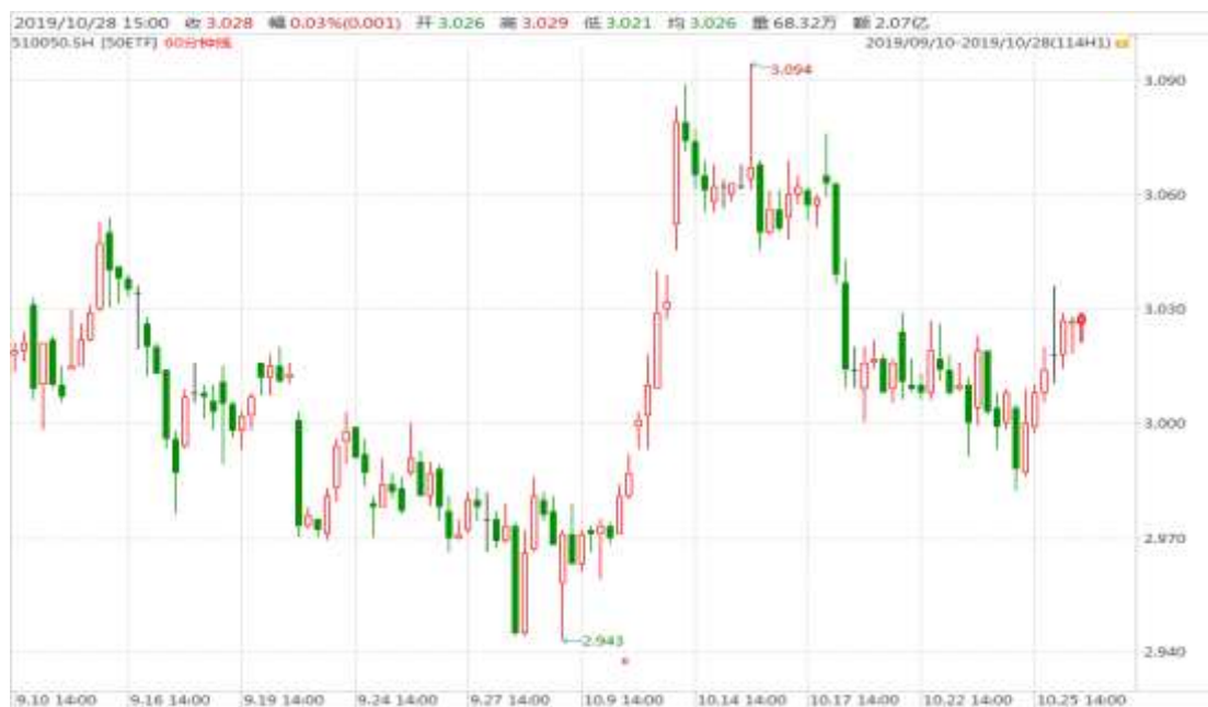
图表 1: 上证 50ETF60 分钟 K 线图

从下面的 60 分钟图来看, 50ETF 跌至 3.000 整数关口下方获得支撑, 震荡回升。