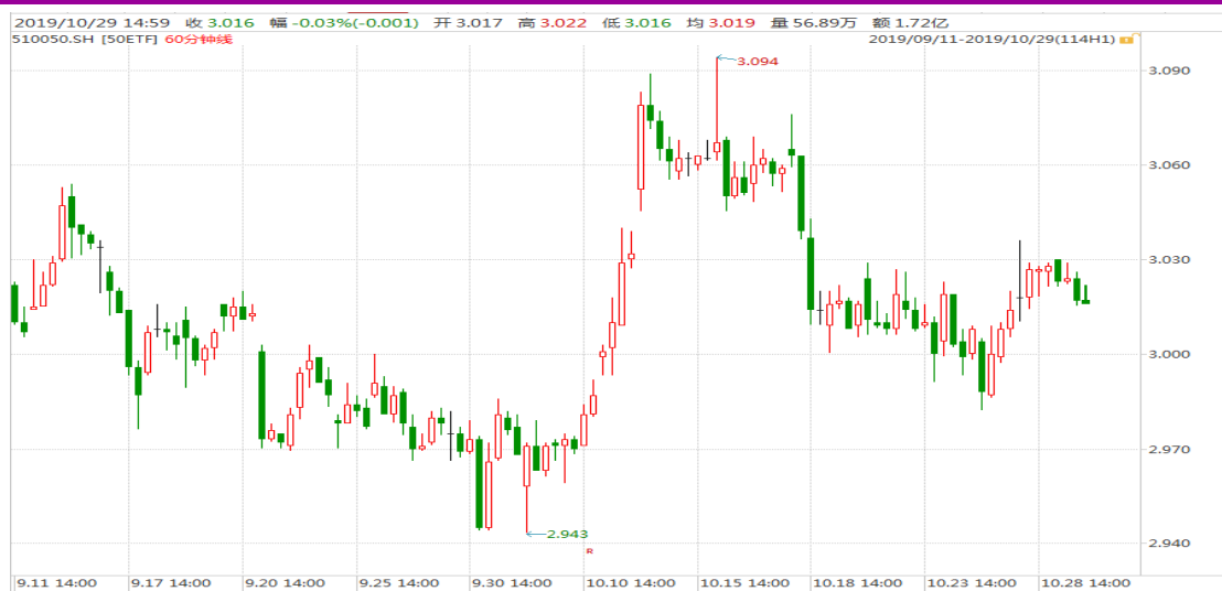
图表 1: 上证 50ETF 60 分钟 K 线图

从下面的 60 分钟图来看, 50ETF 总体仍呈现震荡格局, 留意可能的消息刺激。