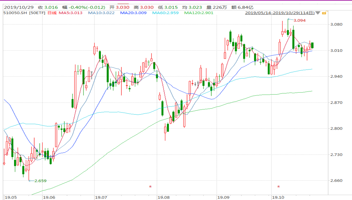
图表 2: 上证 50ETF 日 K 线图 (前复权)

从下面的日 K 线图来看，50ETF 短期日均线交织，继续留意 20 日均线附近的变化。