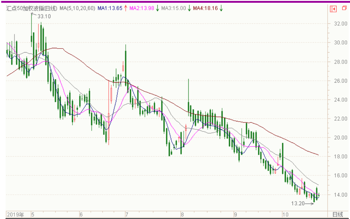
图表 8：来自 wind 金融终端汇点 50 加权波指变化图（日线）

以下也提供来自 wind 金融终端的汇点 50 加权波指变化图（日线），可分析参考。