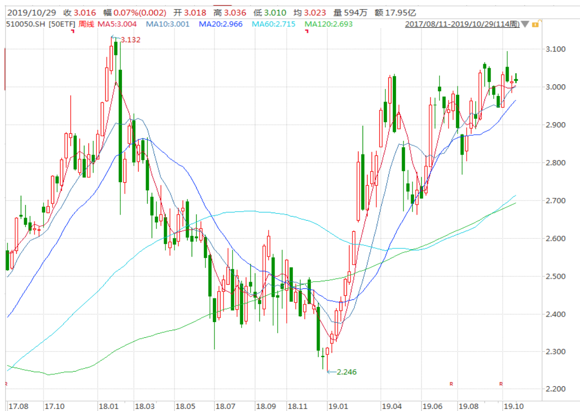
图表 3: 上证 50ETF 周 K 线图

从以下的周 K 线图看，50ETF 本周初冲高调，继续关注 3.000 整数关口支撑有效性。