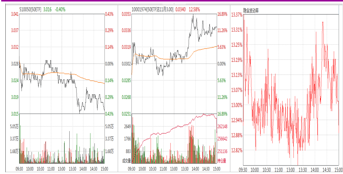
图表 7：50ETF 与 11 月平值认沽期权“50ETF 沽 11 月 3000”日内走势图及隐含波动率走势图