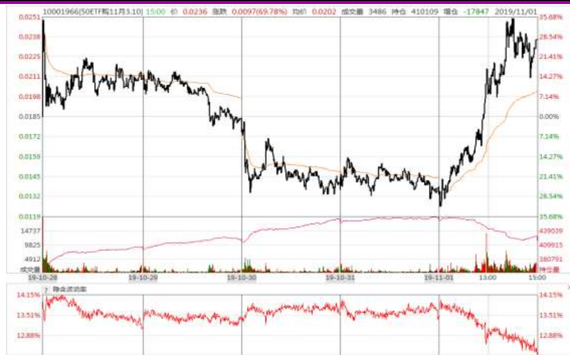
图 8：本周 11 月平值认购期权“50ETF 购 11 月 3100”日内走势图及隐含波动率变化图