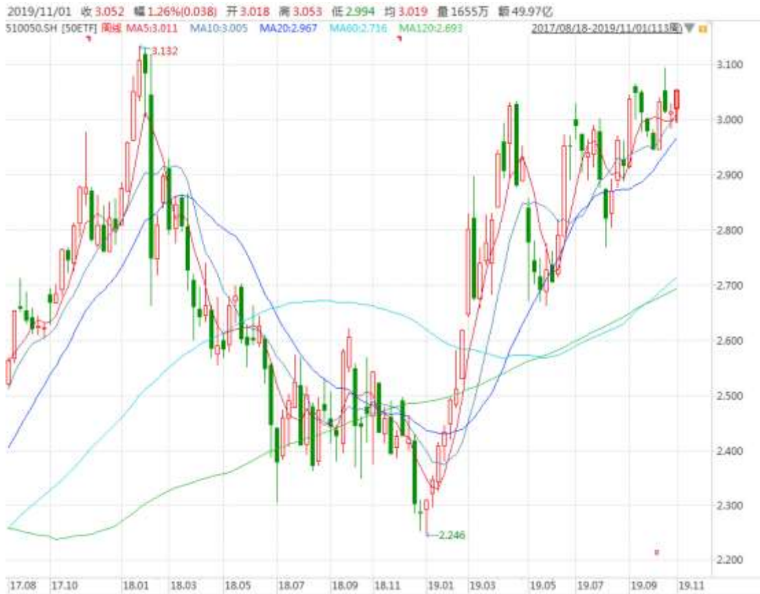
图表 3: 上证 50ETF 周 K 线图