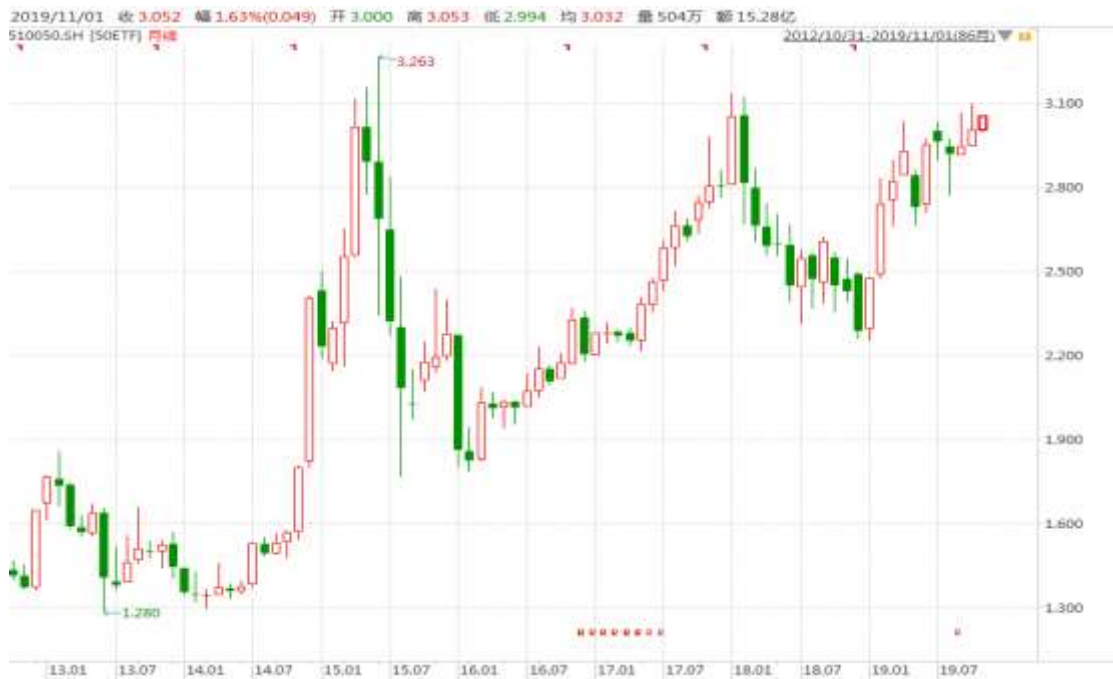
图表 4：上证 50ETF 月 K 线图