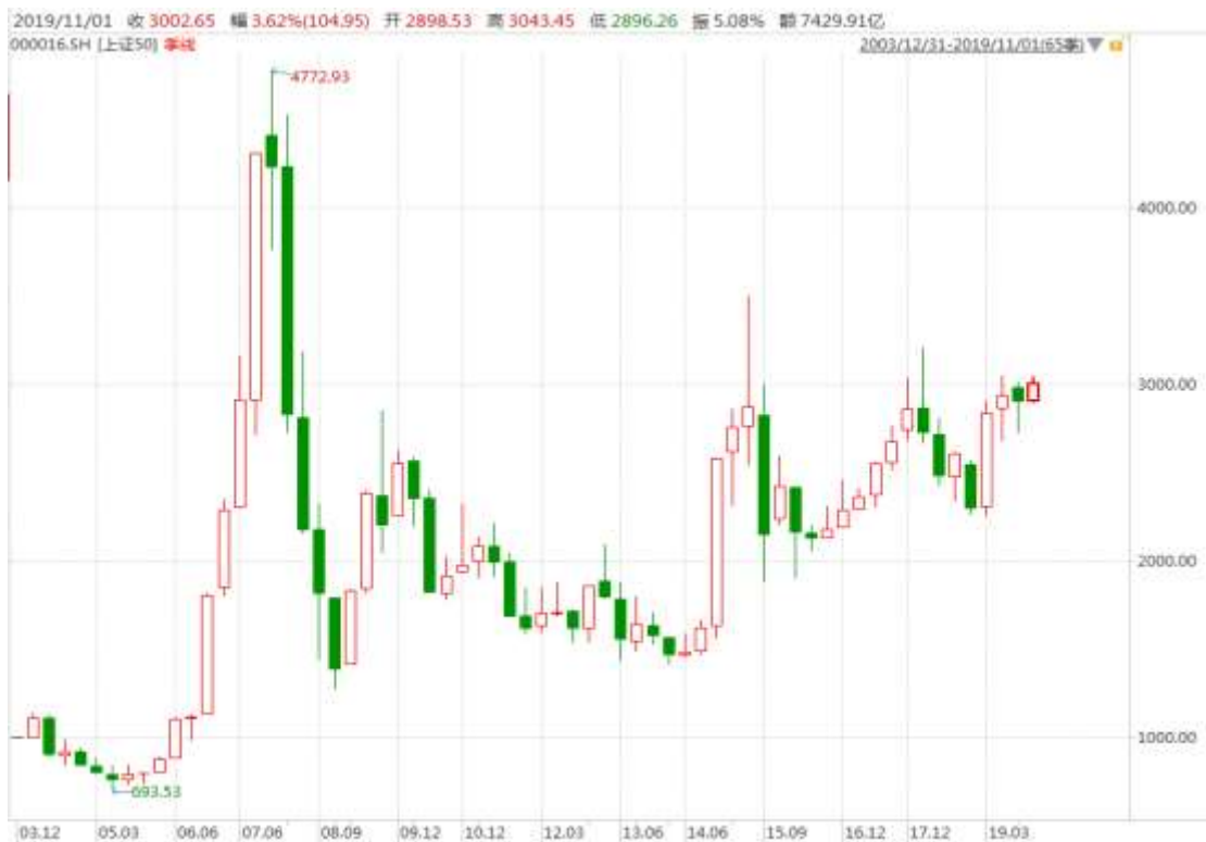
图表 5：上证 50 指数的季 K 线图