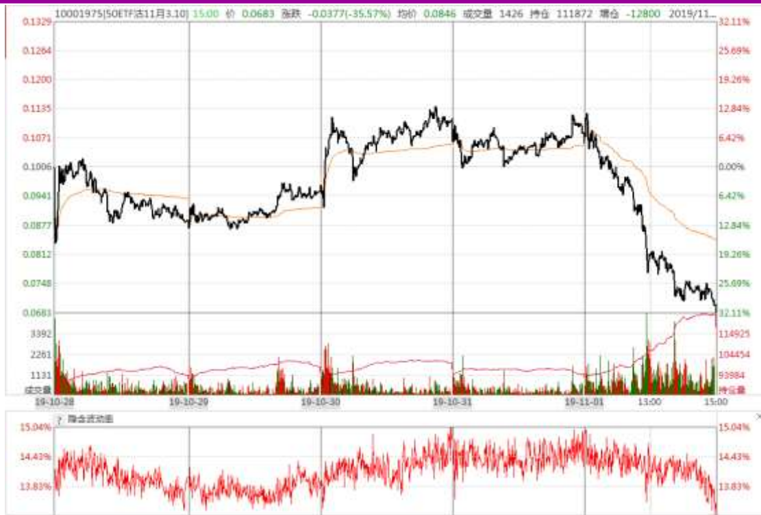
图表 9：本周 11 月平值认沽期权“50ETF 沽 11 月 3100” 日内走势图及隐含波动率变化图