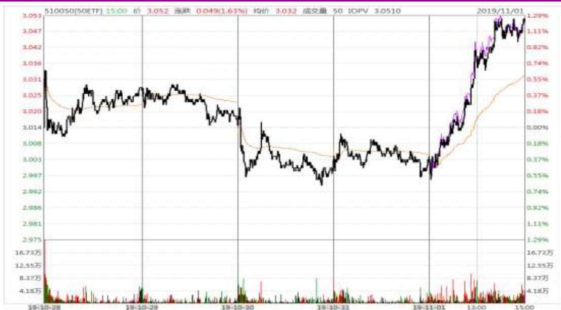
图表 1：上证 50ETF 本周的分时走势图

本周，周一、周二小幅震荡，周三、周四震荡偏弱，周五先跌后涨，全周收于 3.052，较上周收盘价上涨 0.038，涨幅为 1.26%。