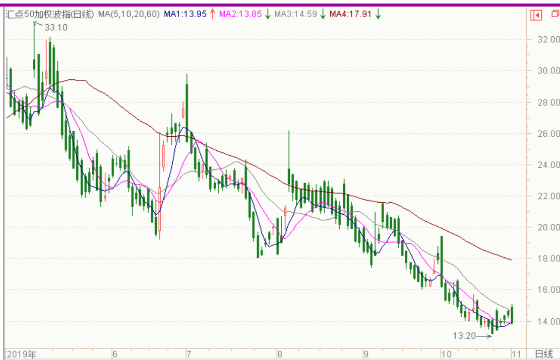
图表 10：来自汇点 50 加权波指变化图

本周 11 月平值认沽期权标准合约“50ETF 沽 11 月 3100”震荡下跌，隐含波动率震荡。11 月平值认购期权标准合约“50ETF 购 11 月 3100”隐含波动率为 12.37%；11 月平值认沽期权标准合约“50ETF 沽 11 月 3100”隐含波动率为 13.25%。以下也提供来自汇点软件的汇点 50 加权波指变化图，可分析参考。