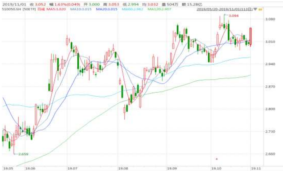
图表 2: 上证 50ETF 日 K 线图 (前复权)