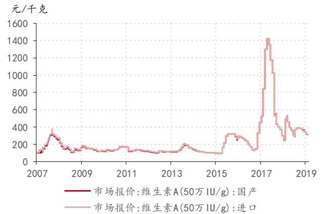
图表 2. 国内维生素 A 价格