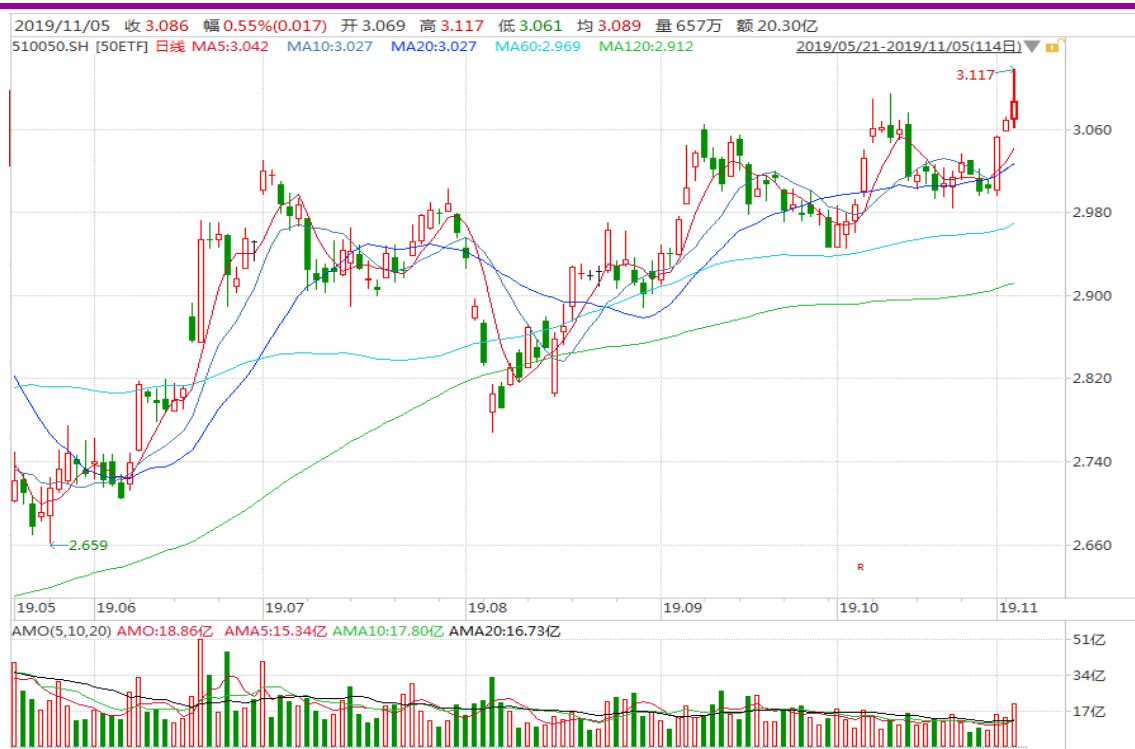
图表 2: 上证 50ETF 日 K 线图 (前复权)

从下面的日 K 线图来看，50ETF 连续收出三阳，创出年内新高，上行动力增强。