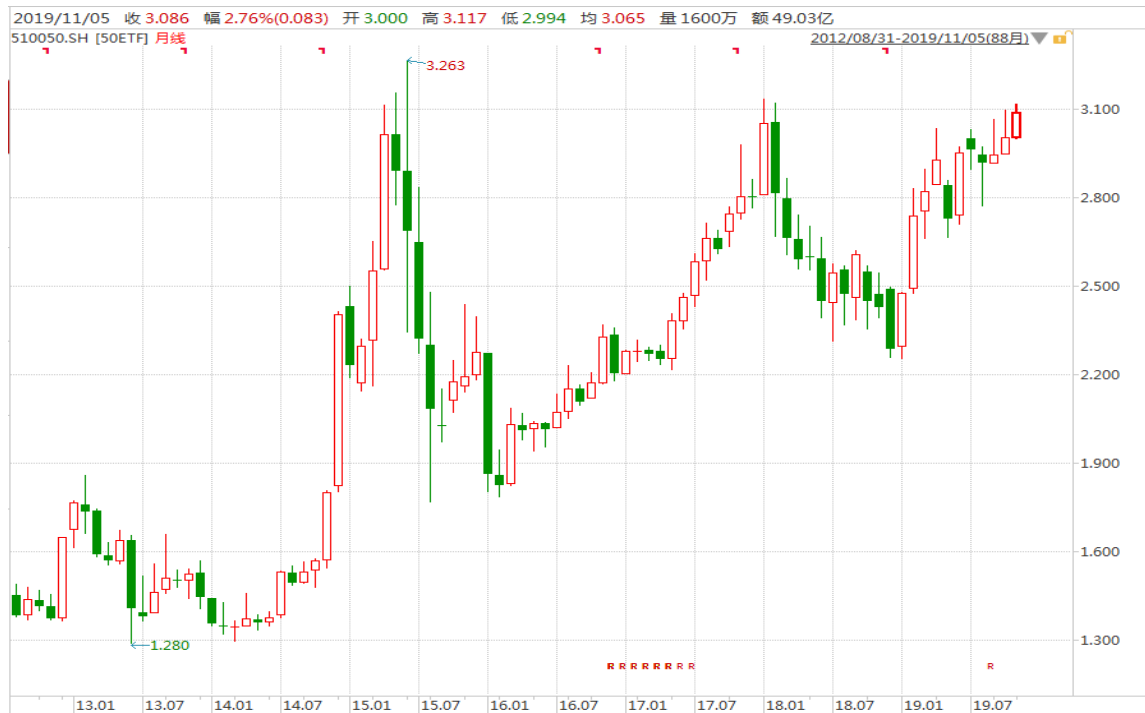
图表 4：上证 50ETF 月 K 线图