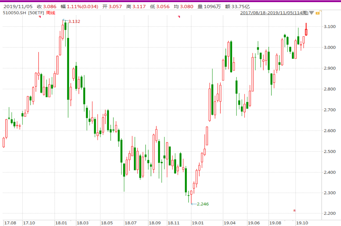
图表 3: 上证 50ETF 周 K 线图