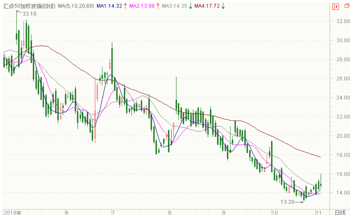
图表 8：来自 wind 金融终端汇点 50 加权波指变化图（日线）

以下也提供来自 wind 金融终端的汇点 50 加权波指变化图（日线），可分析参考。