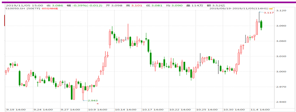
图表 1: 上证 50ETF60 分钟 K 线图

从下面的 60 分钟图来看, 50ETF 再度震荡走高, 盘中创出年内新高 3.117。