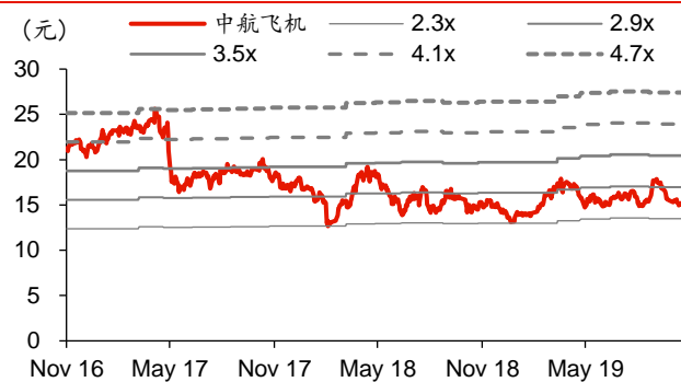
图表2: 中航飞机历史 PB-Bands