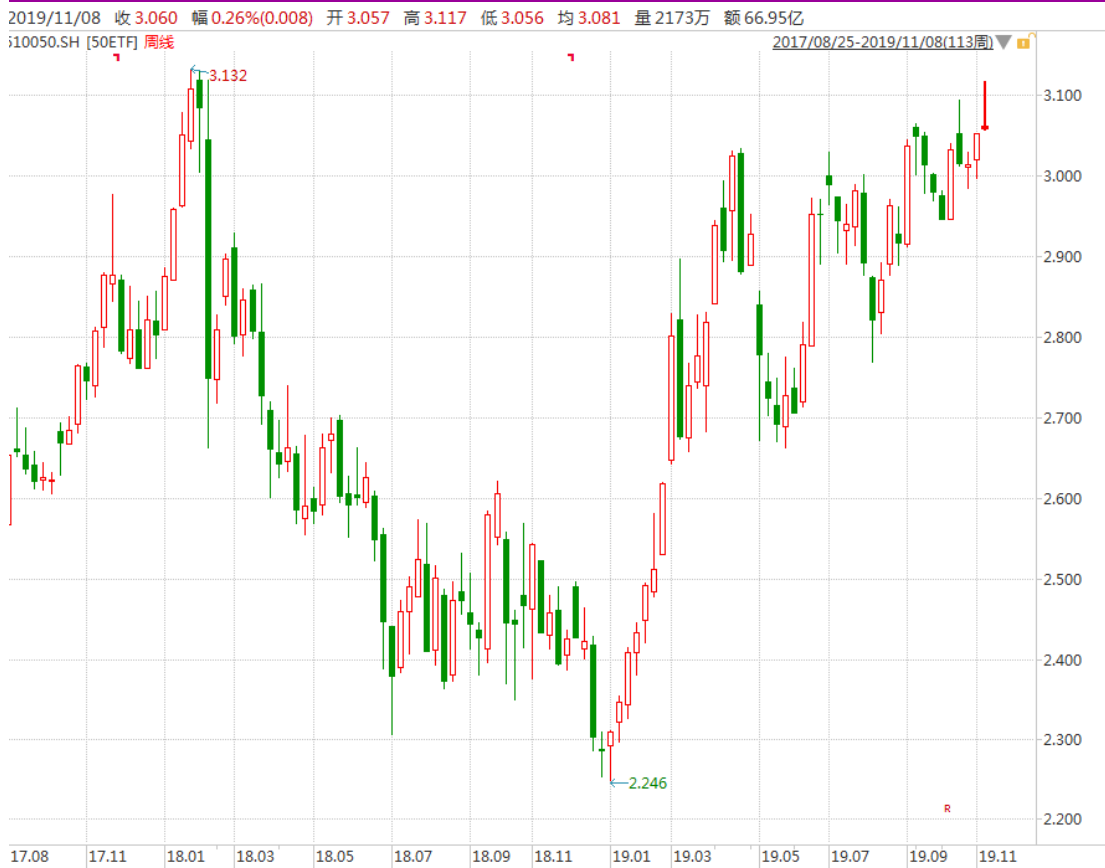
图表 3：上证 50ETF 周 K 线图