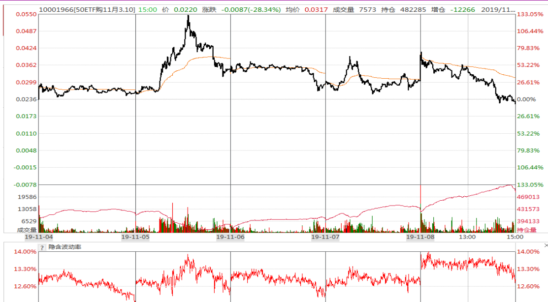
图表 8：本周 11 月平值认购期权“50ETF 购 11 月 3100”日内走势图及隐含波动率变化图