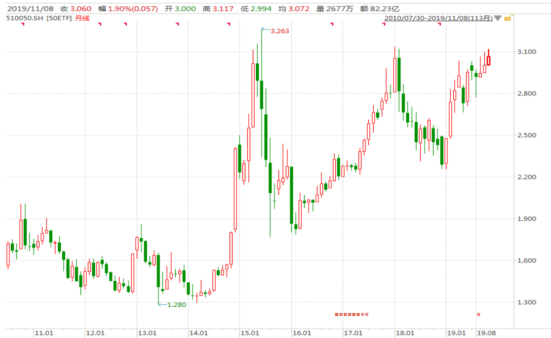
图表 4：上证 50ETF 月 K 线图

以下月 K 线图显示 11 月初 50ETF 再度上行，创出 20 个月来新高。