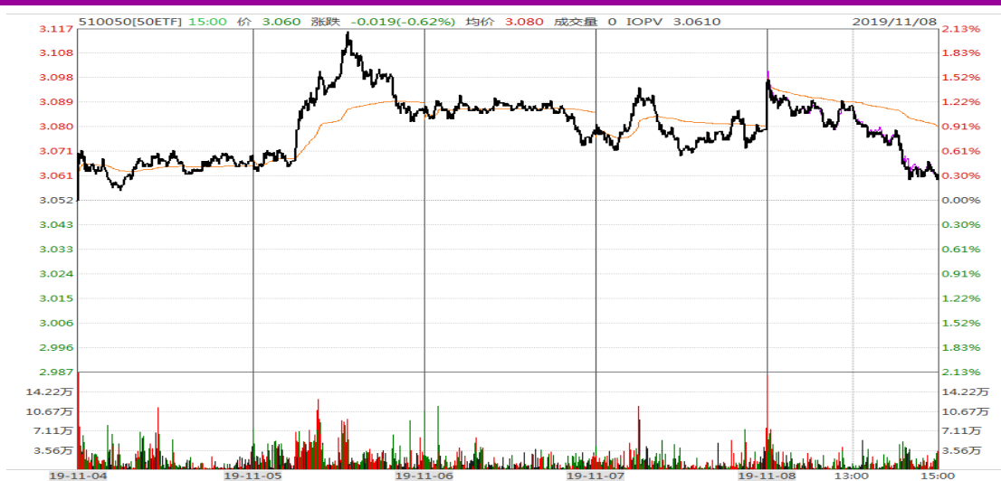
图表 1：上证 50ETF 本周的分时走势图

本周，周一跳空上行、周二创出 3.117 的年内新高后回调，周三、周四震荡，周五高开低收，全周收于 3.060，较上周收盘价上涨 0.008，涨幅为 0.26%。