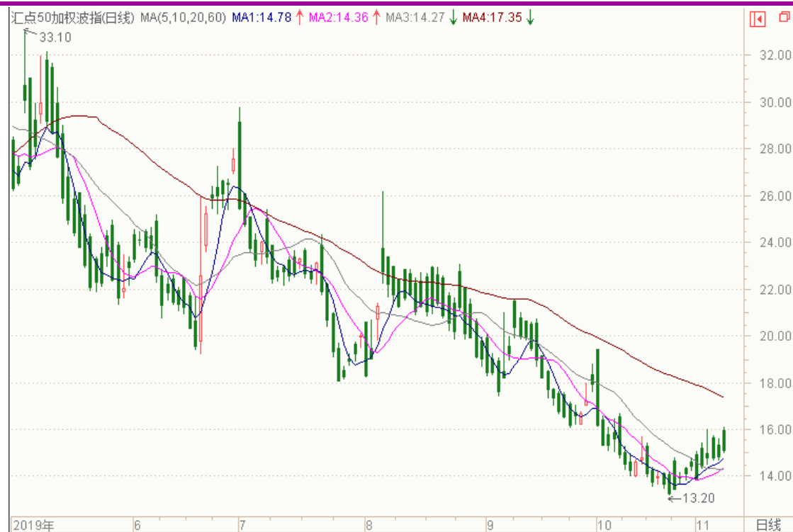
图表 10：来自汇点 50 加权波指变化图

本周 11 月平值认沽期权标准合约“50ETF 沽 11 月 3100”震荡收低，隐含波动率震荡。11 月平值认购期权标准合约“50ETF 购 11 月 3100”隐含波动率为 12.88%；11 月平值认沽期权标准合约“50ETF 沽 11 月 3100”隐含波动率为 13.11%。以下也提供来自汇点软件的汇点 50 加权波指变化图，可分析参考。