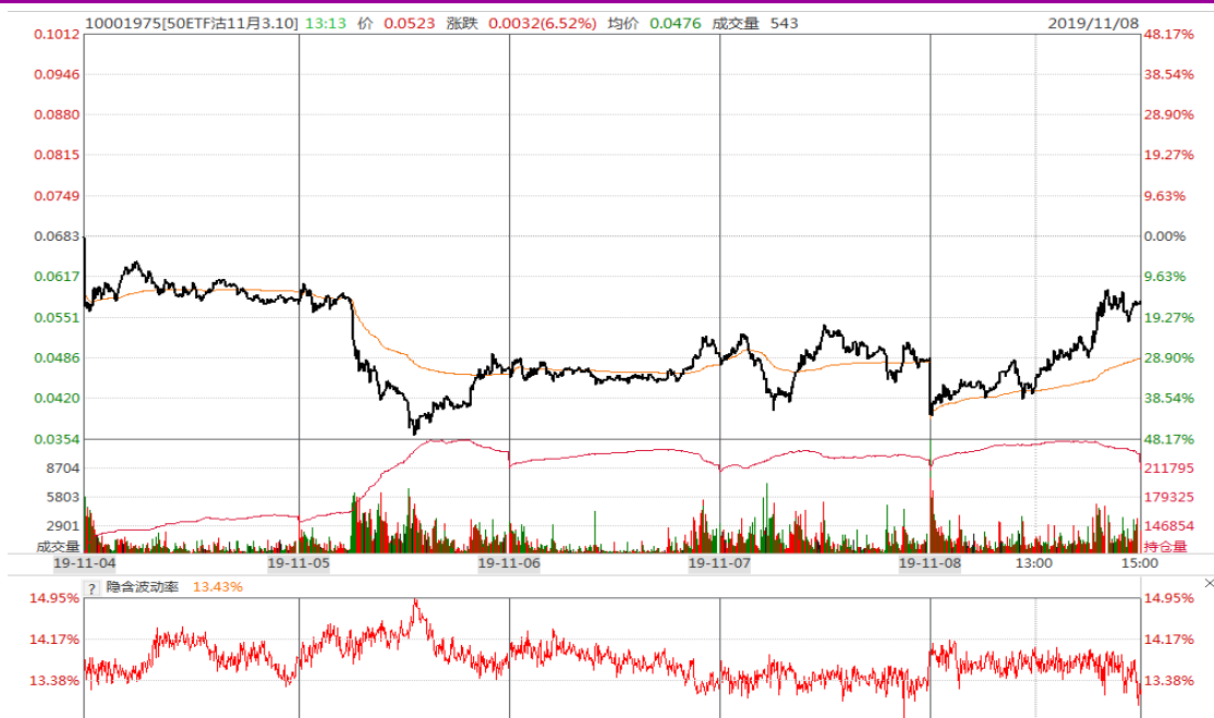
图表 9：本周 11 月平值认沽期权“50ETF 沽 11 月 3100” 日内走势图及隐含波动率变化图