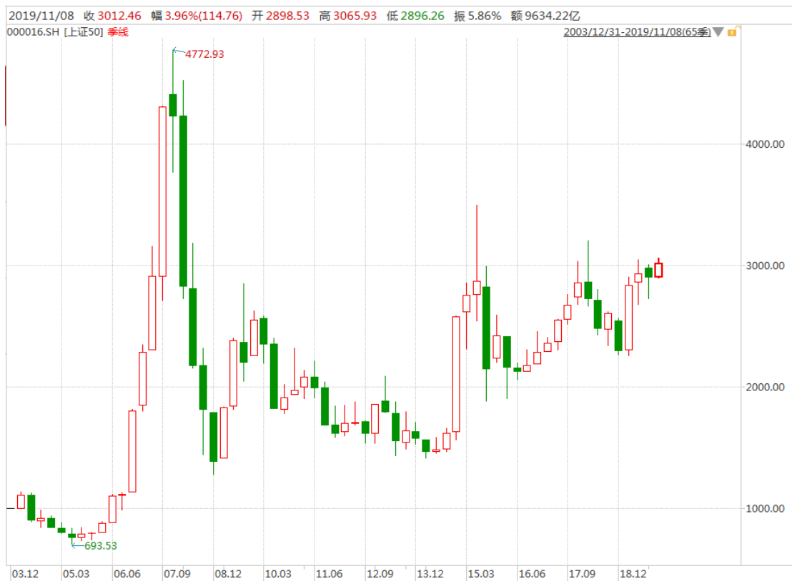
图表 5：上证 50 指数的季 K 线图