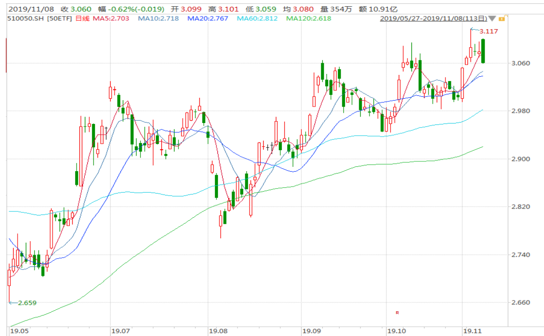
图表 2：上证 50ETF 日 K 线图（前复权）