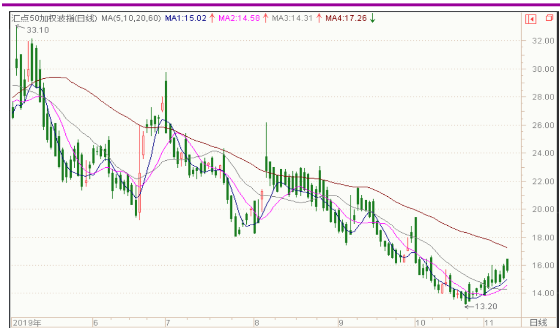
图表 8：来自 wind 金融终端汇点 50 加权波指变化图（日线）

以下也提供来自 wind 金融终端的汇点 50 加权波指变化图（日线），可分析参考。