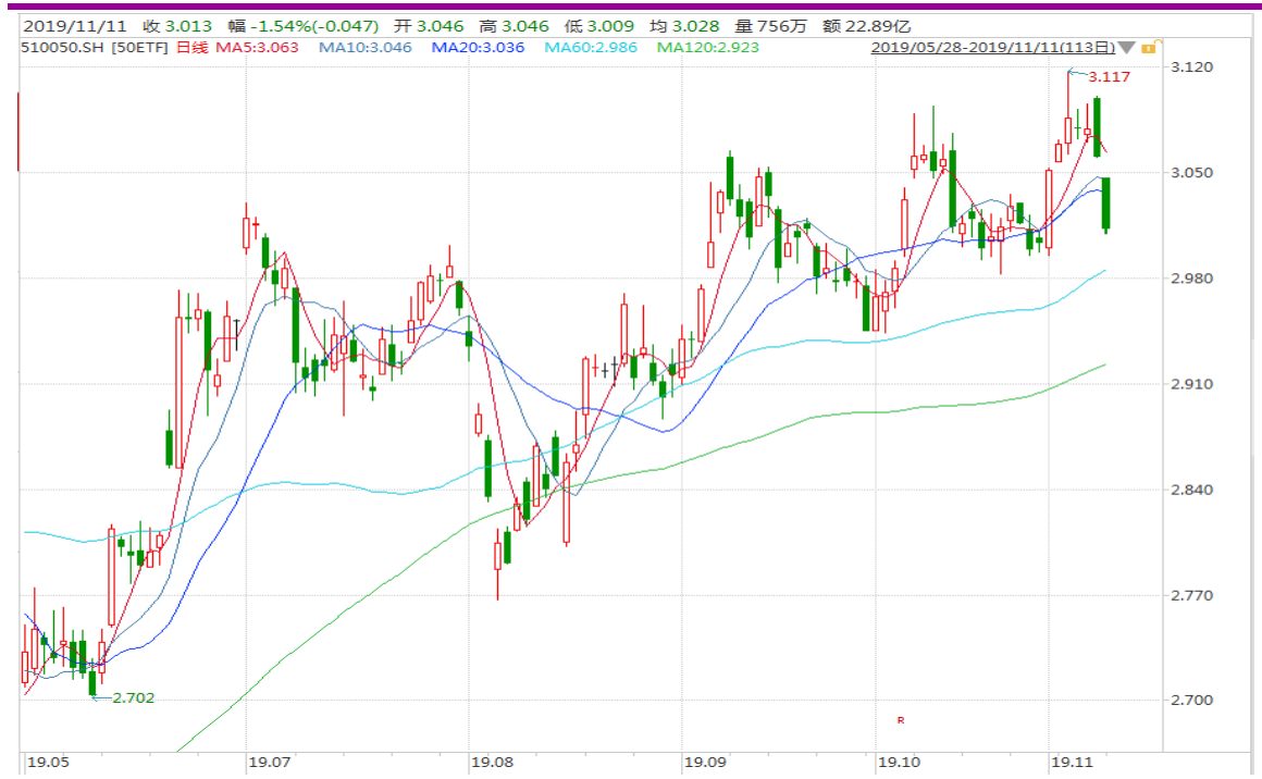
图表 2：上证 50ETF 日 K 线图（前复权）

从下面的日 K 线图来看，50ETF 跳空下行，跌破多条短期均线，留意后续动向。