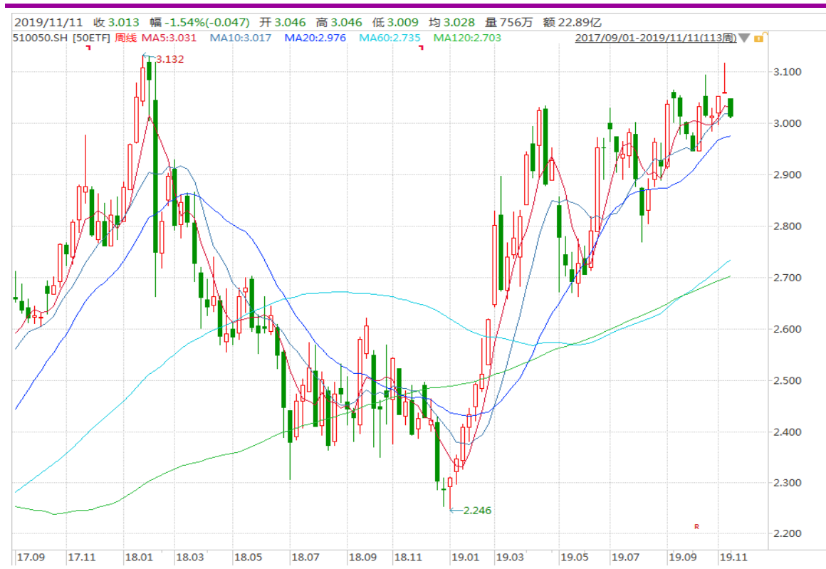
图表 3：上证 50ETF 周 K 线图

从以下的周 K 线图看，50ETF 上周收出长上影，本周初跳空下跌，当心市场情绪变化。