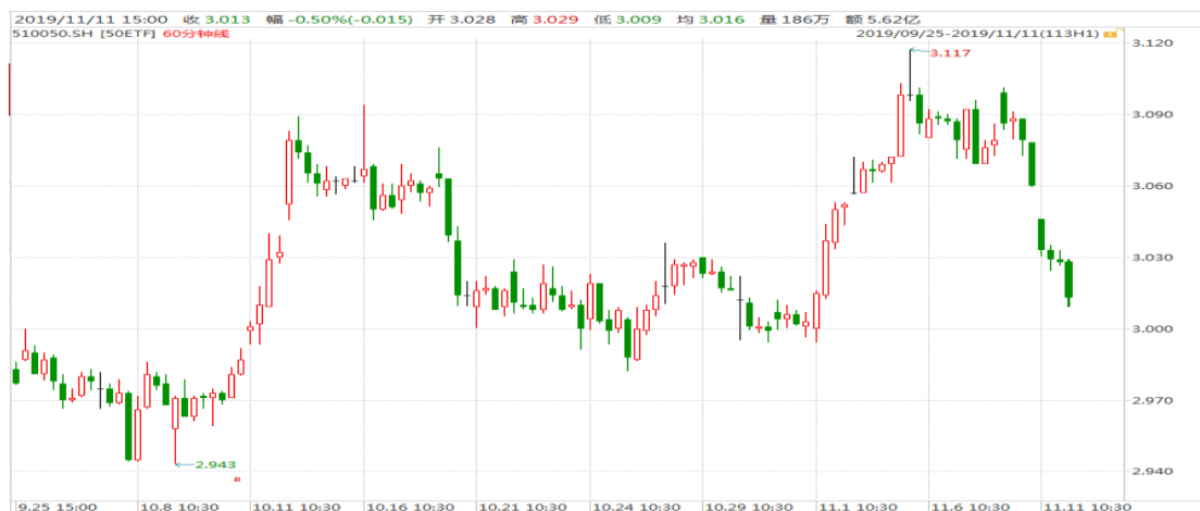
图表 1：上证 50ETF60 分钟 K 线图