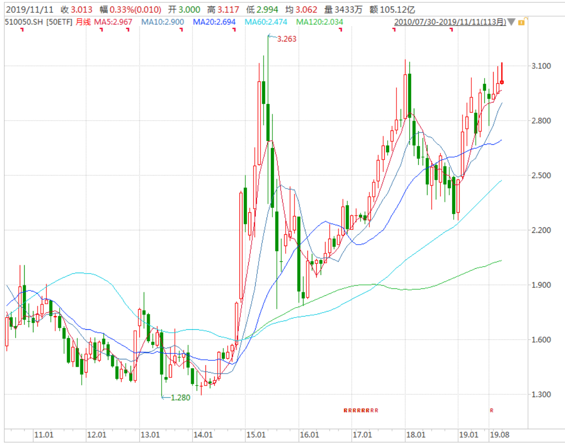
图表 4：上证 50ETF 月 K 线图

从以下的月 K 线图看，50ETF 11 月初创出年内新高后大幅回落，上档压力仍存。