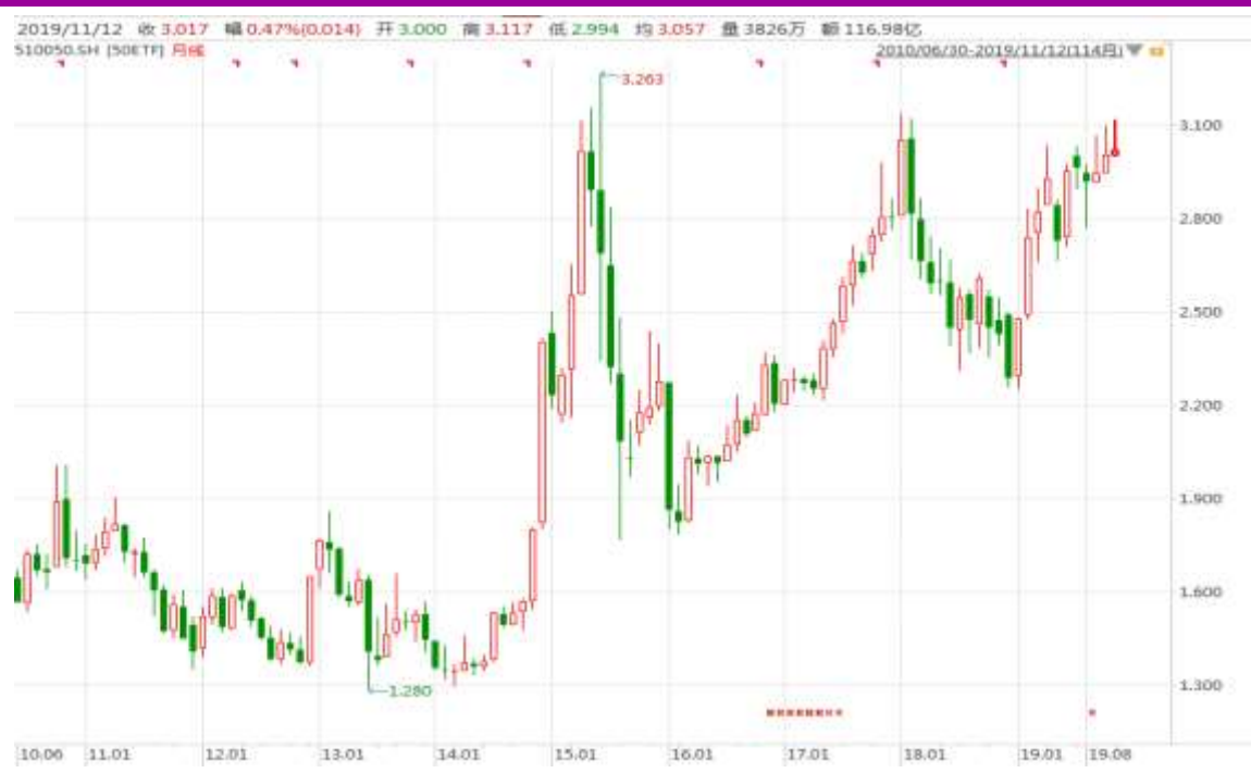
图表 4：上证 50ETF 月 K 线图

从以下的月 K 线图看，50ETF 11 月初冲高回调，继续关注国内外消息面的可能影响。