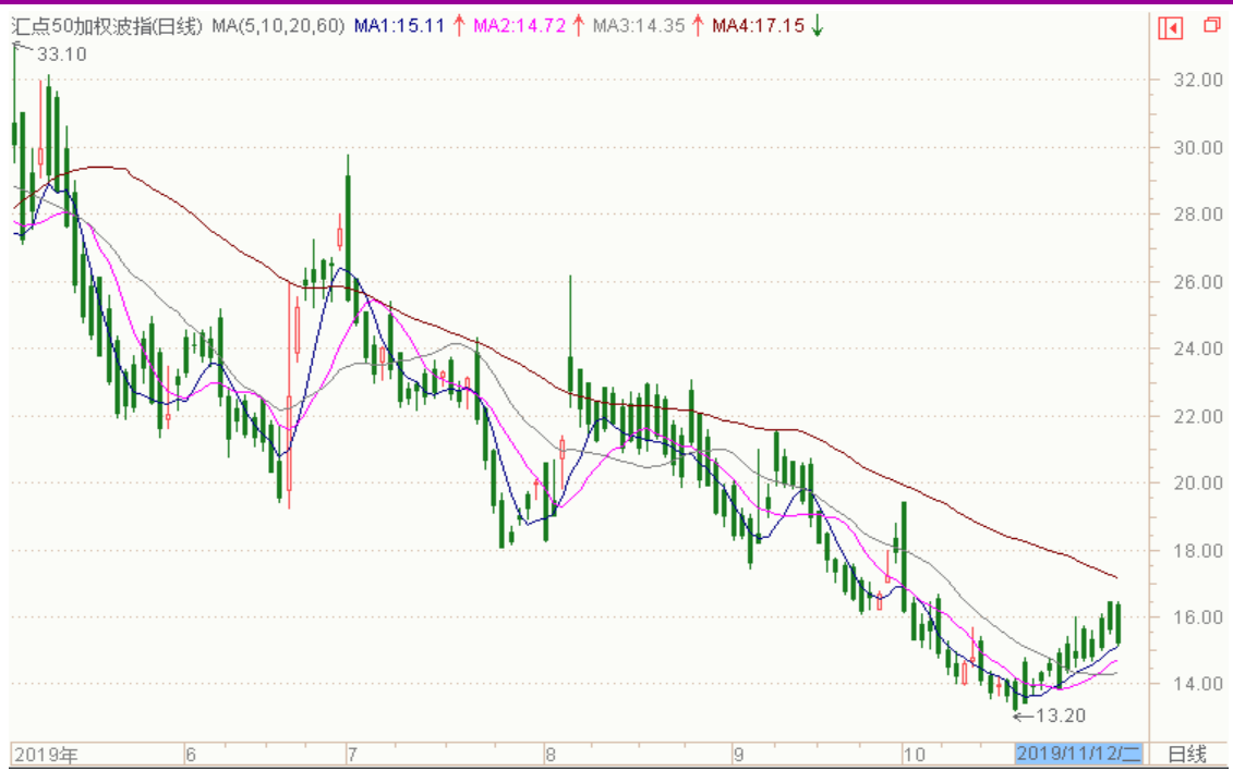
图表 8：来自 wind 金融终端汇点 50 加权波指变化图（日线）

以下也提供来自 wind 金融终端的汇点 50 加权波指变化图（日线），可分析参考。