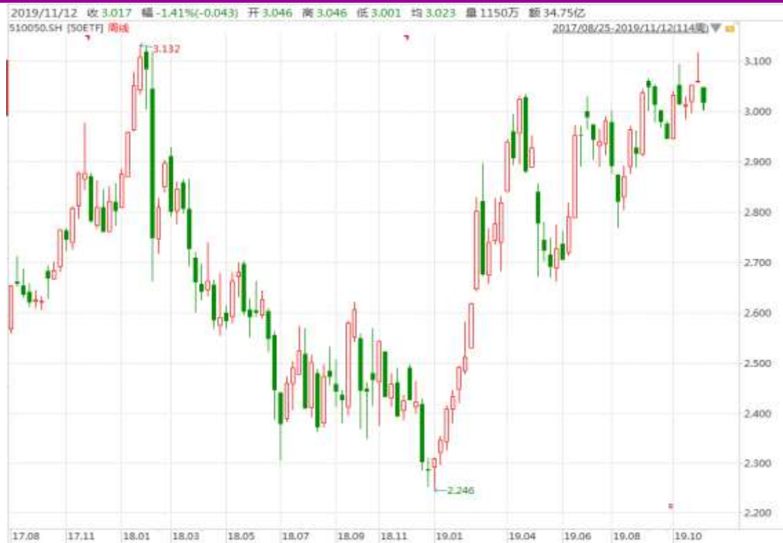
图表 3：上证 50ETF 周 K 线图

从以下的周 K 线图看，50ETF 本周初跳空下跌，重回此前 3.000 整数关口一线。