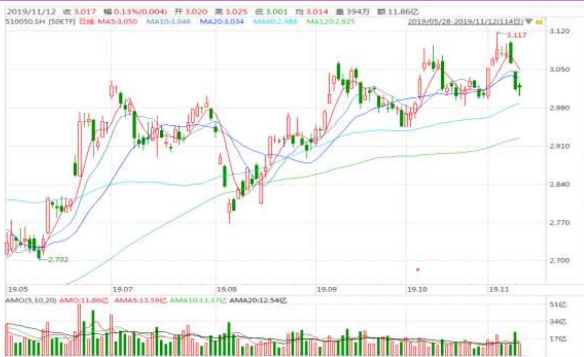
图表 2：上证 50ETF 日 K 线图（前复权）

从下面的日 K 线图来看，50ETF 连续回调，短期均线回落，留意 20 日均线参考价值。