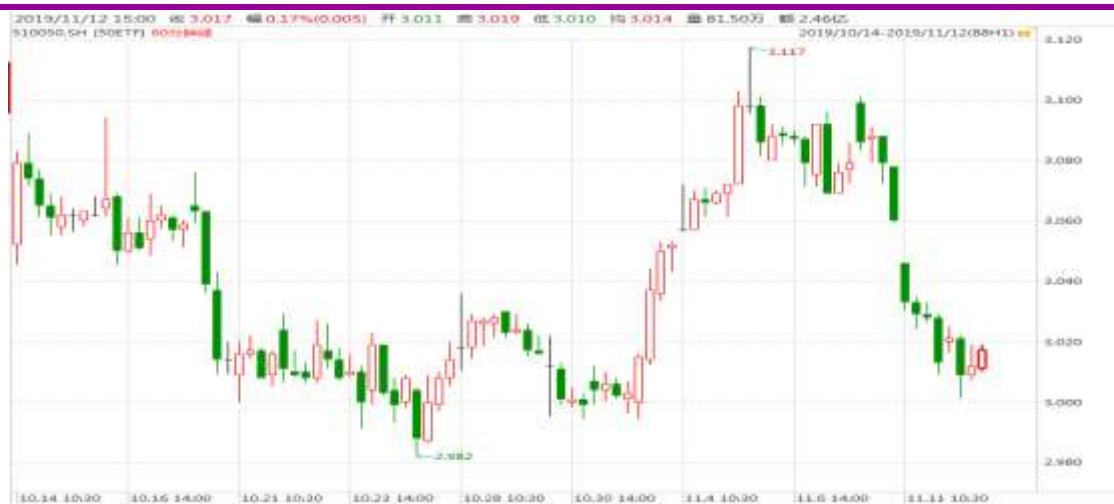
图表 1: 上证 50ETF60 分钟 K 线图

从下面的 60 分钟图来看, 50ETF 回调至 3.000 整数位后有所回稳, 继续留意消息面。