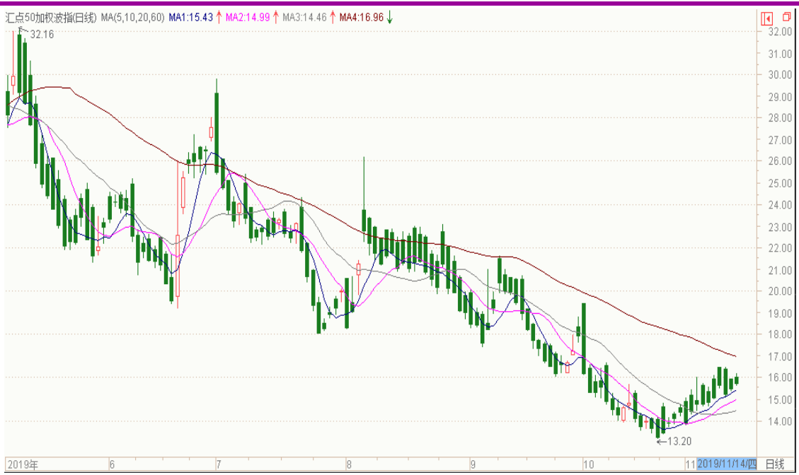
图表 8：来自汇点软件汇点 50 加权波指变化图（日线）