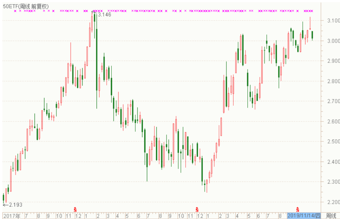
图表 3：上证 50ETF 周 K 线图

从以下的周 K 线图看，50ETF 上周冲高回调，本周低开低走，留意国内外消息面变化。