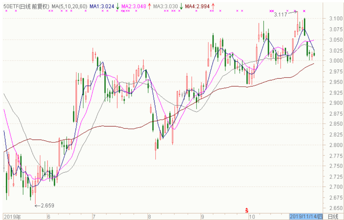
图表 2：上证 50ETF 日 K 线图（前复权）

从下面的日 K 线图来看，50ETF 短期均线转弱，留意 3.000 整数关口一线的变化。