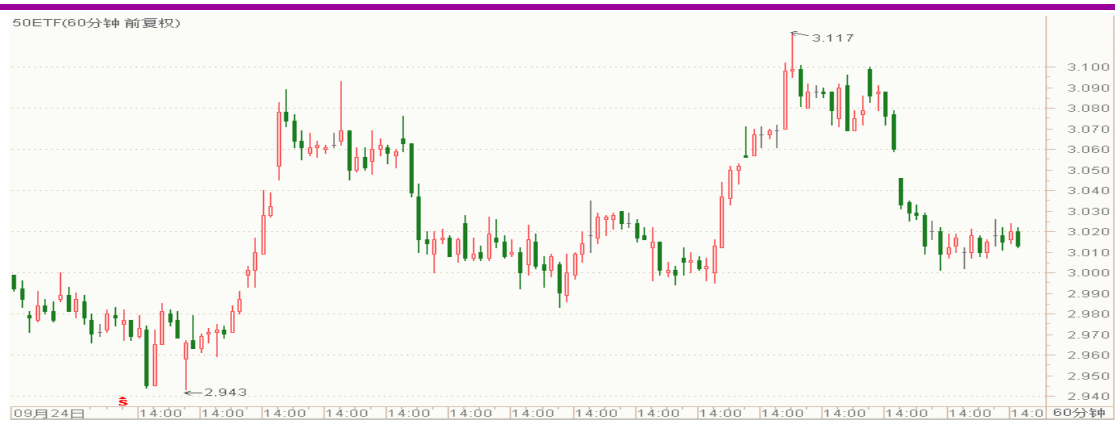
图表 1: 上证 50ETF60 分钟 K 线图