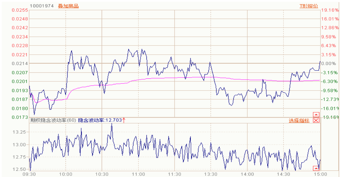
图表 7：50ETF 与 11 月平值认沽期权“50ETF 沽 11 月 3000”日内走势图及隐含波动率走势图