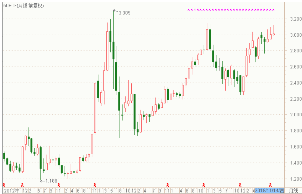
图表 4：上证 50ETF 月 K 线图

从以下的月 K 线图看，50ETF 11 月份创出年内新高后，震荡回落，重回 3.000 一线。