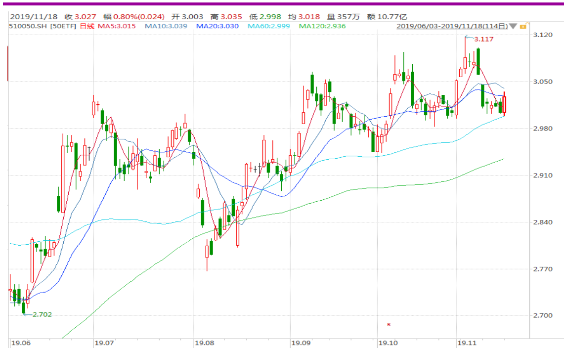
图表 2: 上证 50ETF 日 K 线图 (前复权)