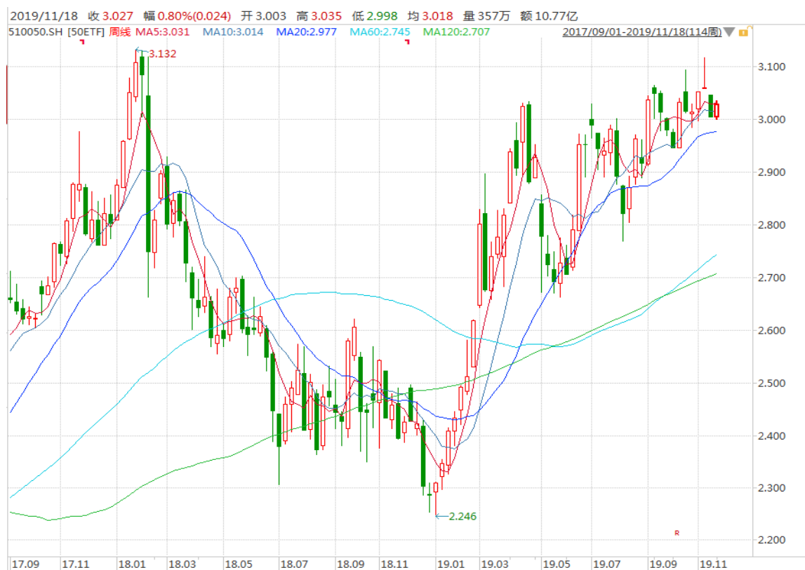
图表 3: 上证 50ETF 周 K 线图