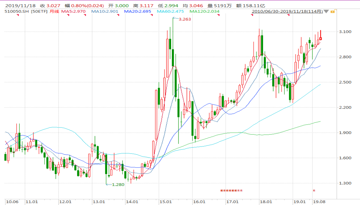
图表 4: 上证 50ETF 月 K 线图

从以下的月 K 线图看，50ETF 11 月份呈现带上影的月 K 线，留意后续变化。