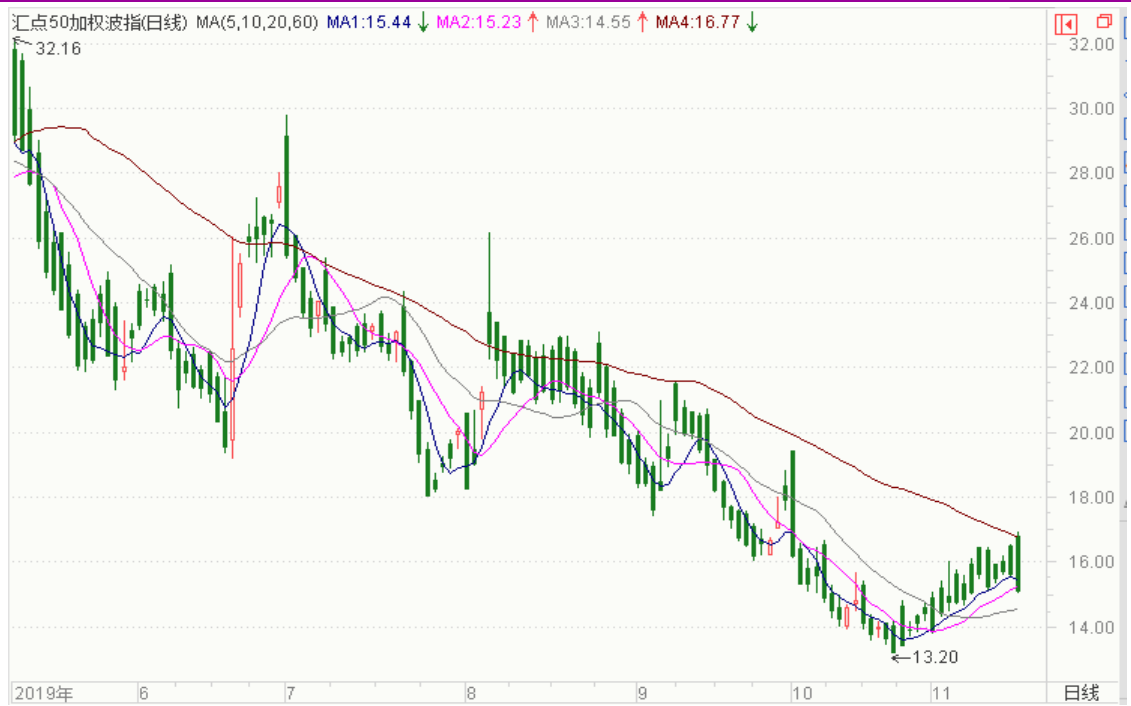
图表 8：来自 wind 金融终端汇点 50 加权波指变化图（日线）

以下也提供来自 wind 金融终端的汇点 50 加权波指变化图（日线），可分析参考。