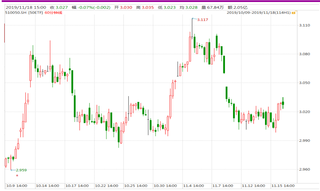
图表 1: 上证 50ETF60 分钟 K 线图

从下面的 60 分钟图来看，50ETF 在跌至 3.000 整数关口一线后出现小幅反弹行情。