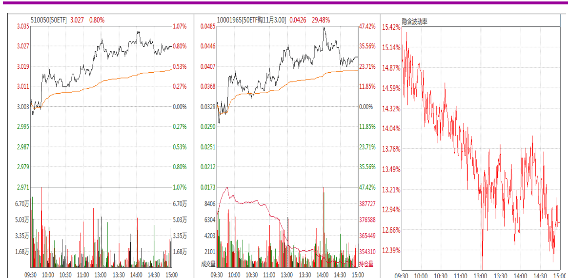
图表 6：11 月平值认购期权“50ETF 购 11 月 3000”日内走势图及隐含波动率变化图