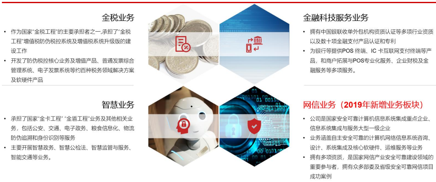
图 1 2019 年公司新增网信业务板块

网信业务迎来发展机遇期，公司加速二次创业，业务及组织架构深度调整，加速网信业务发展： 2019 年上半年公司完成了组织架构的进一步优化调整。将金税及企业市场业务、金融科技及服务业务、物联网技术及应用业务三大业务板块调整变更为金税业务、金融科技服务业务、智慧业务、网信业务四大业务板块。