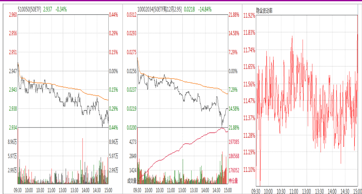
图6：12月平值认购期权“50ETF购12月2950”日内走势图及隐含波动率变化图