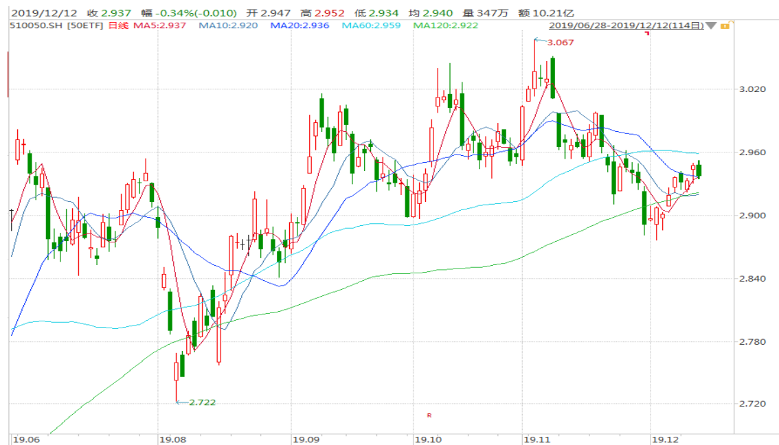
图表 2：上证 50ETF 日 K 线图

从下面的日 K 线图来看，50ETF 反弹至 20 日均线附近徘徊，留意消息面可能影响。