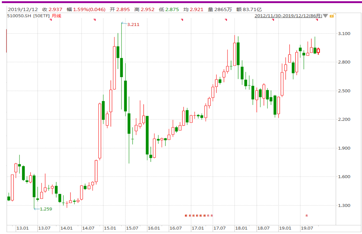
图表 4：上证 50ETF 月 K 线图

从以下的月 K 线图看，50ETF12 月初震荡收高，总体波动幅度较上两个月要更窄。