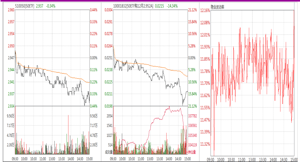
图表 9：12 月平值认购期权“50ETF 购 12 月 2952A”日内走势图及隐含波动率变化图