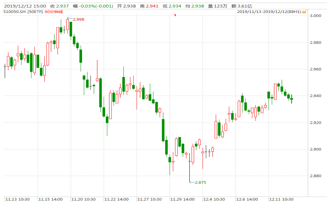
图表 1：上证 50ETF60 分钟 K 线图