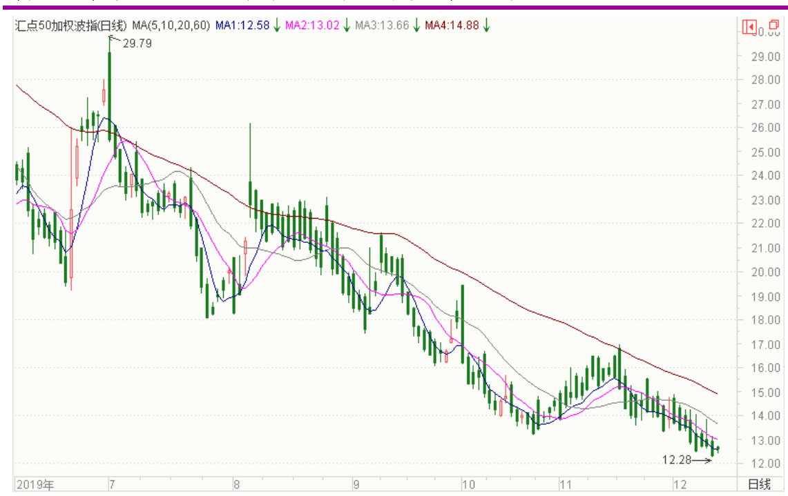
图表 11：来自 wind 金融终端汇点 50 加权波指变化图（日线）

以下也提供来自 wind 金融终端的汇点 50 加权波指变化图（日线），可分析参考。