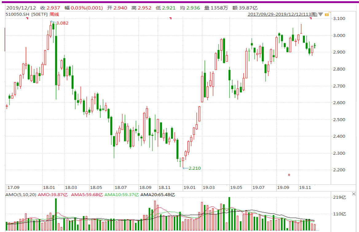
图表 3：上证 50ETF 周 K 线图

从以下的周 K 线图看，50ETF 本周高开后小幅震荡，适当关注周五的收盘价水准。