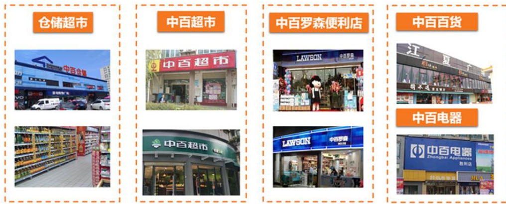
图 2：中百主营业务情况