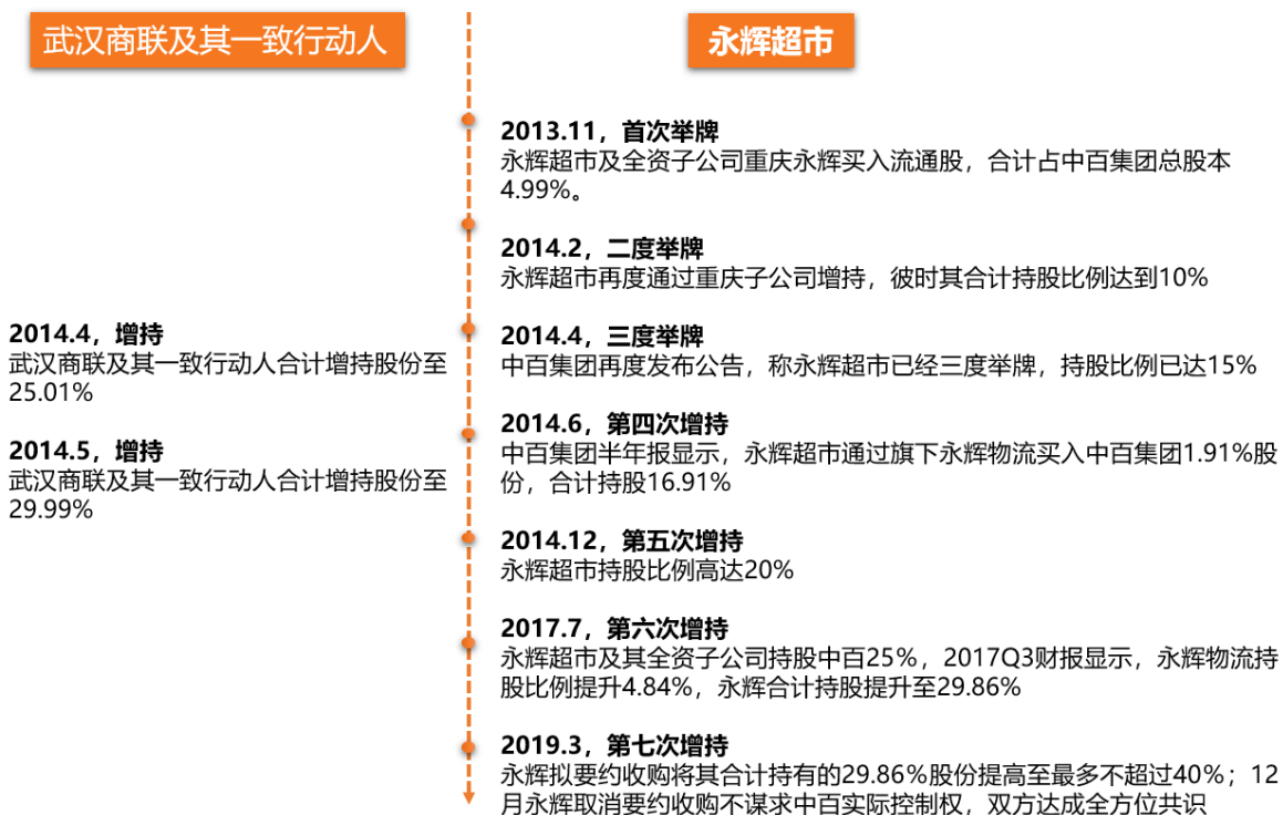
图 2：中百与永辉的股权之争