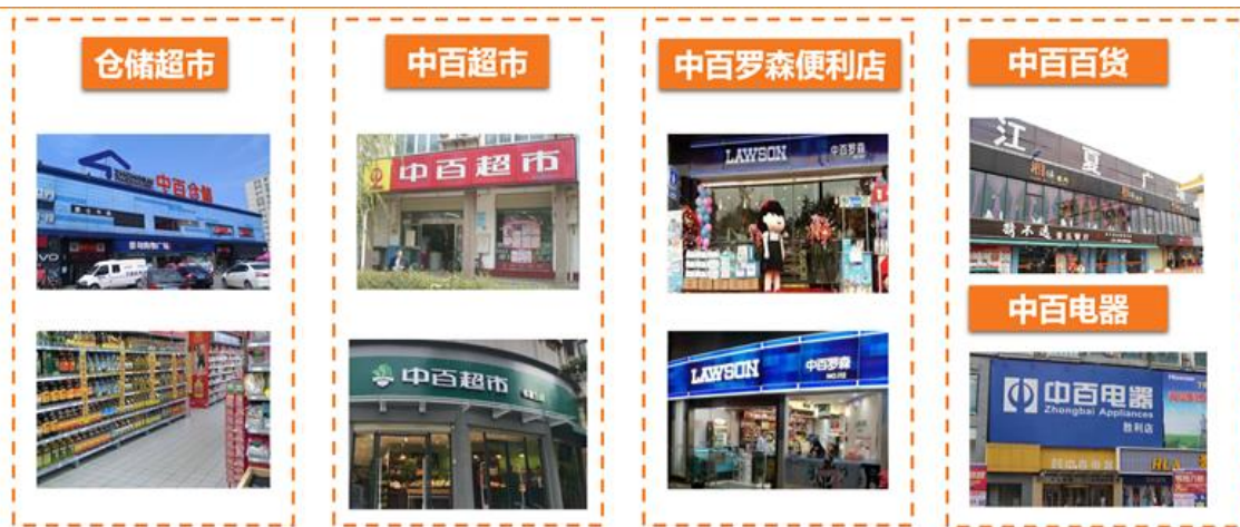
图 4：中百主营业务情况

湖北省内超市龙头公司，线上线下全渠道发展。公司是湖北省内超市龙头，拥有“超市+便利店+百货+电器”多业态。线下方面，截止 2019 年 9 月，公司连锁网点达到 1309 家，其中，中百仓储超市 186 家（武汉市内 82 家、市外湖北省内 73 家、重庆市 31 家）；中百超市 726 家；中百罗森便利店 370 家；中百百货店 9 家；中百电器门店 18 家。同时，公司与多点和淘鲜达达成合作，与微信小程序合作的“High 购中百”上线。线上方面，公司积极推进新零售，加快线上业务布局。截止 2019 年 6 月，公司大力推进 O2O 到家业务，累计注册会员增长 16.97%，月活用户同比增长 47.34%；超市公司“饿了么”新增上线 119 家，“美团”新增上线 80 家。2019 年上半年，两家超市公司及便利店 O2O 到家业务同比增长 92.51%。智能购累计交易额同比增长 36.14%，智能购月活用户同比增长 5.54%。