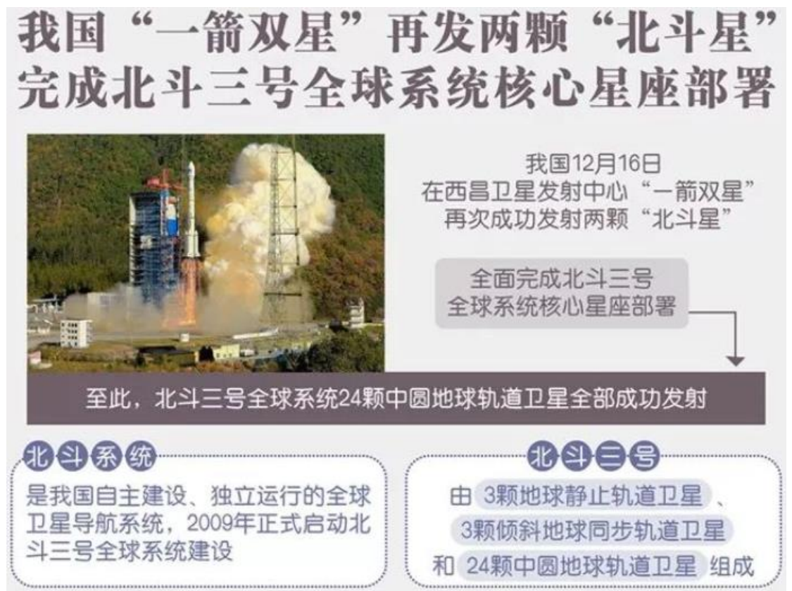
图 1：北斗三号全球卫星导航系统核心星座部署成功

北斗三号全球系统核心星座部署完成，标志着北斗全球服务能力全面实现。今后在全球任意位置、任何时间都能看到五、六颗北斗导航卫星，北斗系统可以为全球用户提供性能优异的导航服务。