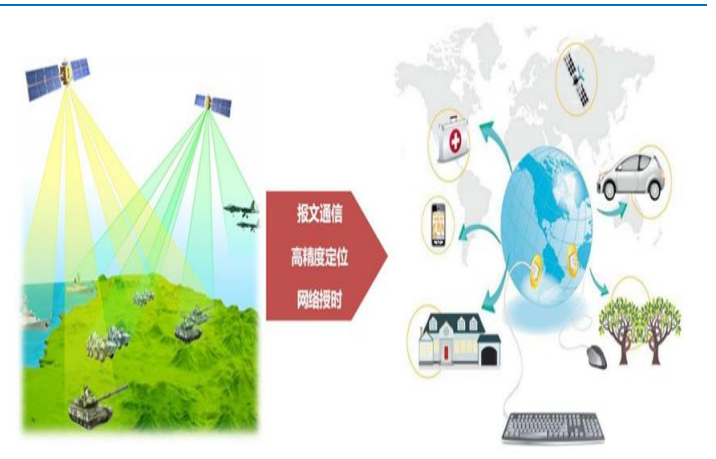
图 3：北斗全球定位导航授时服务系统