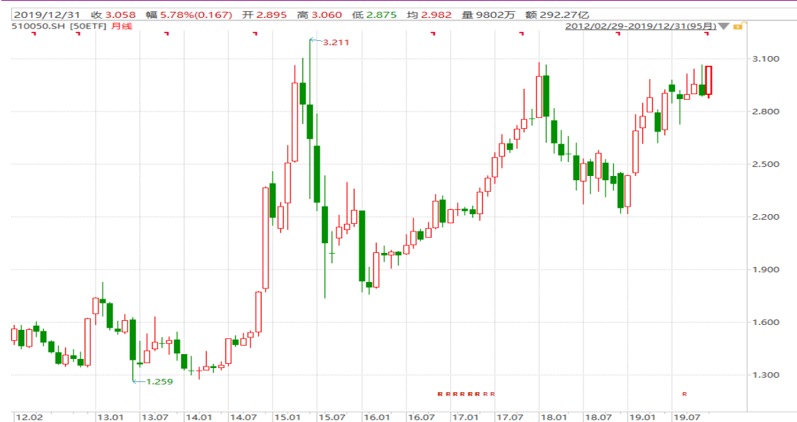
图表 4: 上证 50ETF 月 K 线图

从以下的月 K 线图看，50ETF12 月稳步上行，收出今年 6 月份以来最大月涨幅。