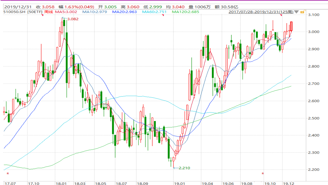
图表 3: 上证 50ETF 周 K 线图