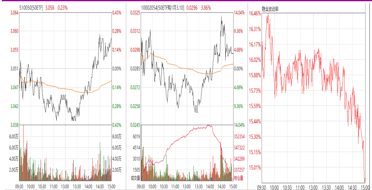
图 6: 1 月平值认购期权“50ETF 购 1 月 3100”日内走势图及隐含波动率变化图