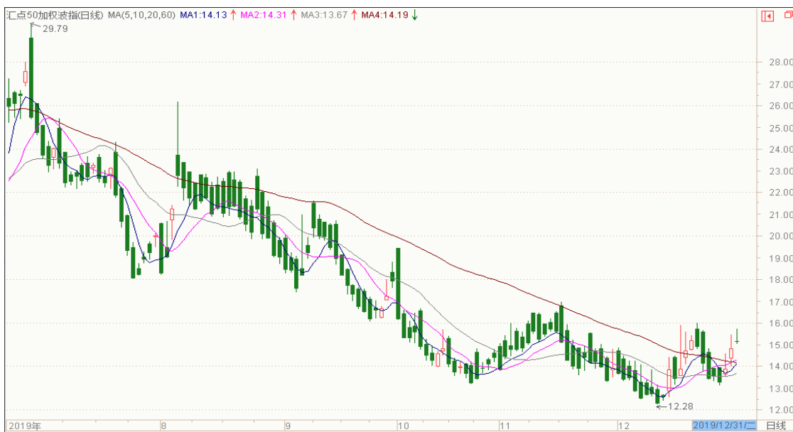
图 9：来自汇点软件汇点 50 加权波指变化图（日线）