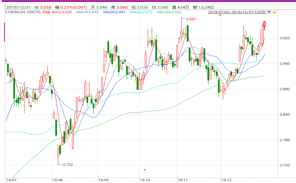
图表 2: 上证 50ETF 日 K 线图