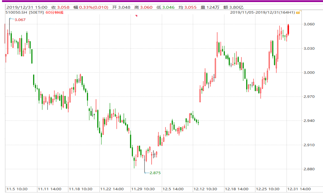
图表 1: 上证 50ETF60 分钟 K 线图