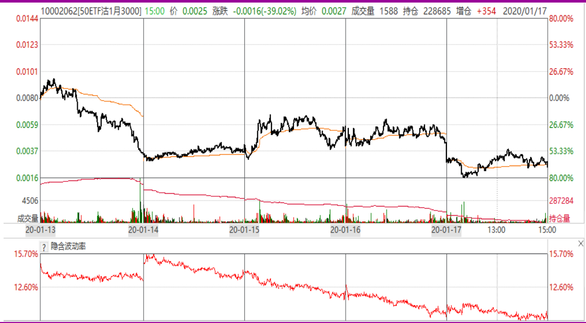
图表 9：本周 1 月平值认沽期权“50ETF 沽 1 月 3000” 日 K 线图及隐含波动率变化图