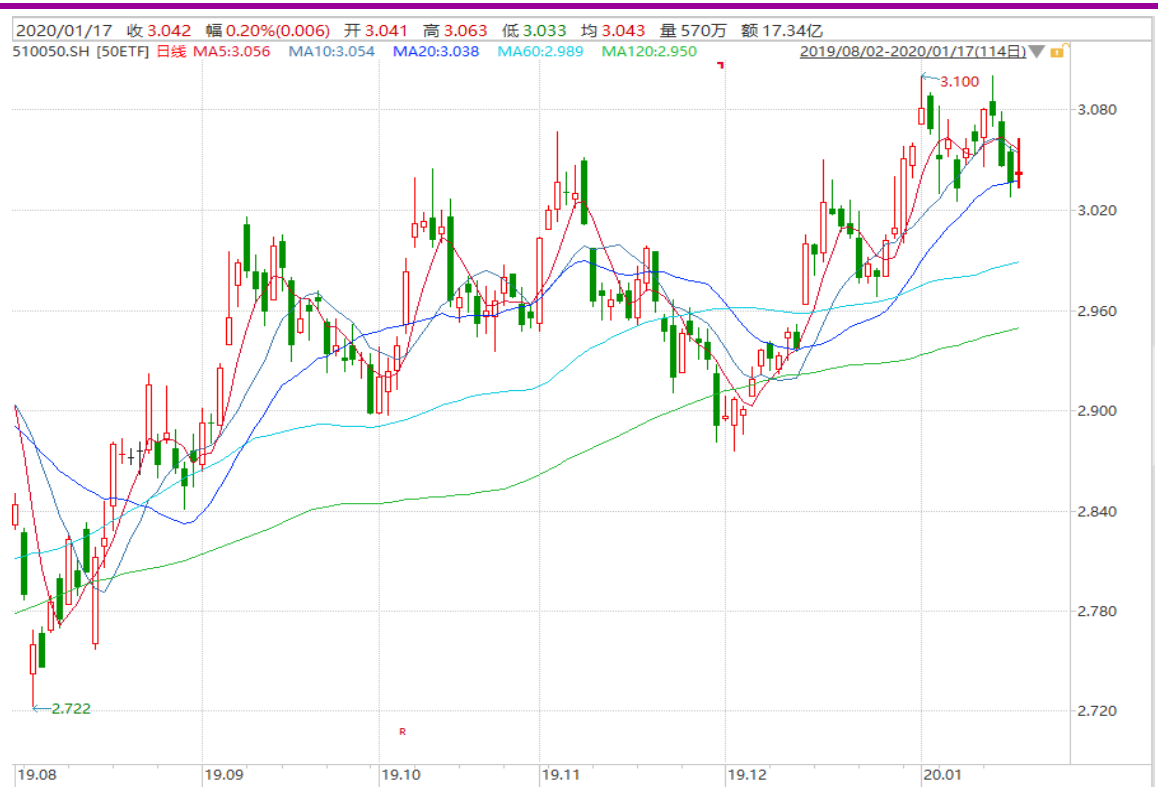
图表 2：上证 50ETF 日 K 线图

以下的日线图显示 50ETF 上探前期高点 3.100 一线受阻，价格震荡回落。