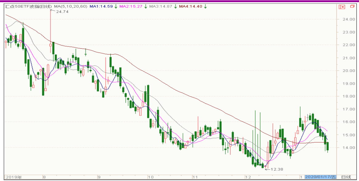
图表 11：来自汇点 50 加权波指变化图