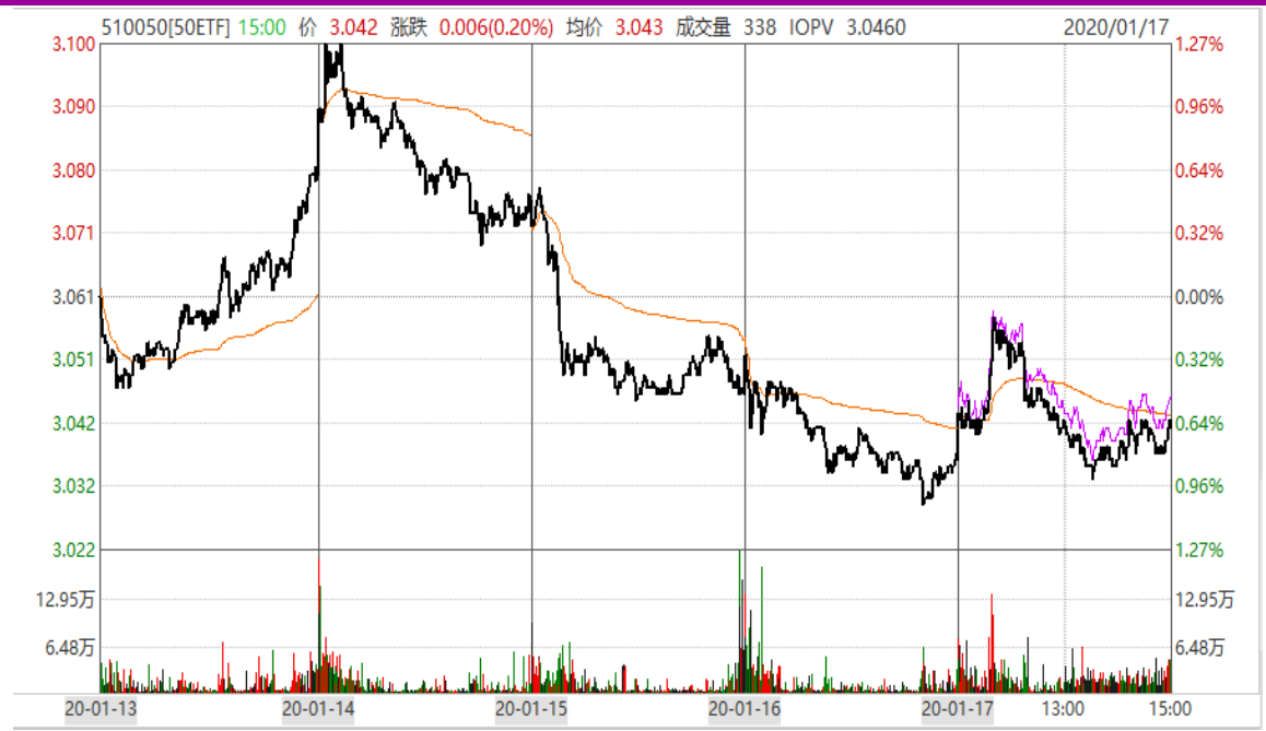
图表 1：上证 50ETF 本周的分时走势图

本周，周一大幅震荡后收高，周二冲高回落，周三、周四震荡下行，周五维持区间震荡。全周收于 3.042，较上周收盘价下跌 0.019，跌幅为 0.62%。