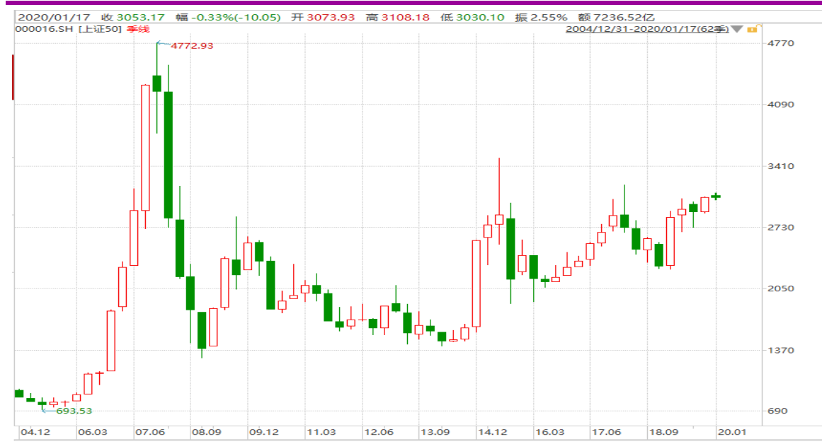
图表 5: 上证 50 指数的季 K 线图

从下面的上证 50 指数的季线图来看，最近四个季度呈现震荡上行迹象，关注消息面。