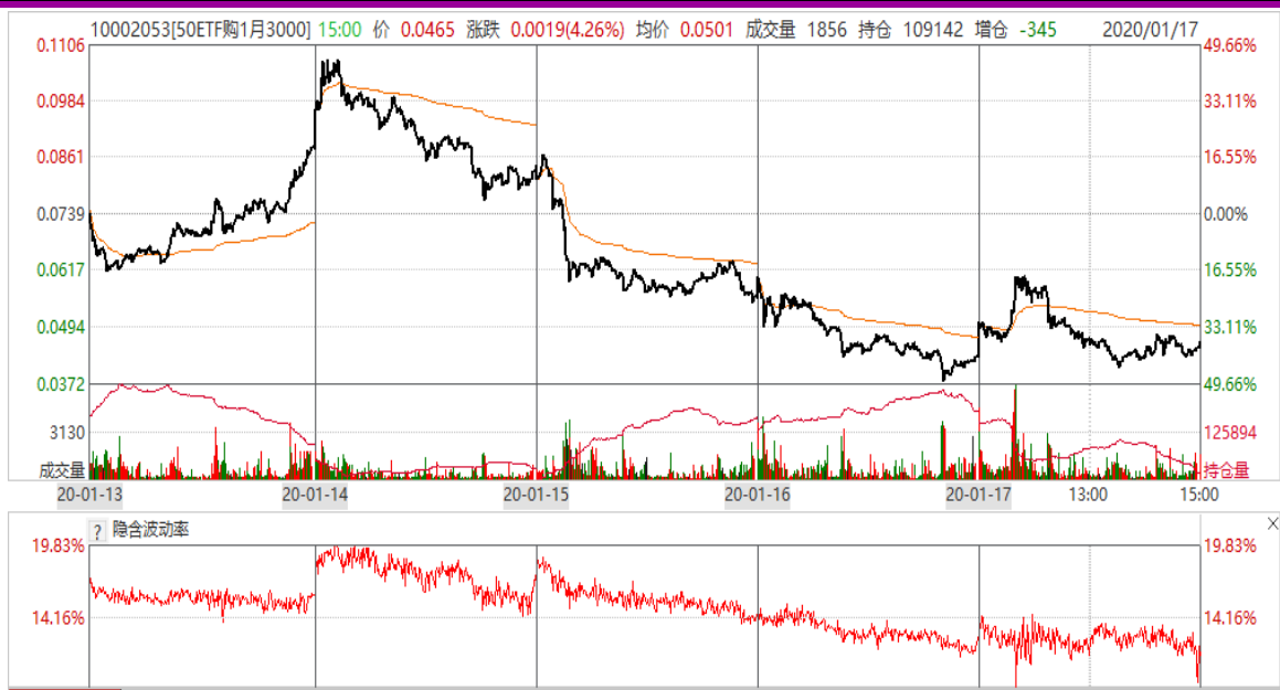
图 8：本周 1 月平值认购期权“50ETF 购 1 月 3000”日 K 线图及隐含波动率变化图