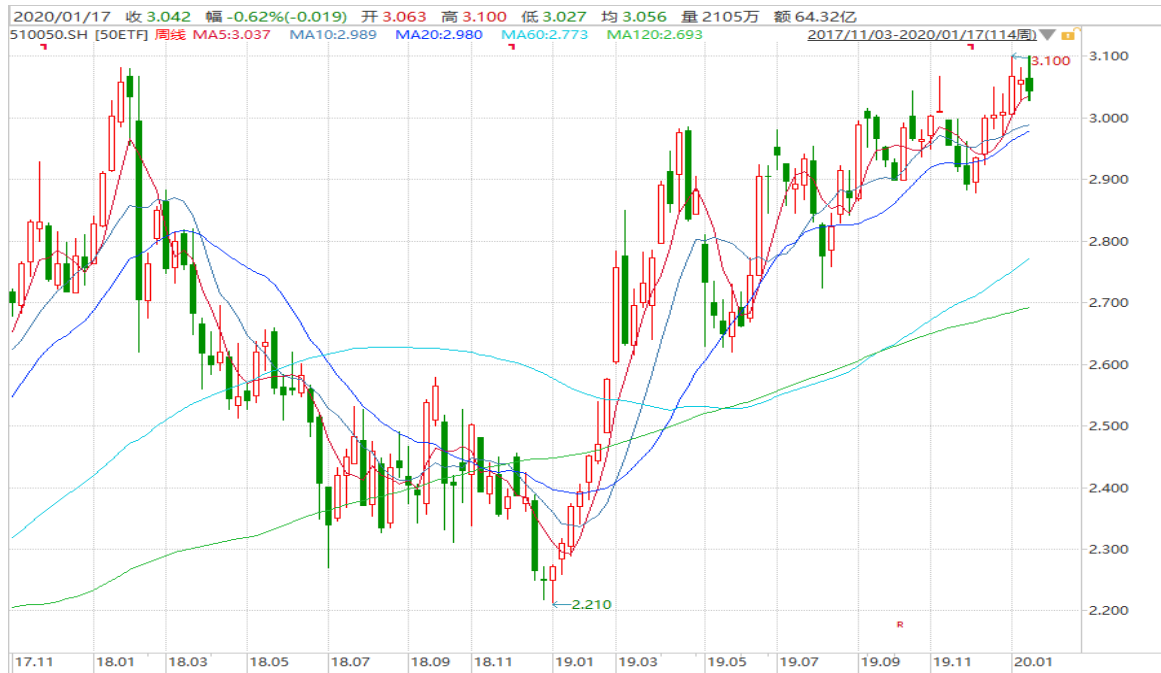
图表 3: 上证 50ETF 周 K 线图