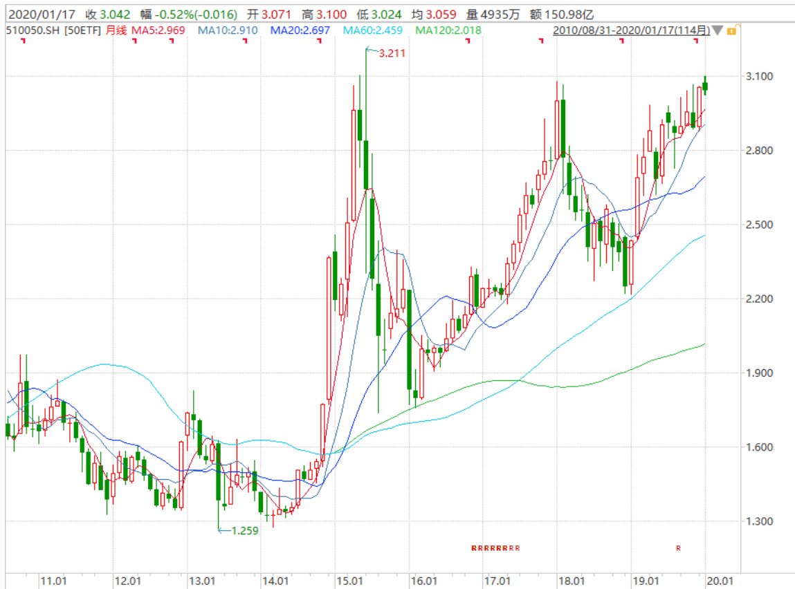
图表 4: 上证 50ETF 月 K 线图

以下月 K 线图显示 50ETF 今年 1 月冲高回落，总体波动幅度较去年 12 月收窄。