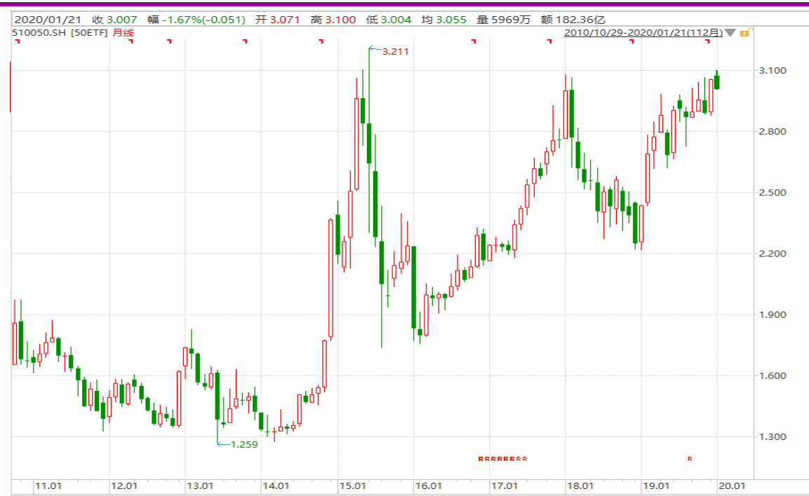
图表 4：上证 50ETF 月 K 线图

从以下的月 K 线图看，50ETF 新年伊始跳空高开，其后冲高回落，留意消息面动向。