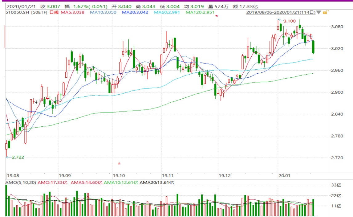
图表 2：上证 50ETF 日 K 线图

从下面的日 K 线图来看，50ETF 跳空下跌，跌破 20 日均线，盘面转弱迹象增多。