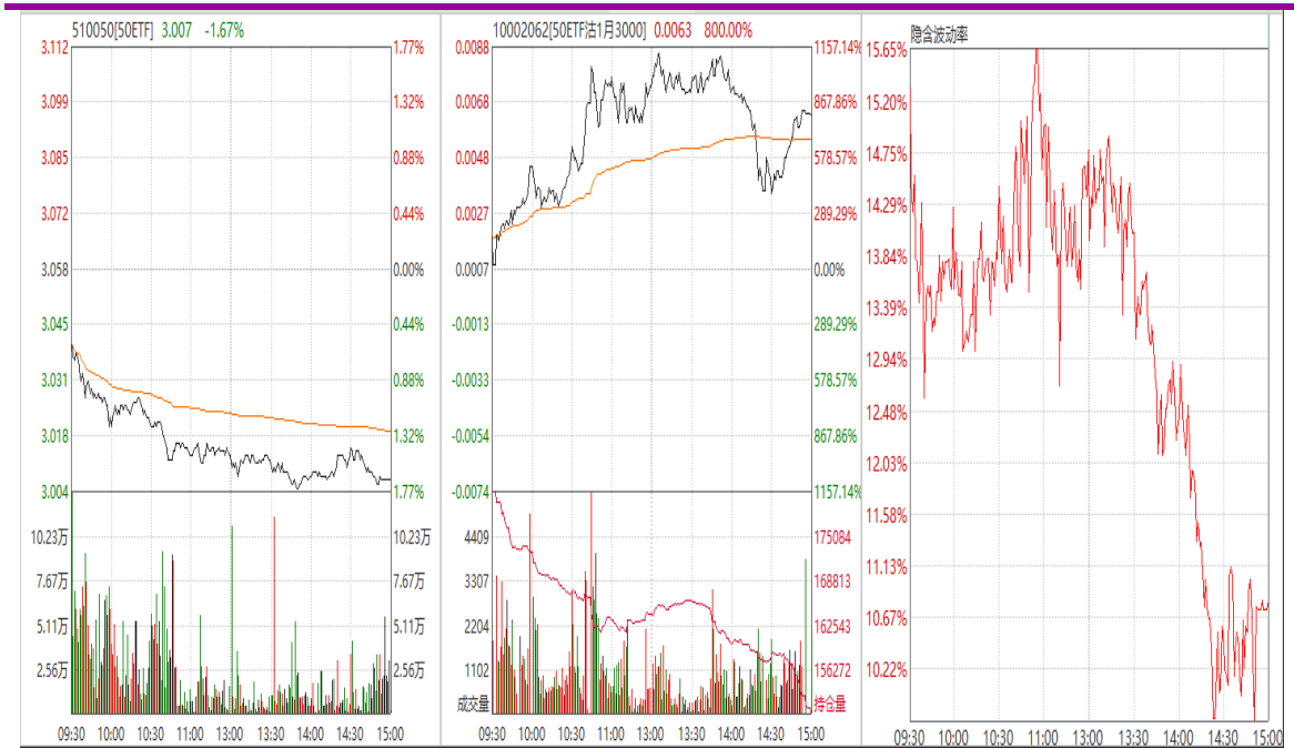
图表 7： 50ETF 与 1 月平值认沽期权“50ETF 沽 1 月 3000”日内走势图及隐含波动率走势图

1 月平值认购期权合约“50ETF 购 1 月 3000”低开低收，隐含波动率先涨后跌。