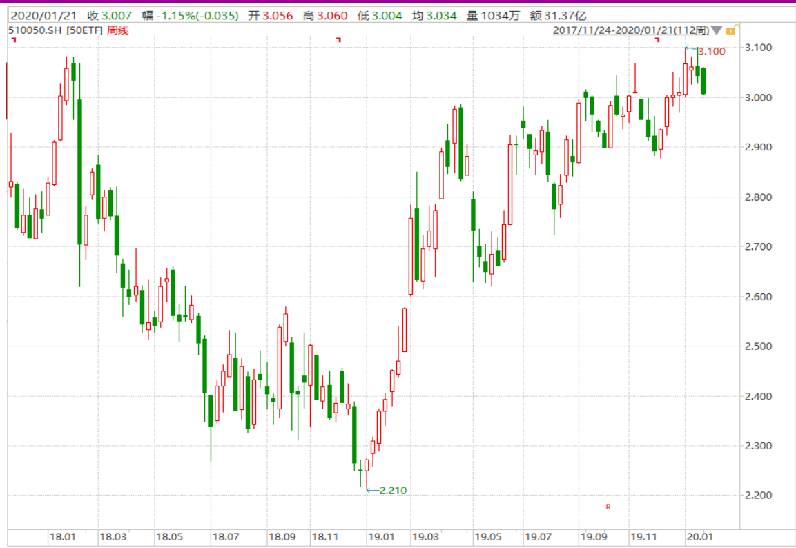
图表 3：上证 50ETF 周 K 线图