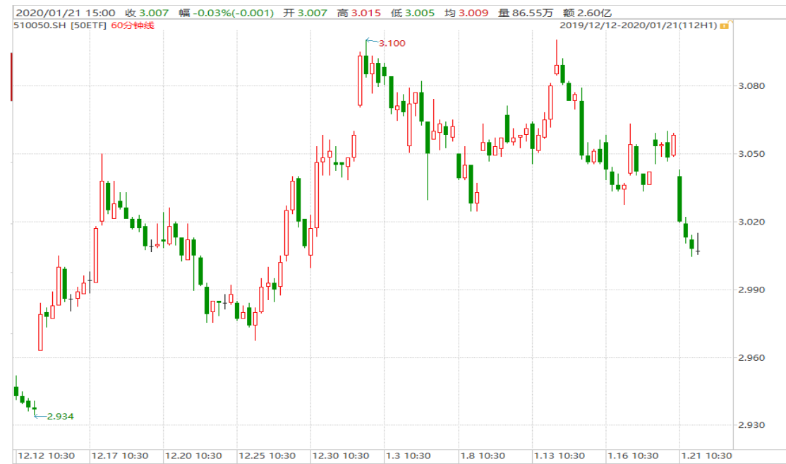
图表 1：上证 50ETF60 分钟 K 线图

从下面的 60 分钟图来看，50ETF 震荡下行，上方 3.100 年内高位压力明显。