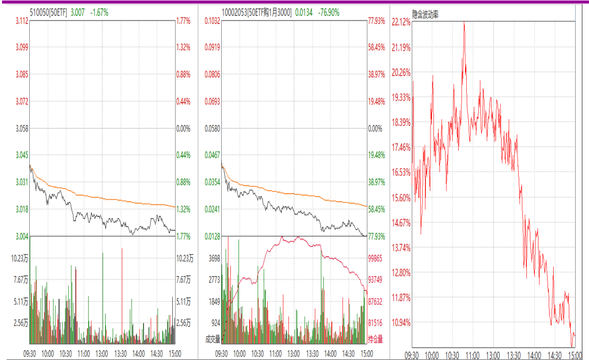
图表 6： 1 月平值认购期权“50ETF 购 1 月 3000”日内走势图及隐含波动率变化图