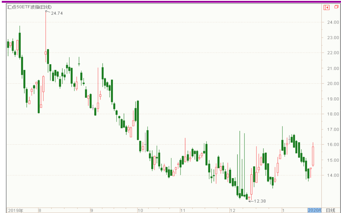
图表 12: 来自汇点软件汇点 50 加权波指变化图 (日线)