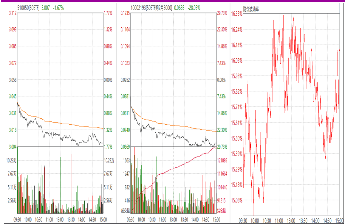
图 9： 2 月平值认购期权“50ETF 购 2 月 3000”日内走势图及隐含波动率变化图