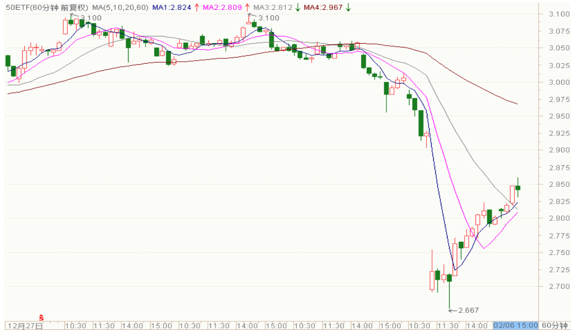
图表 1：上证 50ETF60 分钟 K 线图

从下面的 60 分钟图来看，50ETF 上方跳空缺口仍存，留意今日盘中反弹高点。