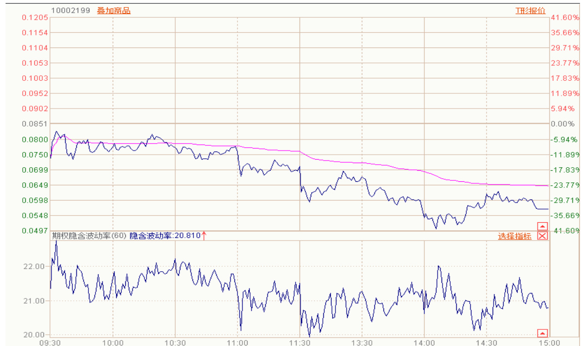
图表 7： 50ETF 与 2 月平值认沽期权“50ETF 沽 2 月 2850”日内走势图及隐含波动率走势图

2 月平值认购期权合约“50ETF 购 2 月 2850”午后涨幅加大，隐含波动率震荡。