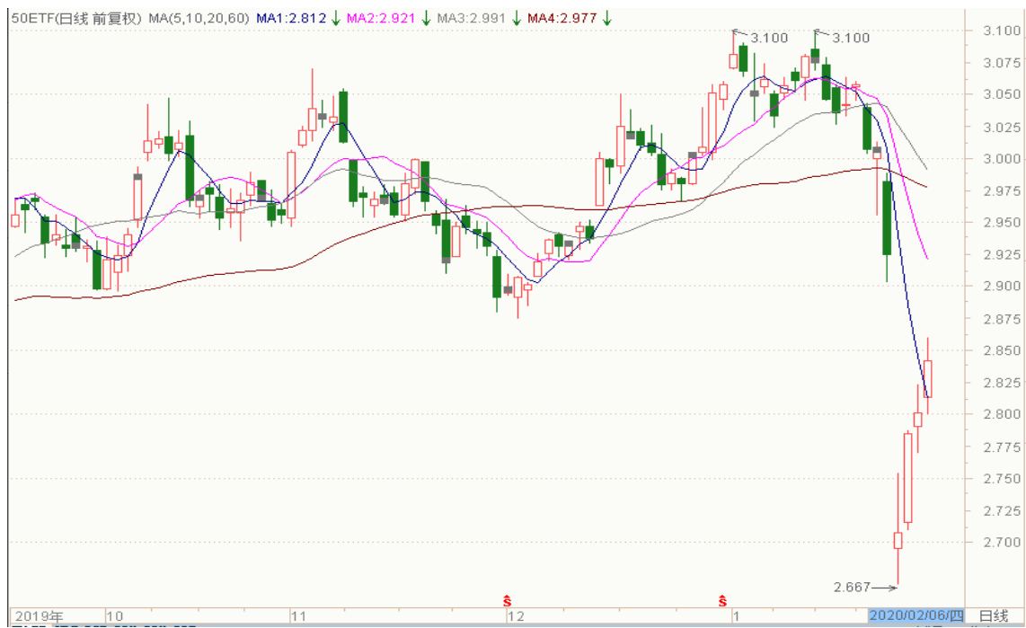
图表 2：上证 50ETF 日 K 线图