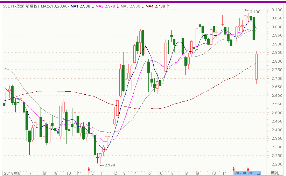
图表 3: 上证 50ETF 周 K 线图

从以下的周 K 线图看，50ETF 本周初大幅低开，其后震荡回升，留意上方的缺口。