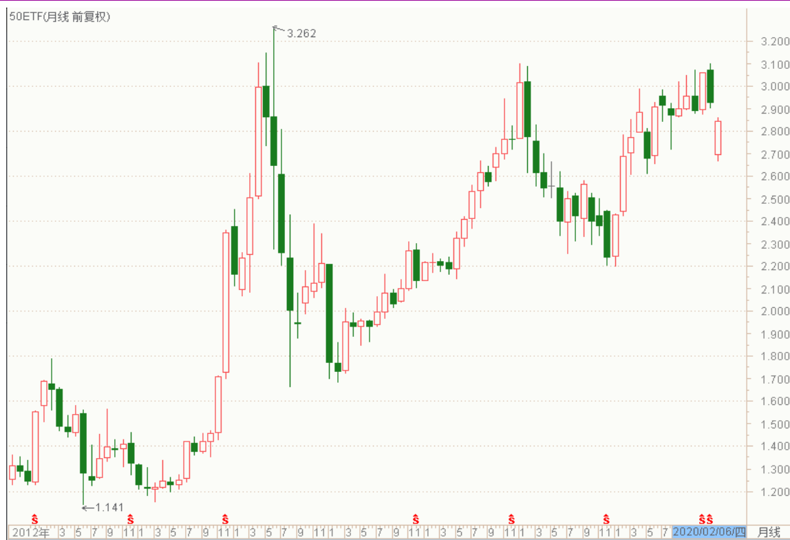
图表 4: 上证 50ETF 月 K 线图

从以下的月 K 线图看，50ETF 本月大幅低开后反弹，留意节后跳空缺口附近变化。