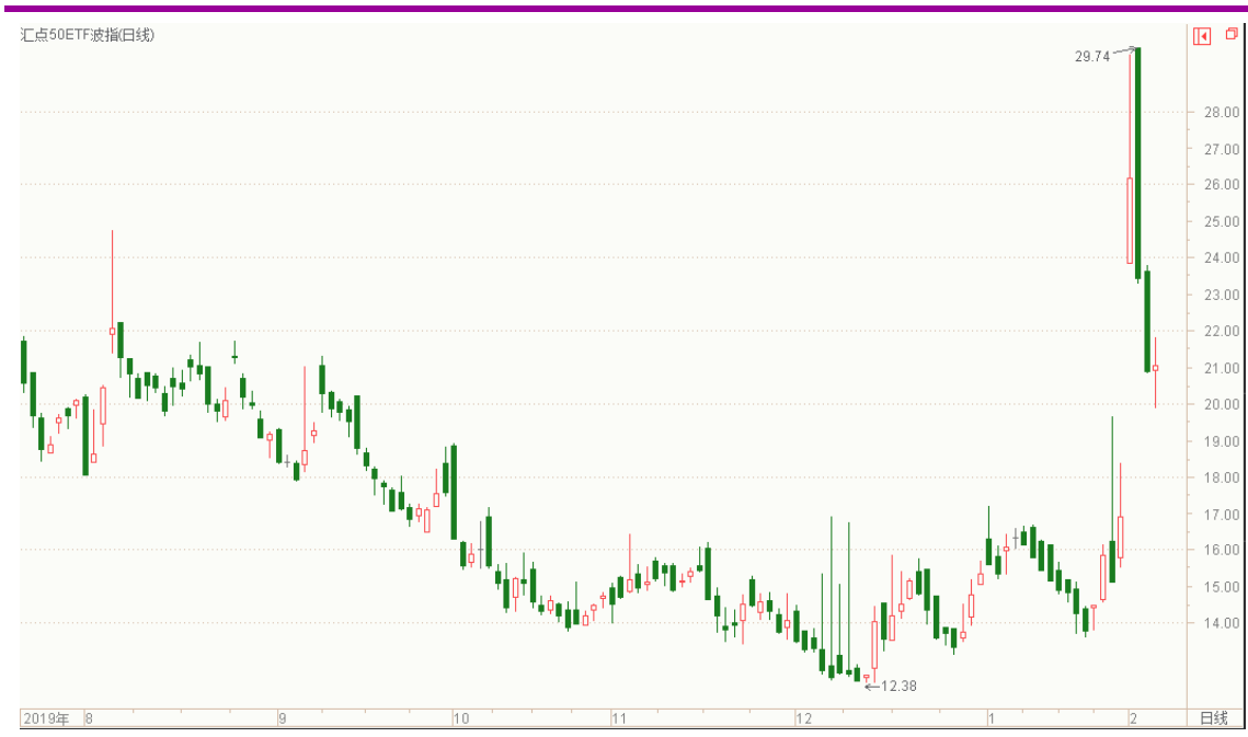
图表 8：来自汇点软件汇点 50 加权波指变化图（日线）