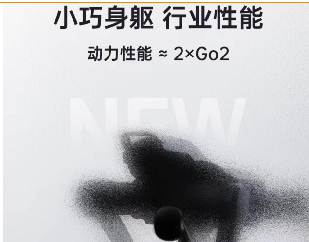
图 5：宇树科技发布四足机器狗新品预告

宇树科技发布四足机器狗新品预告。据官方透露，其动力性能表现十分亮眼，约等于现有产品 Go2 的两倍。表明新品在运动能力、负载能力等方面或许会有显著提升，能更好地适应复杂多变的场景需求，无论是工业巡检、应急救援，还是科研教育、娱乐互动等领域，都可能展现出更强大的应用潜力。