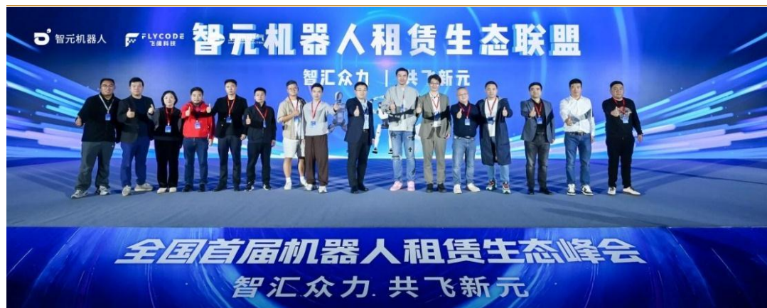
图 2：智元成立机器人租赁生态联盟

均普智能-智元联合研发实验室正式揭牌成立。 该实验室致力于攻坚工业AI底层工具链与工艺级算法平台，推动人工智能从“感知智能”迈向“执行智能”构建“工具链开发-场景验证”闭环生态，为具身智能机器人在工业场景的规模化落地提供核心技术支撑。