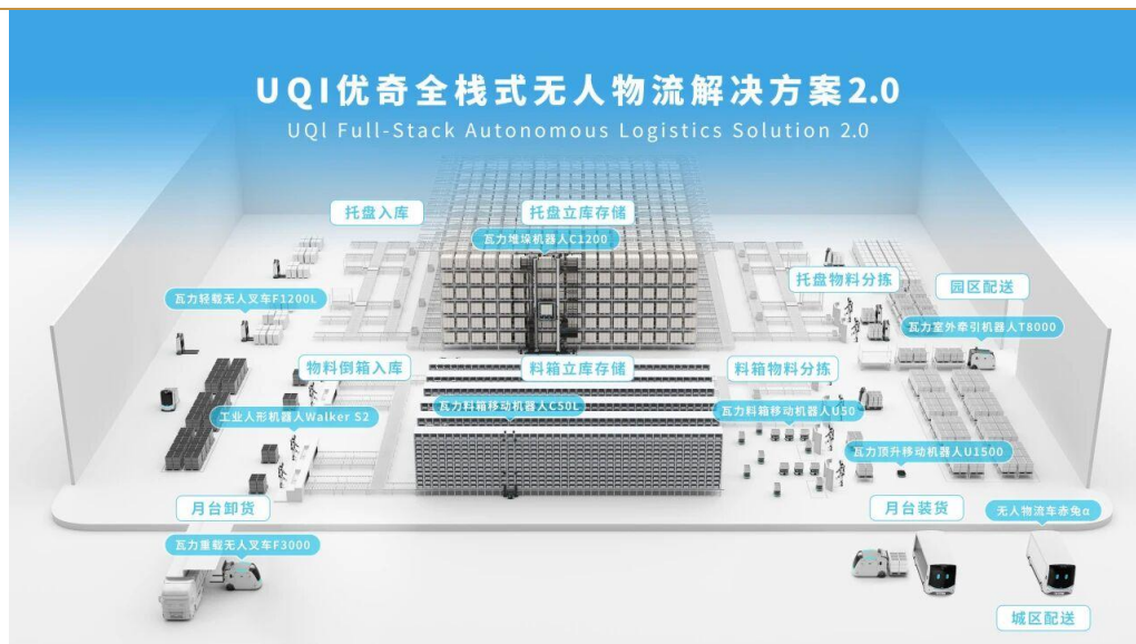
图 3：UQI 优奇全栈式无人物流解决方案 2.0

S2 完成拣选后出库，从而实现“原料卸货-收货入库-立库存储-拣选出库”全流程无人化，完成从“多机智能”到“全栈效能”的无人物流进化。