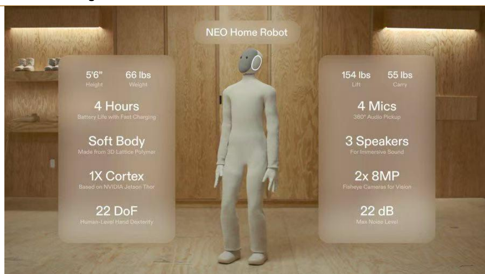
图 4：1X Technologies 家用机器人 NEO

1X Technologies 正式发布家用机器人 NEO。 NEO 已在官网开启预订，售价 2 万美金，可采用订阅形式，每月 499 美元。NEO 预计于 2026 年开始交付，主打为家庭而生，其外观和材质设计都优先考虑家庭环境，并且可以自主做家务，也能够跟家庭成员进行自然的互动交流。在基础参数上，NEO 机器人身高约为 167cm，体重约 30 公斤，拥有 22 个自由度，配备 NVIDIA Jetson Thor 芯片，电池支持 4 小时的续航，同时其搭载了全身控制系统，可像人一样走路、摆臂、蹲下捡物、坐下，还具备视觉操作模型，能在未训练环境识别抓取不同物体。公司称其硬件可靠性提升 10 倍、运作噪音降低约 10dB，更适应家庭环境。