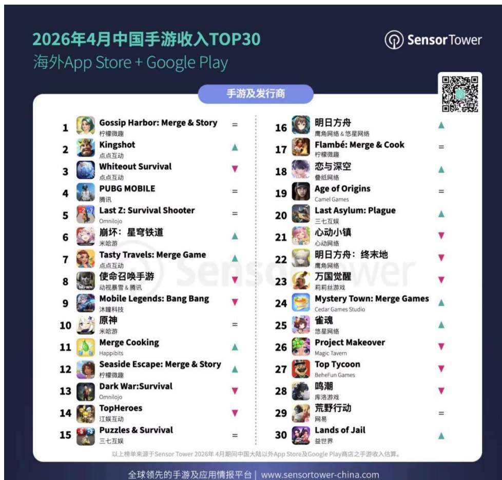
图3：2026 年 4 月中国手游收入 TOP30|海外 AppStore+GooglePlay

根据 SensorTower 数据,2026 年 4 月中国手游收入前三名分别为柠檬微趣《Gossip Harbor: Merge&Story》、点点互动《Kingshot》和点点互动《Whiteout Survival》。