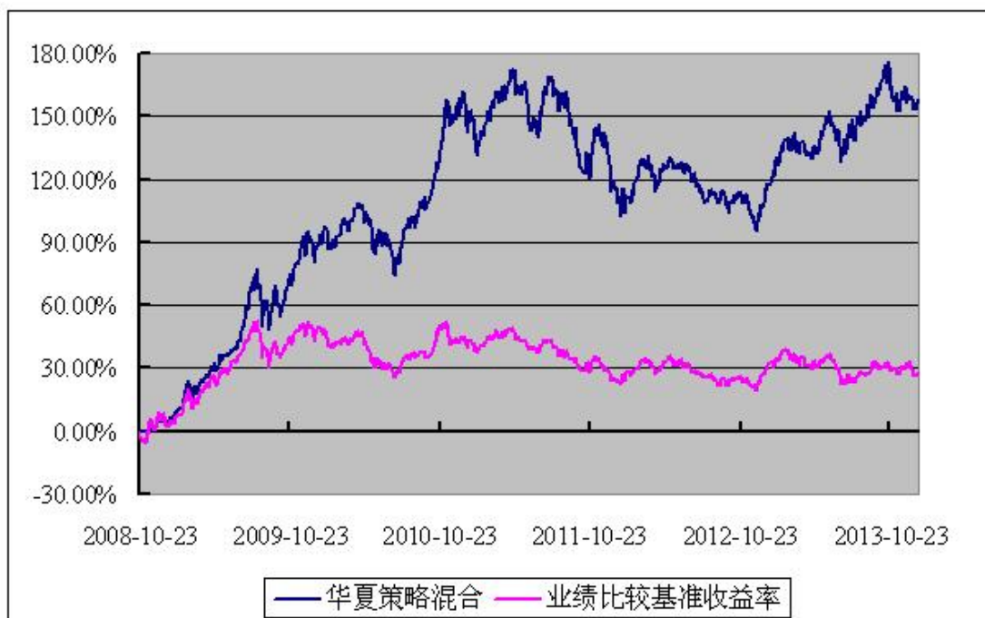
华夏策略精选灵活配置混合型证券投资基金 份额累计净值增长率与业绩比较基准收益率历史走势对比图 (2008年10月23日至2013年12月31日)