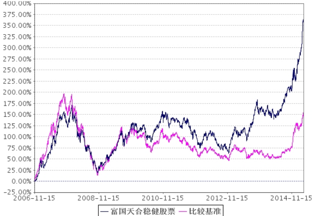
2、自基金合同生效以来富国天合稳健优选股票型证券投资基金累计份额净值增长率与业绩比较基准收益率的历史走势对比图