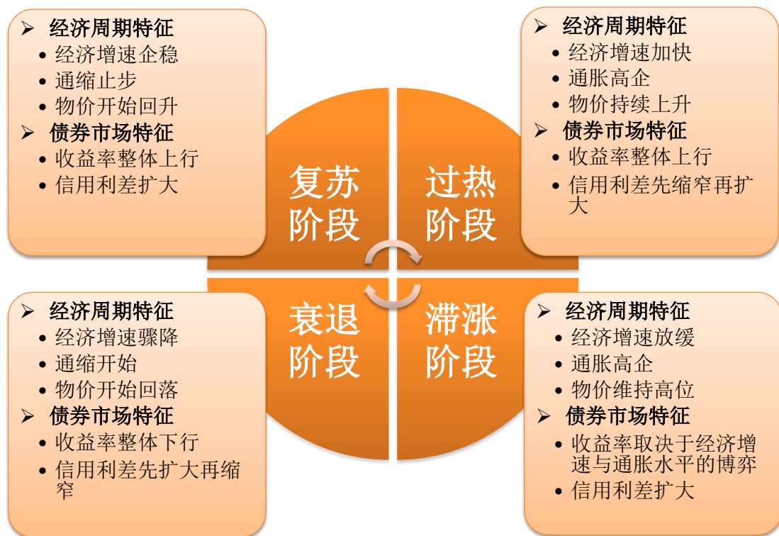
图1 宏观经济周期变动与信用利差

本基金认为，债券收益率的整体走势及信用利差随经济周期的轮动而变动，尤其是中长端收益率与低评级信用债。在复苏阶段，收益率整体呈上行态势，呈牛市变平特征；信用债的信用利差主要受债市熊市带来的流动性风险的影响，呈持续扩大趋势。在过热阶段，收益率整体呈上行态势，期限收益率曲线斜率取决于资金面的状况；初期受益于较快的经济增速，信用利差先行缩窄；中后