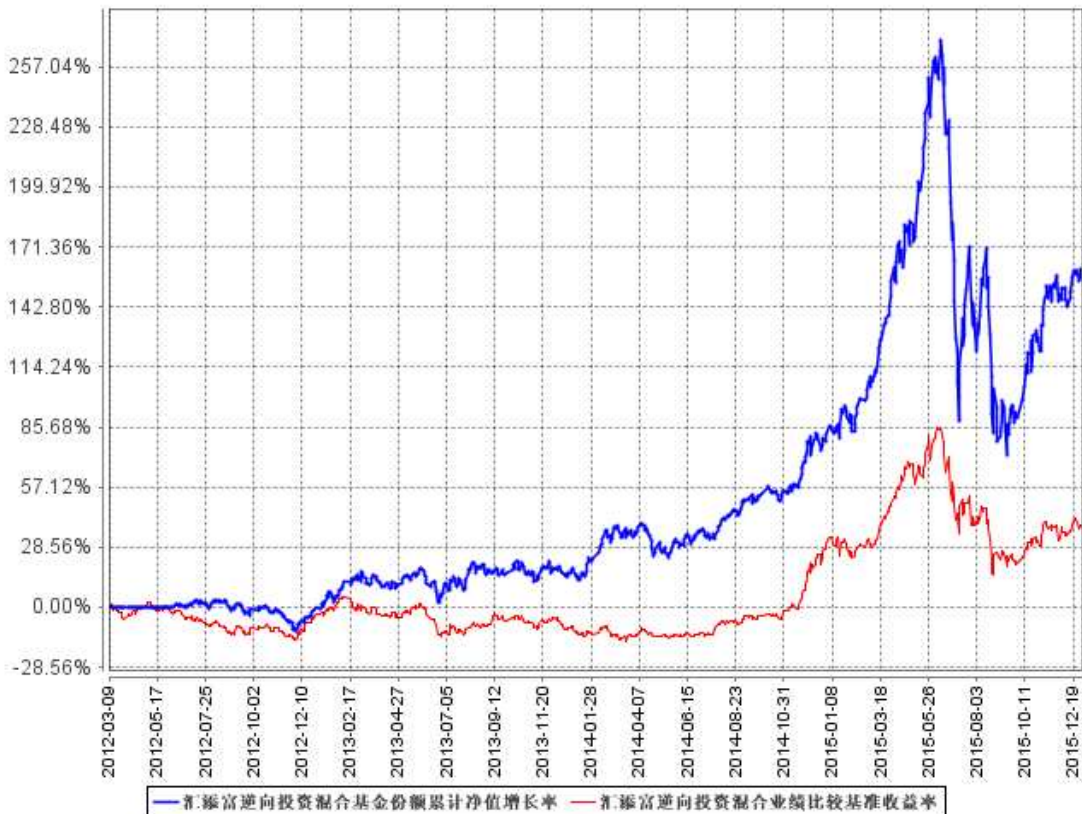
汇添富逆向投资混合基金份额累计净值增长率与同期业绩比较基准收益率的历史走势对比图

注：本基金建仓期为本《基金合同》生效之日(2012年3月9日)起6个月，建仓期结束时各项资产配置比例符合合同规定。