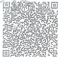
在线扫码获取详细信息