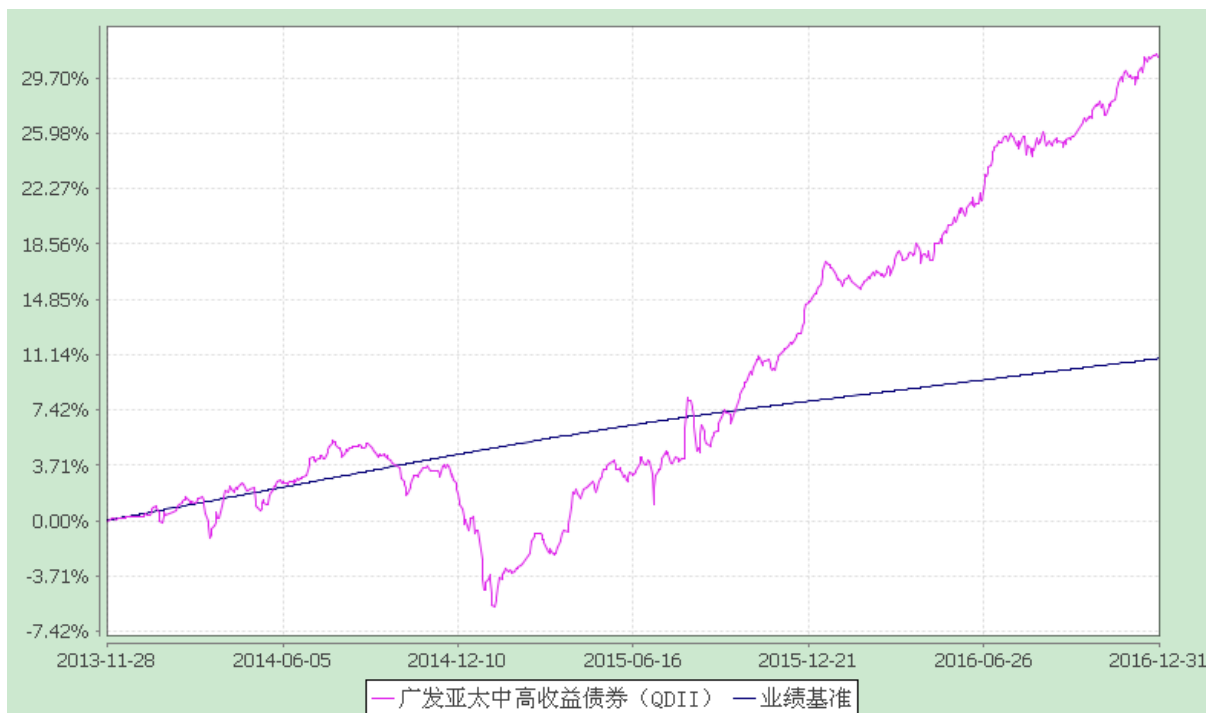
广发亚太中高收益债券型证券投资基金 份额累计净值增长率与业绩比较基准收益率历史走势对比图 (2013 年 11 月 28 日至 2016 年 12 月 31 日)

注：本基金建仓期为基金合同生效后六个月，建仓期结束时各项资产配置比例符合本基金合同有关规定。