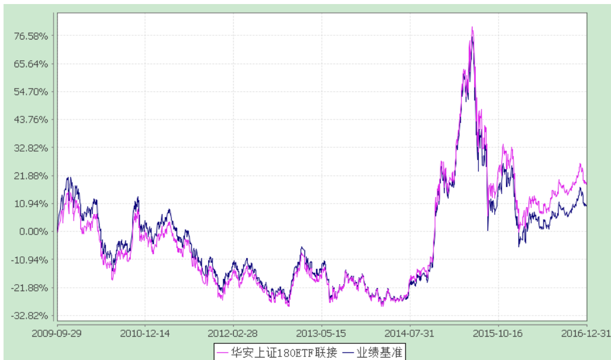
自基金合同生效以来份额累计净值增长率与业绩比较基准收益率的历史走势对比图 (2009 年 9 月 29 日至 2016 年 12 月 31 日)