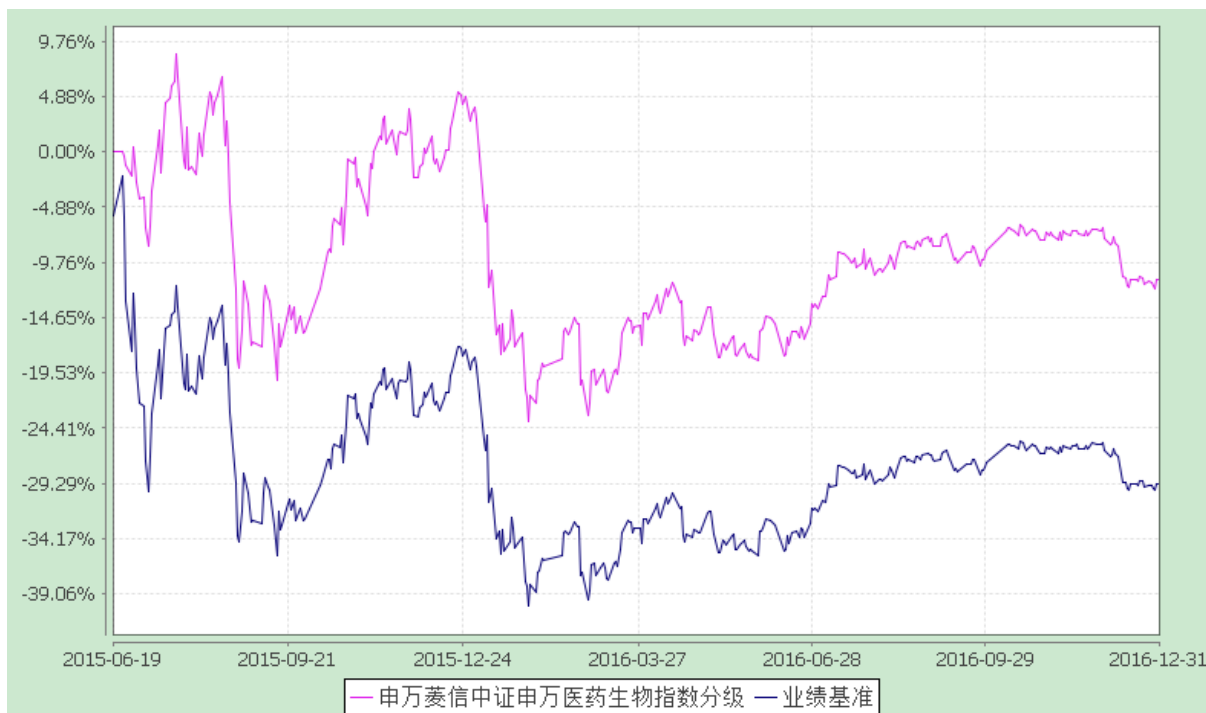
自基金合同生效以来份额累计净值增长率与业绩比较基准收益率的历史走势对比图 (2015 年 6 月 19 日至 2016 年 12 月 31 日)