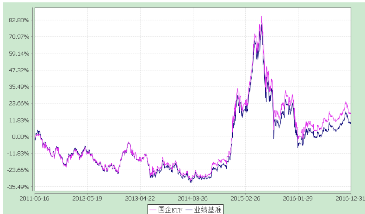
份额累计净值增长率与业绩比较基准收益率的历史走势对比图 (2011 年 6 月 16 日至 2016 年 12 月 31 日)

注：按基金合同规定，本基金自基金合同生效起 3 个月内为建仓期，截至建仓结束时本基金的各项投资比例已达到基金合同第十六部分（三）的规定，即本基金主要投资于标的指数成份股、备选成份股。为更好地实现投资目标，本基金可少量投资于非成份股、新股、债券及中国证监会允许基金投资的其他金融工具。在建仓期完成后，本基金投资于标的指数成份股票及备选成份股票的比例不低于基金资产净值的 90%，但因法律法规的规定而受限制的情形除外。法律法规或监管机构日后允许本基金投资的其他投资工具，基金管理人在履行适当程序后，可将其纳入投资范围。