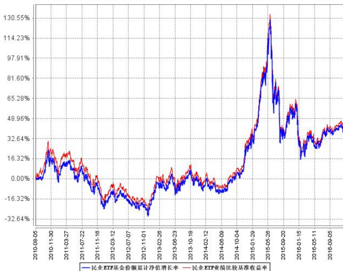
民企ETF基金份额累计净值增长率与同期业绩比较基准收益率的历史走势对比图