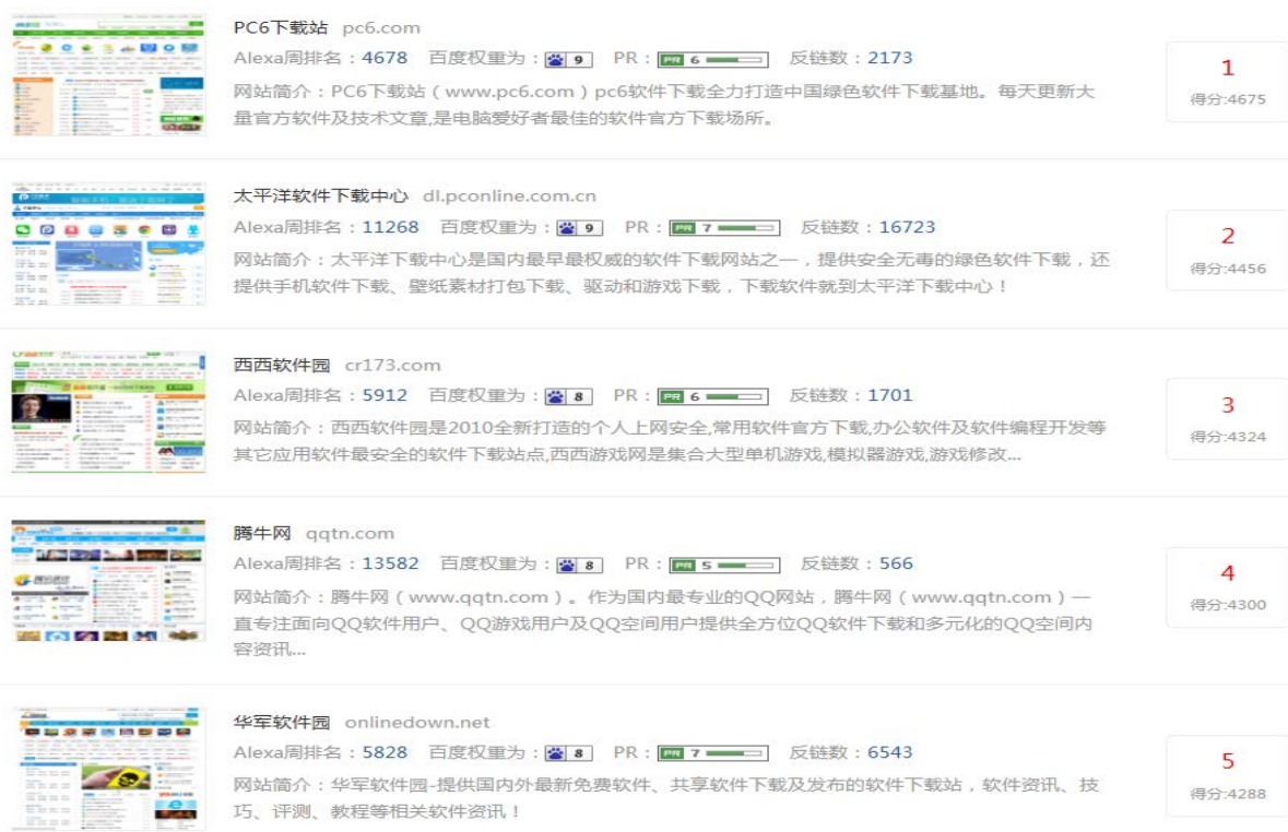
图: 站长之家网站统计排名截图 (2016 年 12 月 31 日)

综合统计 | Alexa排名 | 百度权重 | PR值 | 移动排名 | 排名变化