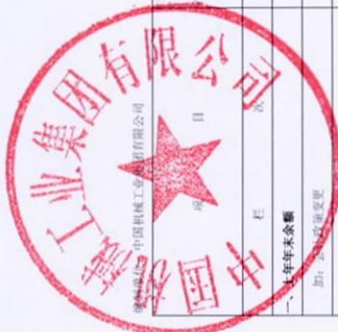
合并所有者权益变动表 2016年度