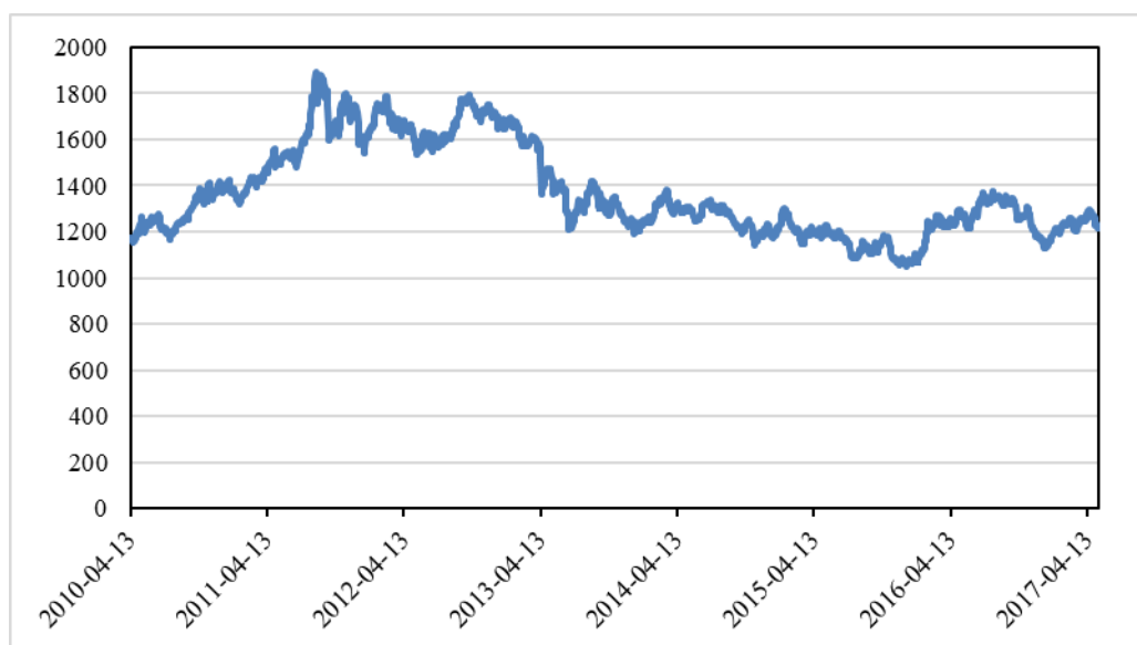
图-2010 年 4 月至 2017 年 4 月黄金期货价格趋势

2016 年国际金价以 1,061.20 美元/盎司开盘，最高至 1,375.15 美元/盎司，最低至 1,061.20 美元/盎司，最终全年报收于 1,151.10 美元/盎司，全年累计上涨幅度约 8.48%，全年平均价为 1,246.14 美元/盎司。上海黄金交易所的“9995 金”以人民币 224.60 元/克开盘，最高至人民币 295.35 元/克，最低至人民币 223.50 元/克，收盘价为人民币 264.50 元/克，全年累计上涨幅度约为 17.76%，全年平均价约为人民币 265.06 元/克，比去年上涨约 13.20%。