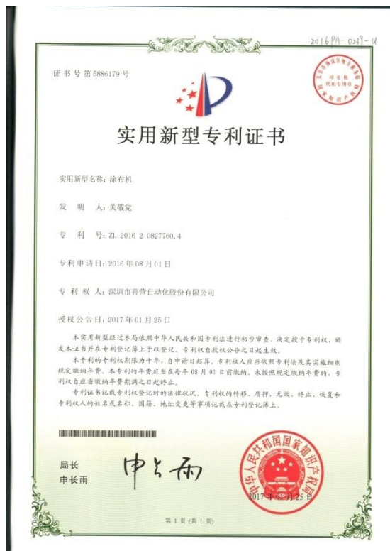
2017年1月25日获得涂布机实用新型专利授权。