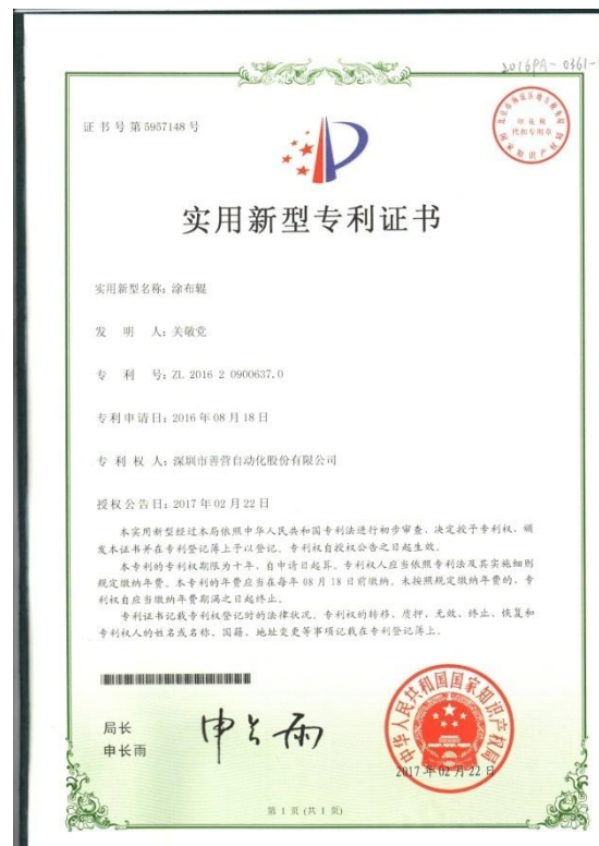
2017年2月22日获得涂布辊实用新型专利授权。