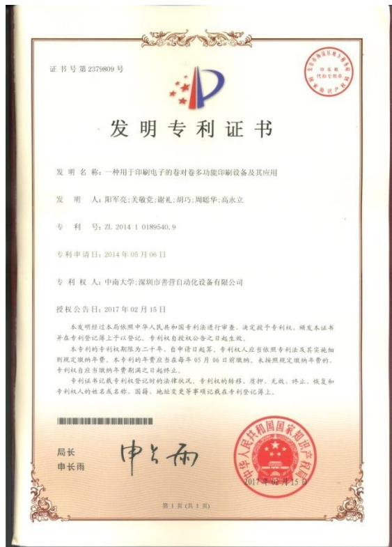
2017年2月15日获得一种用于印刷电子的卷对卷多功能印刷设备及其应用发明专利授权。