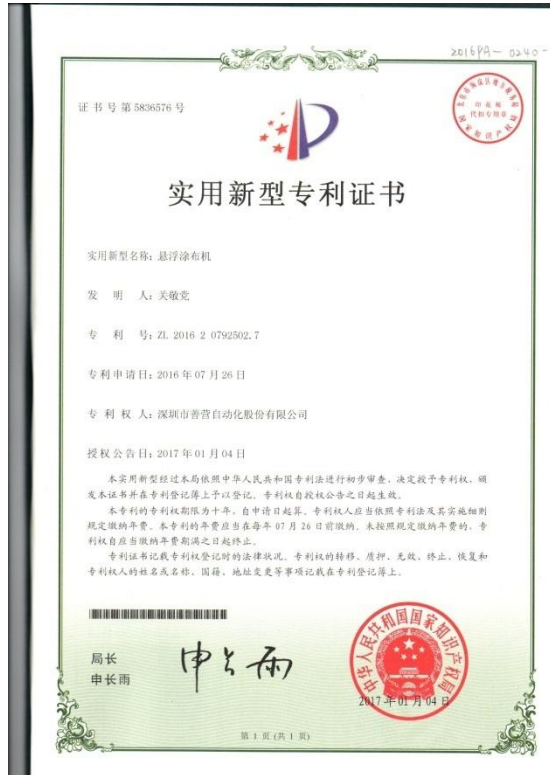
2017年1月4日获得悬浮涂布机实用新型专利授权。