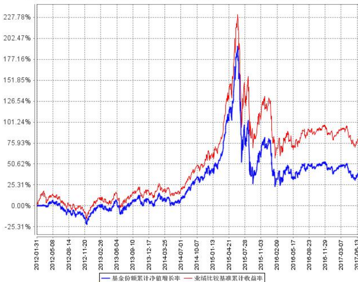
基金份额累计净值增长率与同期业绩比较基准收益率的历史走势对比图