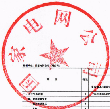
所有者权益变动表